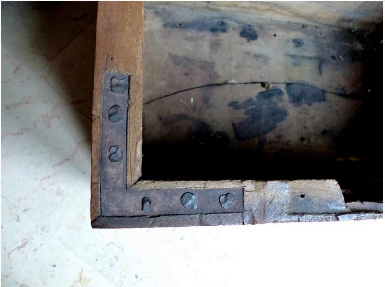
Détail de l'assemblage.