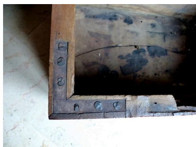
Détail de l'assemblage.