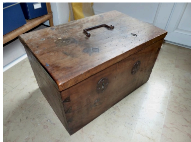
Vue de trois-quart avant.