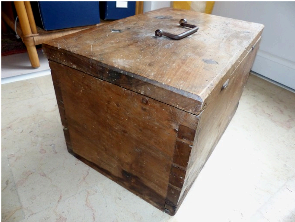
Vue de côté.