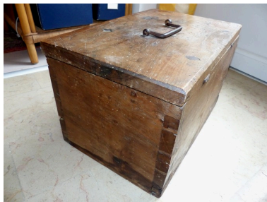
Vue de côté. IVR84_20162601098NUCA