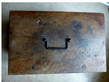
Vue de dessus. IVR84_20162601101NUCA