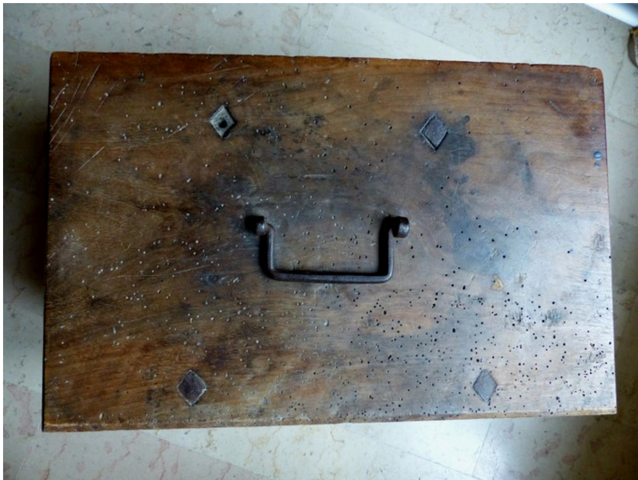
Vue de dessus.