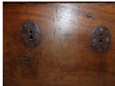
Face avant, détail des ferrures de serrure.