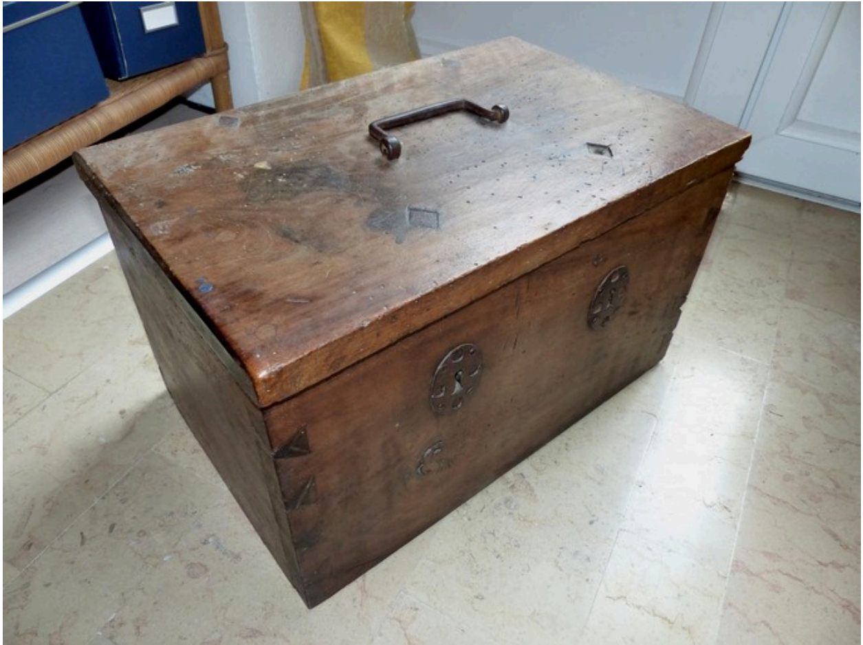
Vue de trois-quart avant.