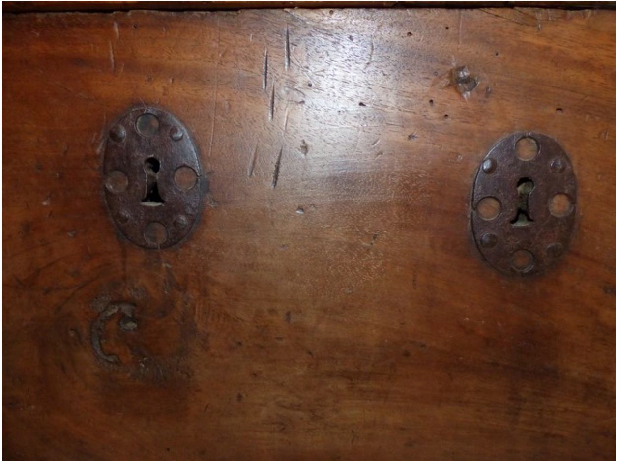
Face avant, détail des ferrures de serrure.