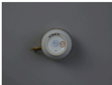
Vue du dessous de la tasse IVR84_20226300071NUC4A