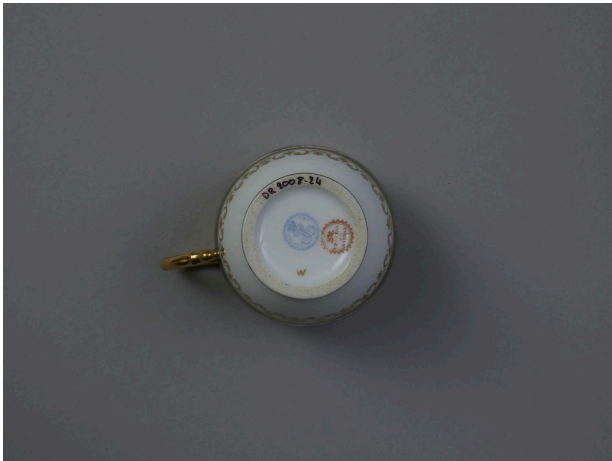
Vue du dessous de la tasse