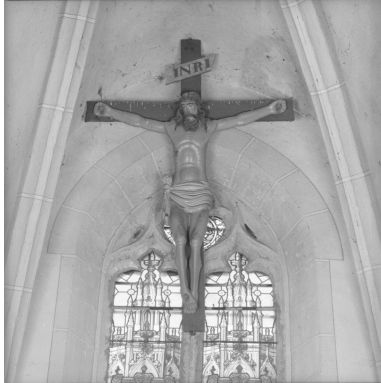
Vue d'ensemble. IVR82_20014200545X