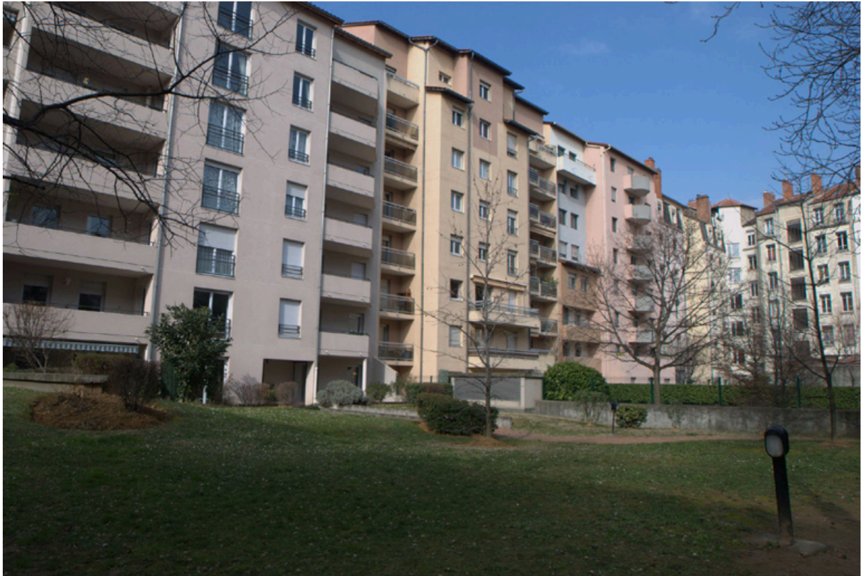
Elévations postérieures des immeubles 5, 7 et 9 rue Nicolai