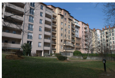
Elévations postérieures des immeubles 5, 7 et 9 rue Nicolai IVR82_20126902449NUCA