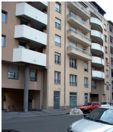
Vue générale depuis le nord IVR82_20106905087NUCA