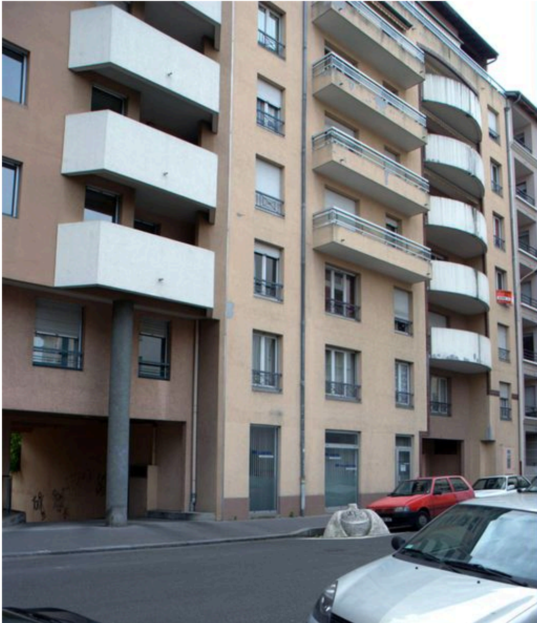
Vue générale depuis le nord