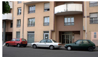
Elévation antérieure, détail du rez-de-chaussée IVR82_20106905088NUCA