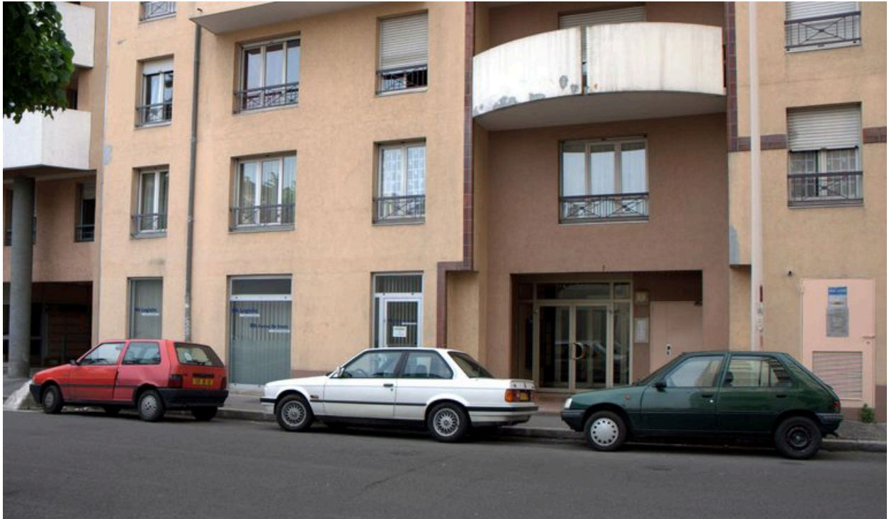
Elévation antérieure, détail du rez-de-chaussée