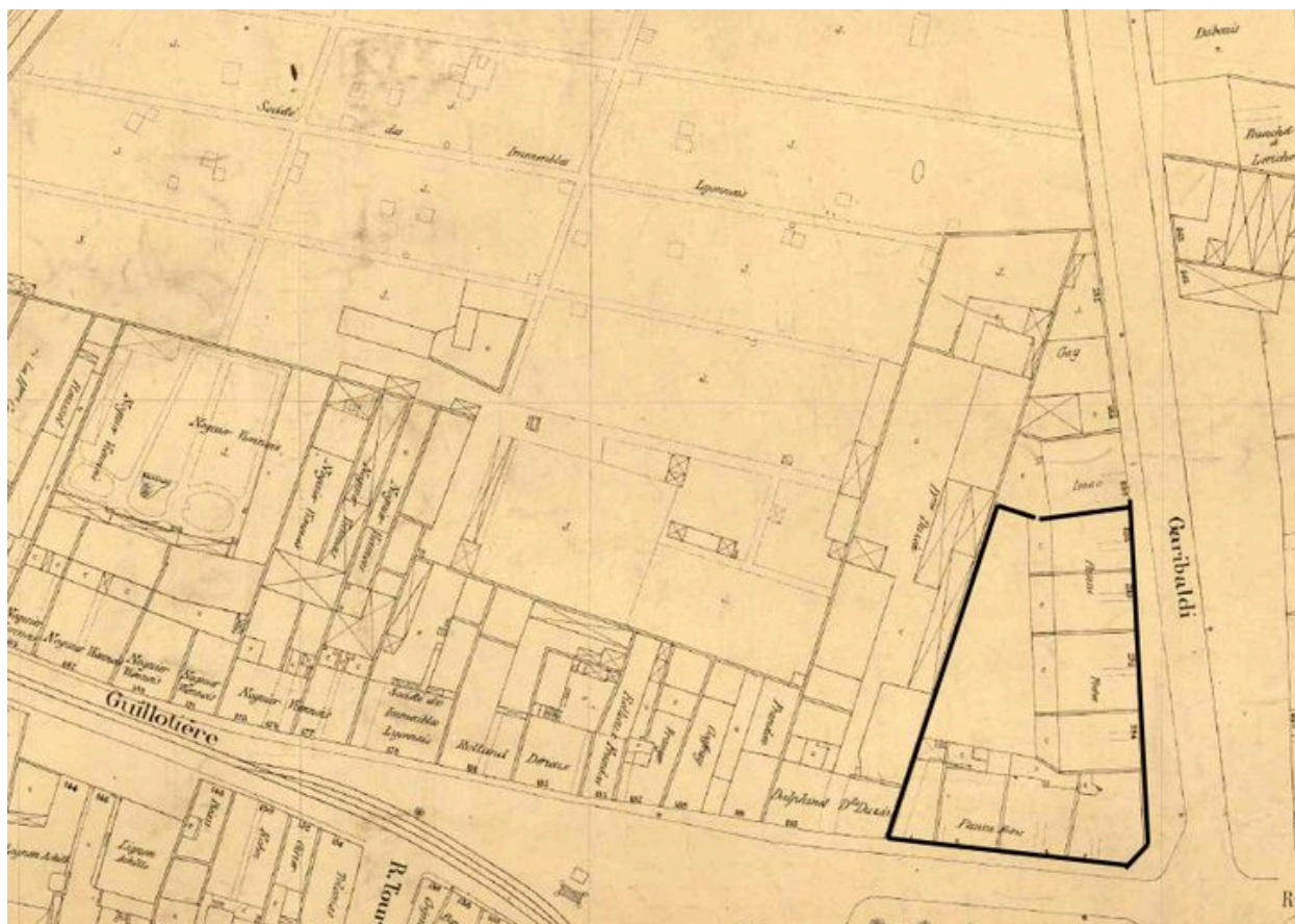
Plan des propriétés Pansu frères, extrait du plan général de la ville de Lyon, 1913. 1 : 500 (AC Lyon. 4 S 234)