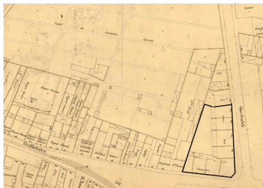
Plan des propriétés Pansu frères, extrait du plan général de la ville de Lyon, 1913. 1 : 500 IVR82_20106903629NUCA