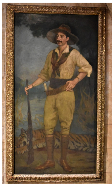
Vue générale IVR84_20226300551NUCA