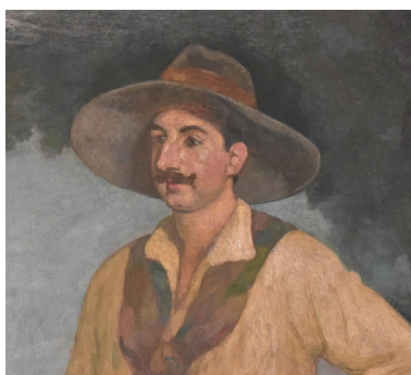
Détail figure IVR84_20226300552NUCA