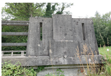
Pont Borian, détail du garde-corps avec borne géodésique IVR84_20207403129NUCA