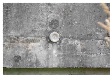
Pont Borian, détail de la borne géodésique