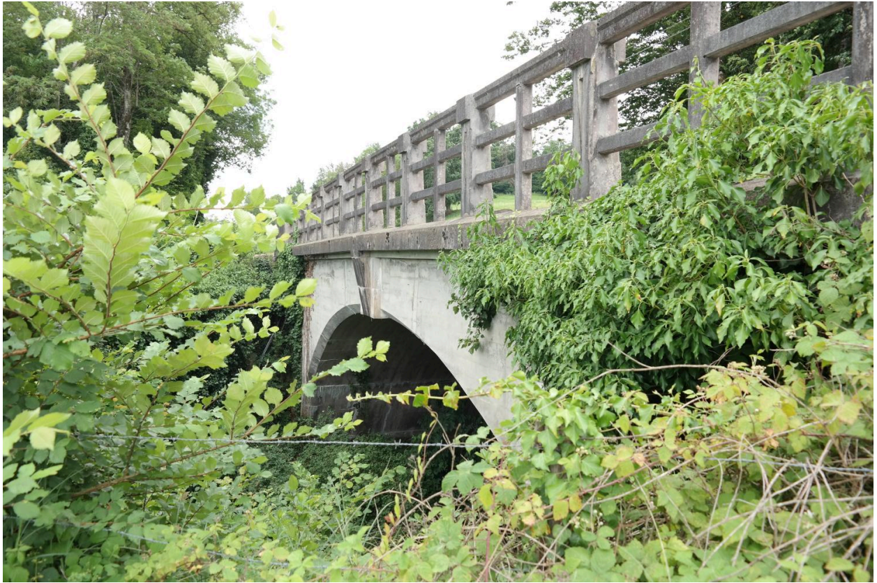
Pont Borian, vue de la face aval