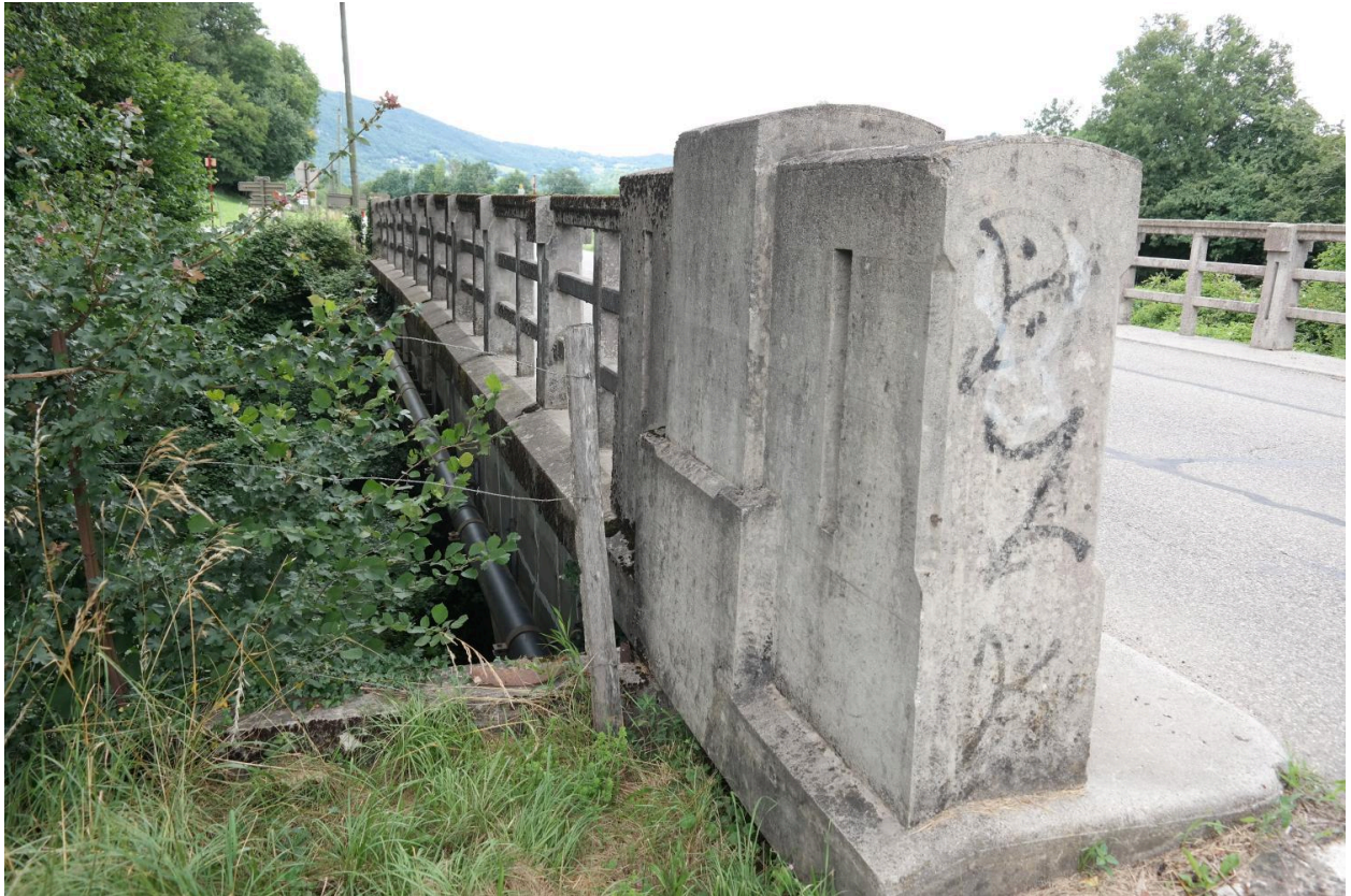
Pont Borian, vue de la face amont