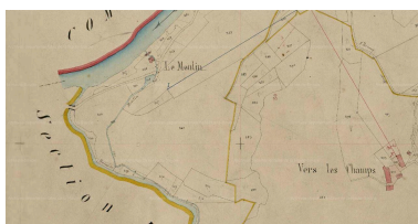
Extrait de la section B feuille n°2 du cadastre de Lornay. 1863. IVR84_20207403136NUCA