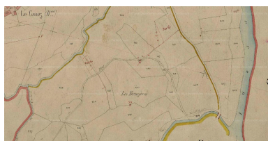
Extrait de la section B, feuille n°1 du cadastre de Lornay. 1863. IVR84_20207403135NUCA