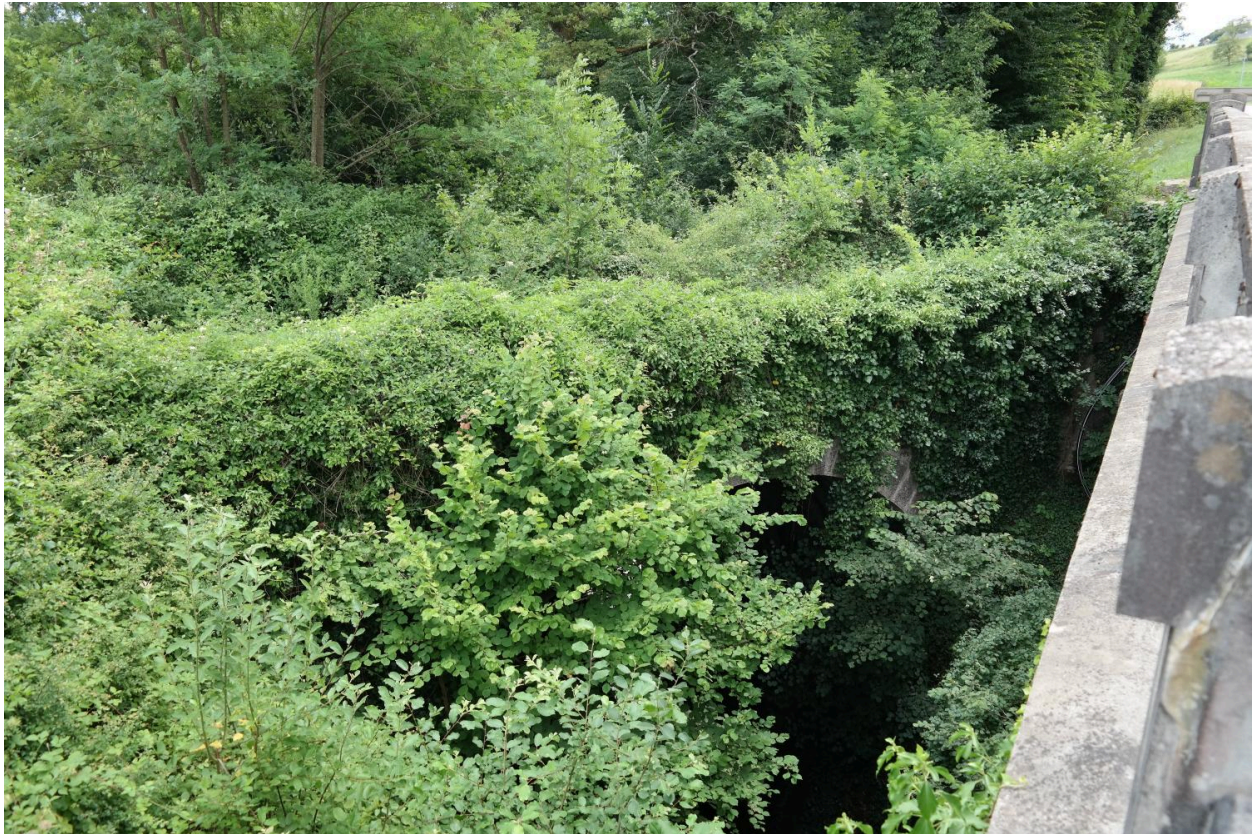
Ancien pont Borain vu depuis le nouveau pont Borian