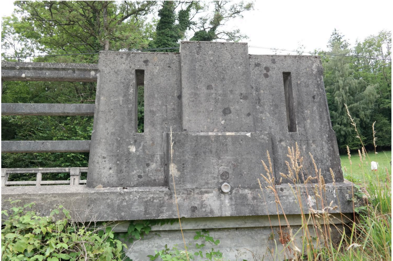
Pont Borian, détail du garde-corps avec borne géodésique