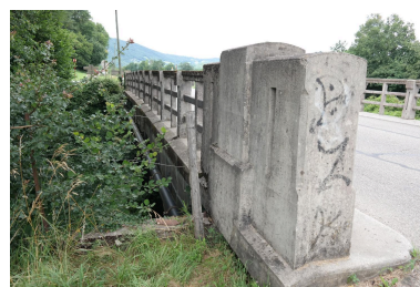
Pont Borian, vue de la face amont IVR84_20207403128NUCA