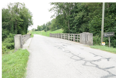
Pont Borian, vue sur la chaussée et les gardes-corps