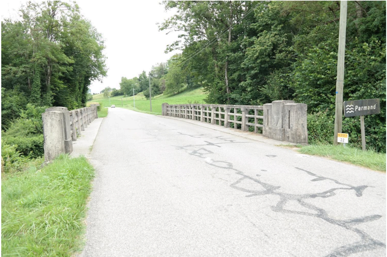
Pont Borian, vue sur la chaussée et les gardes-corps