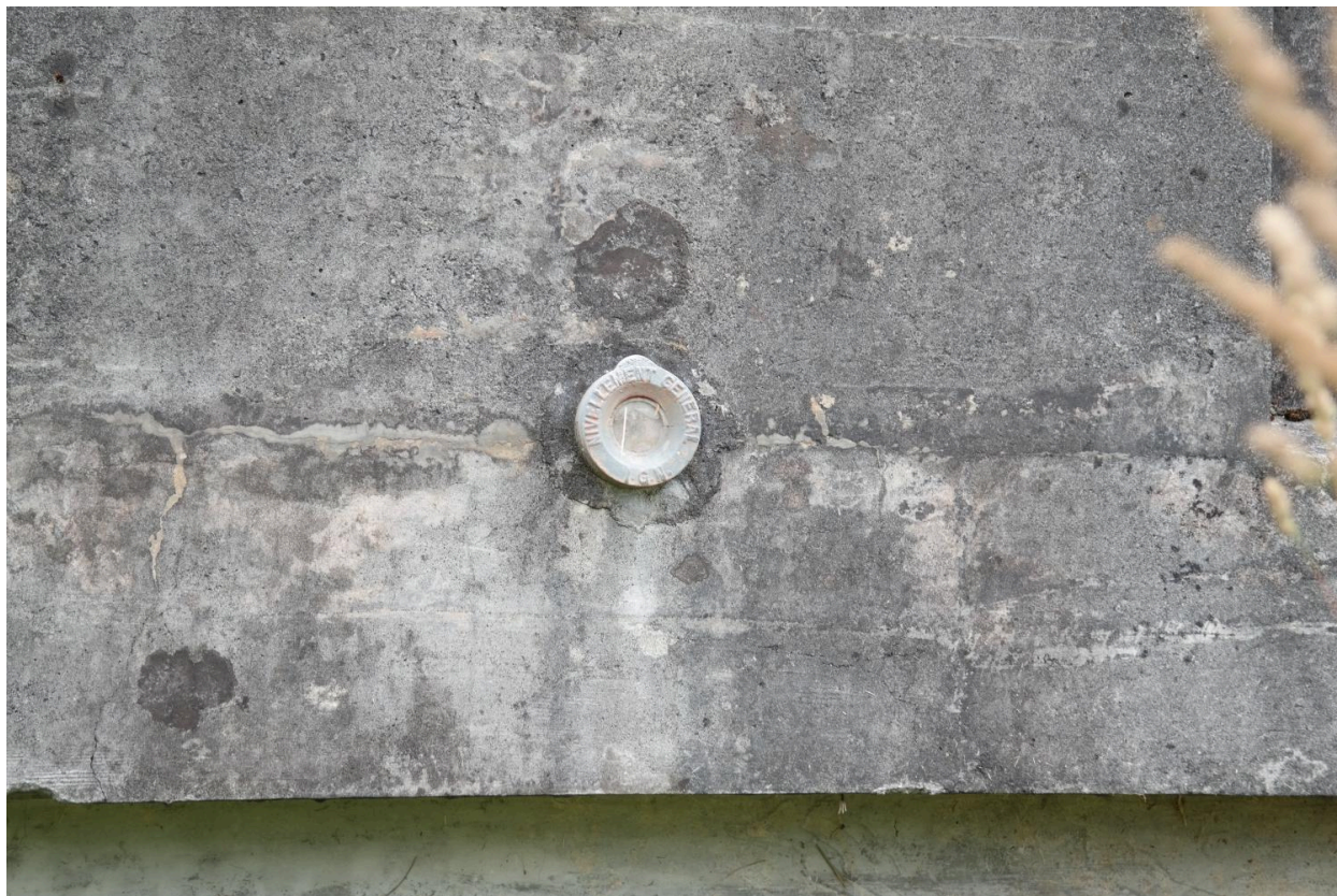
Pont Borian, détail de la borne géodésique