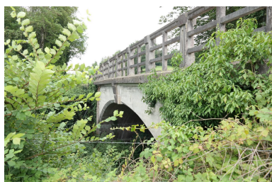
Pont Borian, vue de la face aval IVR84_20207403127NUCA