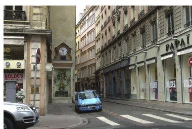
Vue de situation IVR82_20046900873NUCA