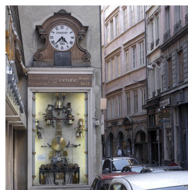
Vue générale IVR82_20056901508NUCA