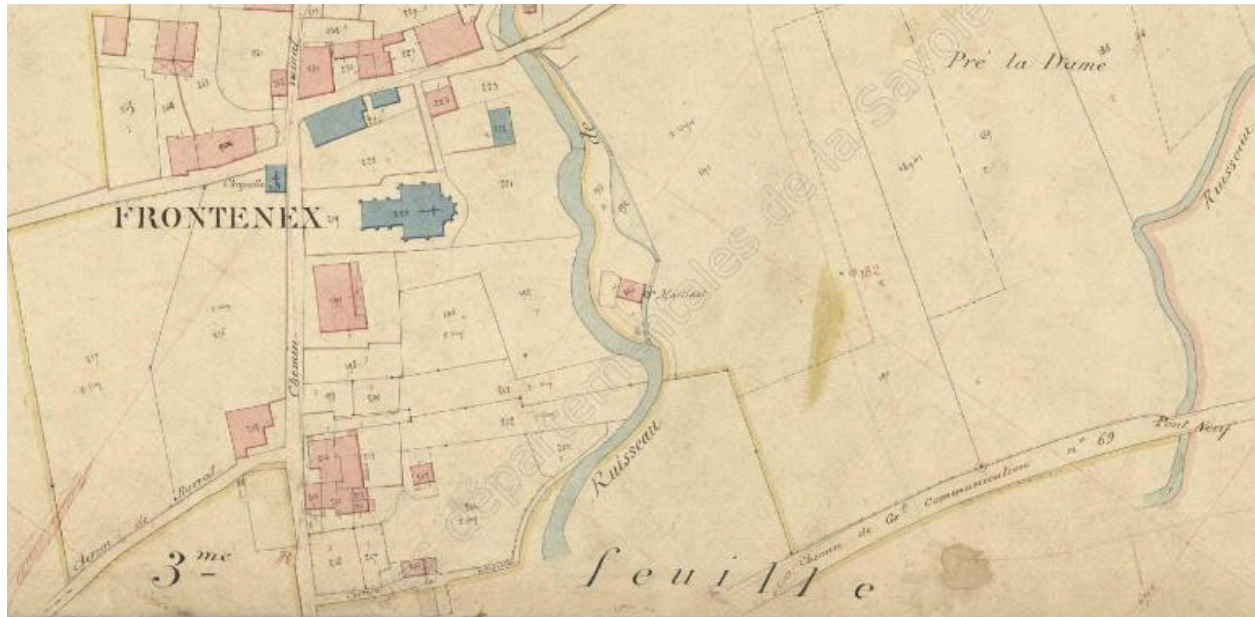
Premier cadastre français, Rochette (1a), 1870, Section unique, feuille 1 (FR.AD073, 3P 7434).