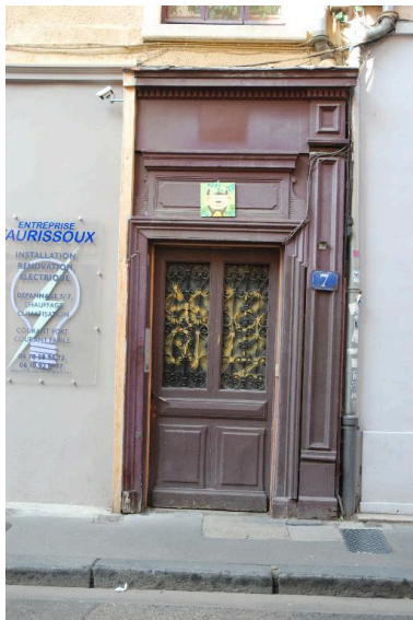
Vue de la porte d'entrée IVR82_20146900070NUCA