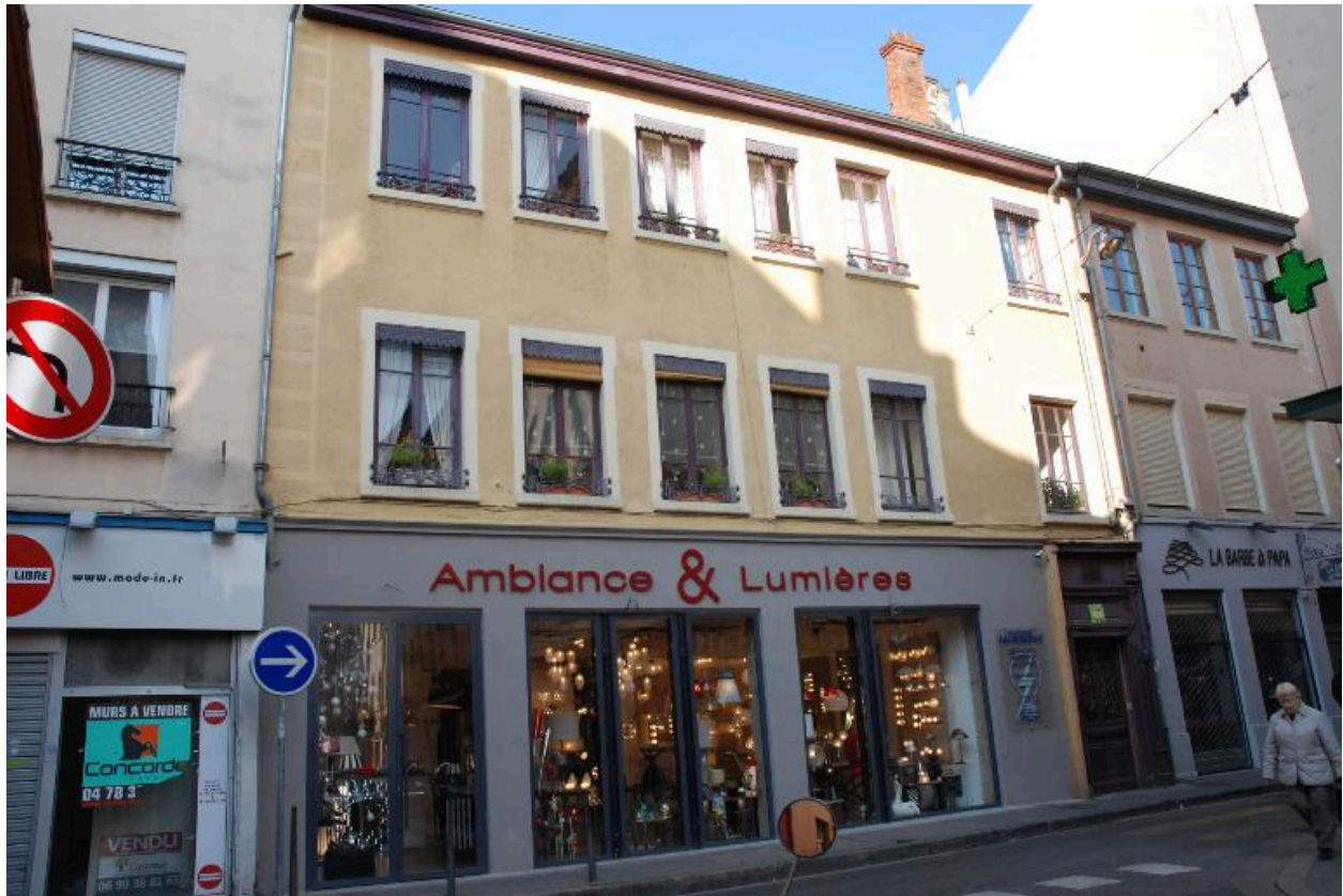
Vue d'ensemble sud est