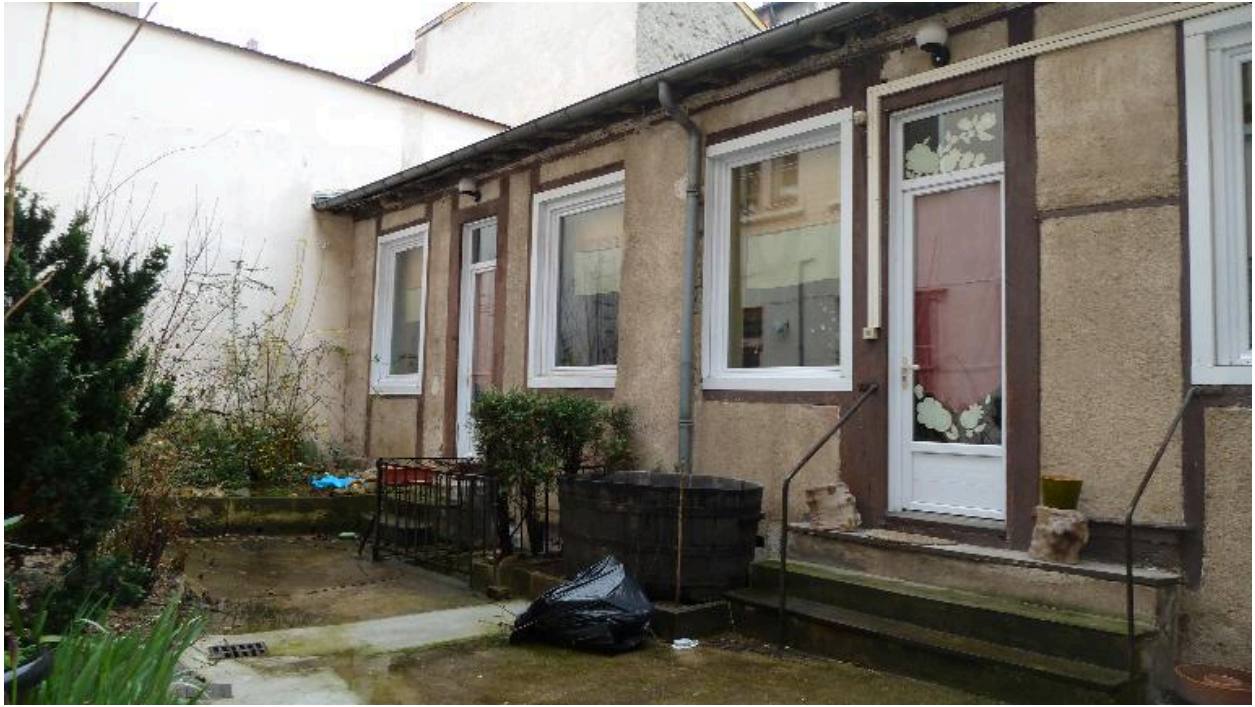
Vue du second corps de bâtiment sur cour