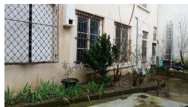
Vue de la cour