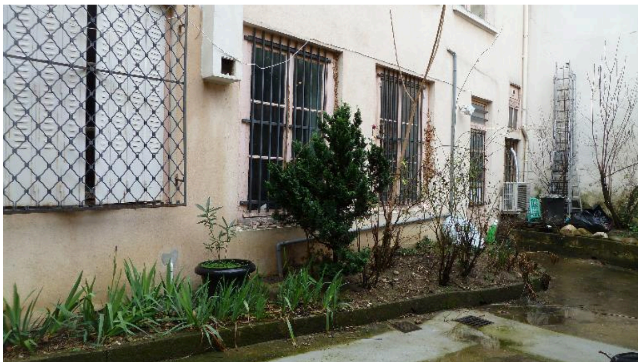
Vue de la cour