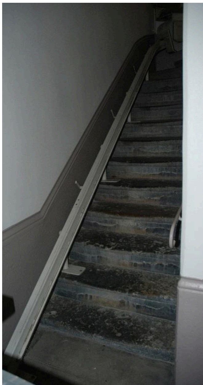
Vue du départ de l'escalier