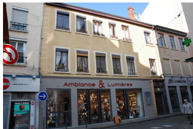
Vue d'ensemble sud est IVR82_20146900069NUCA