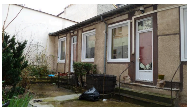
Vue du second corps de bâtiment sur cour IVR82_20146900166NUCA