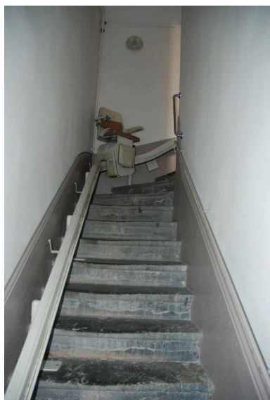
Vue de la première volée de l'escalier IVR82_20146900082NUCA