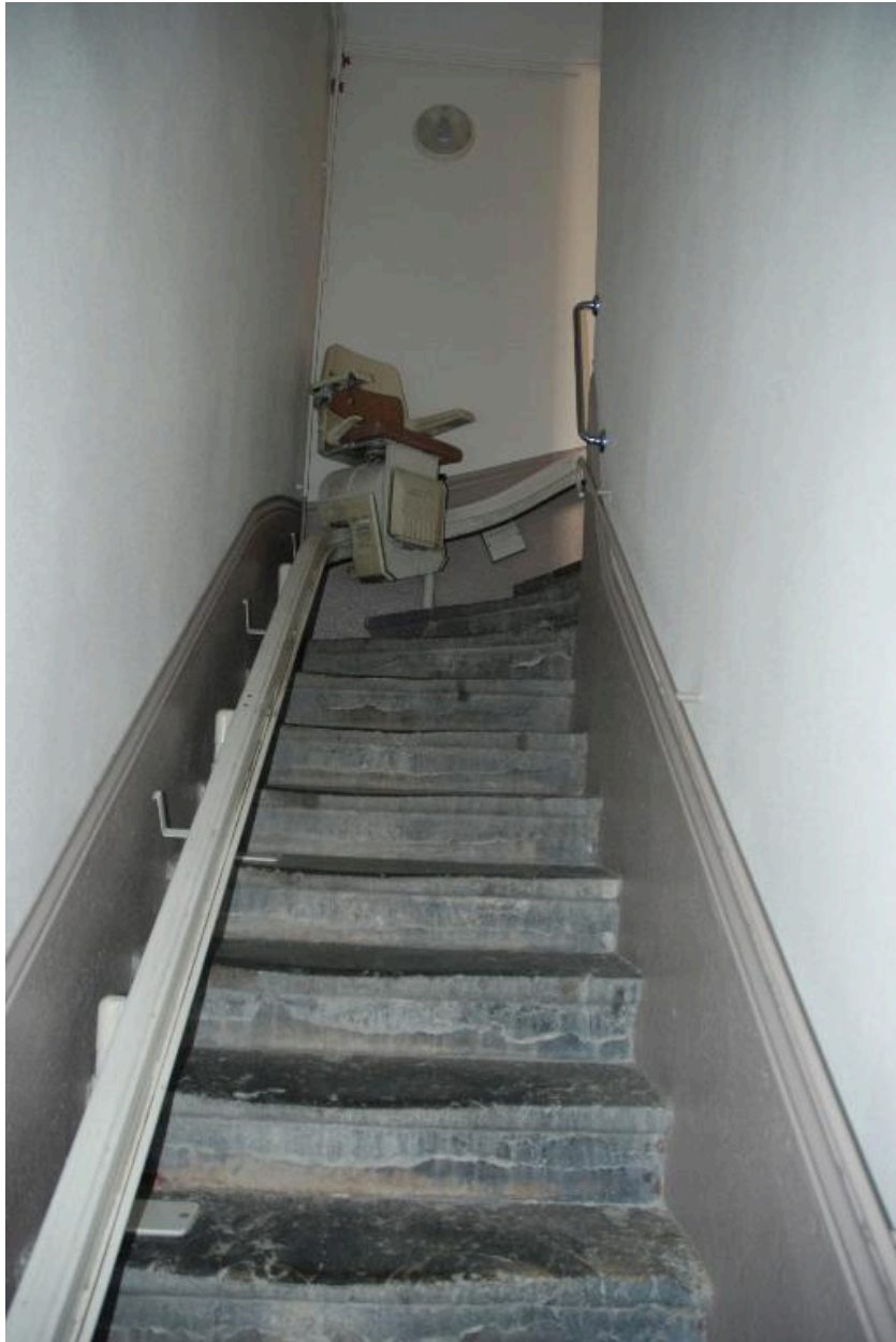
Vue de la première volée de l'escalier