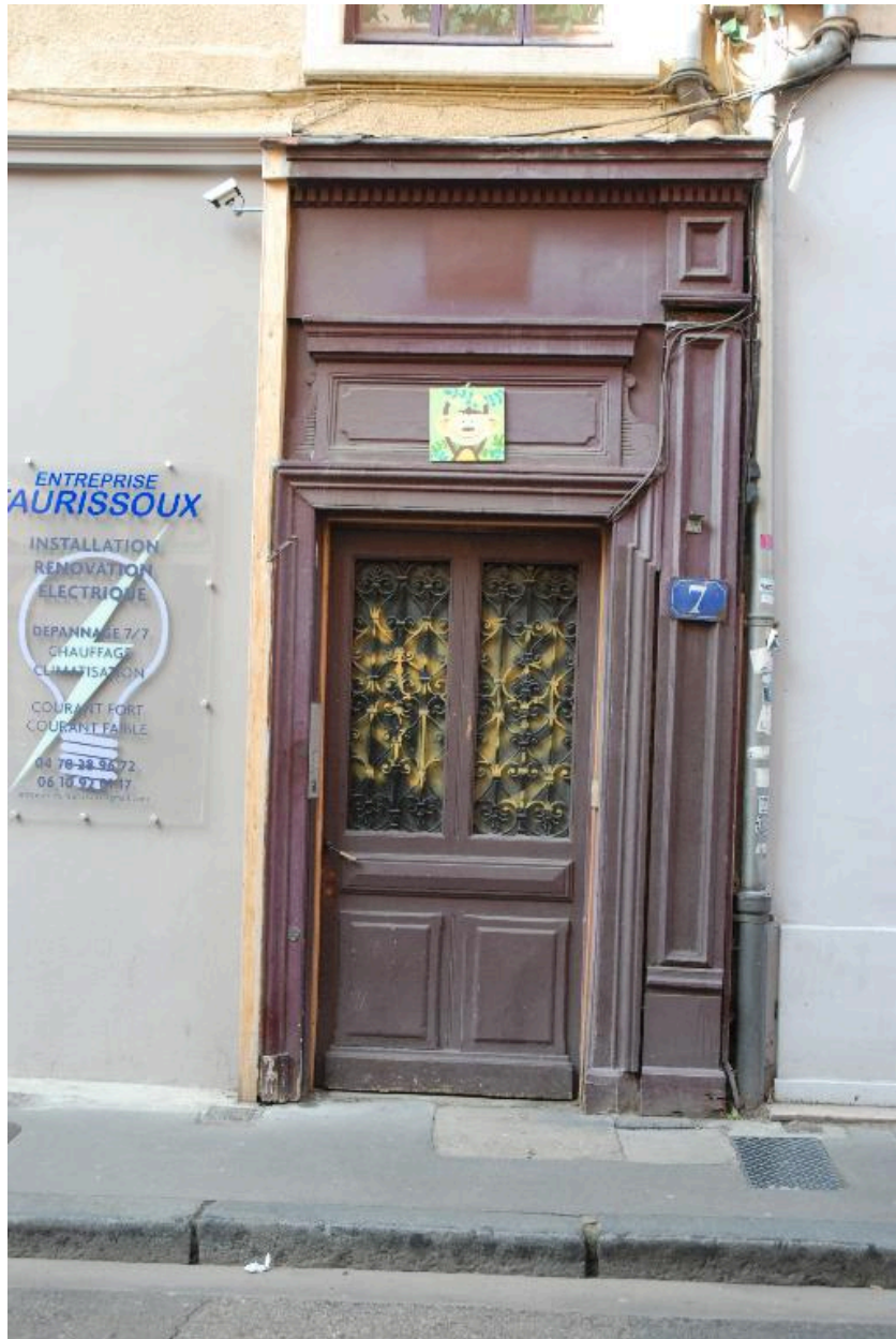
Vue de la porte d'entrée