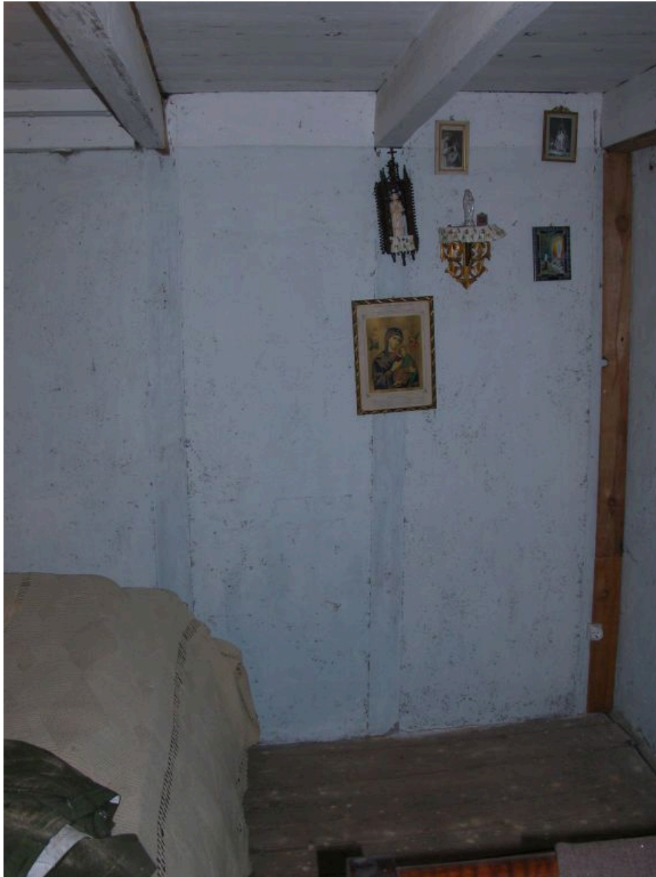
Vue partielle intérieure de la seconde chambre située à l'étage carré du logis.