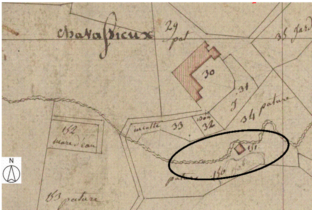
Plan de situation, d'après le cadastre de 1809, section A, échelle originale 1:2500.