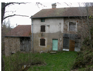
Vue d'ensemble de la façade ouest de la ferme.

IVR82_20124200193NUCA