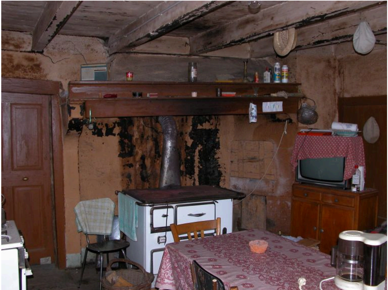
Vue d'ensemble de la cuisine, avec sa cheminée dans l'angle sud-est.