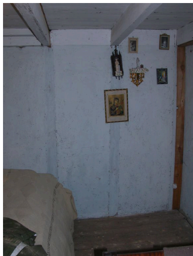
Vue partielle intérieure de la seconde chambre située à l'étage carré du logis. IVR82_20124200199NUCA