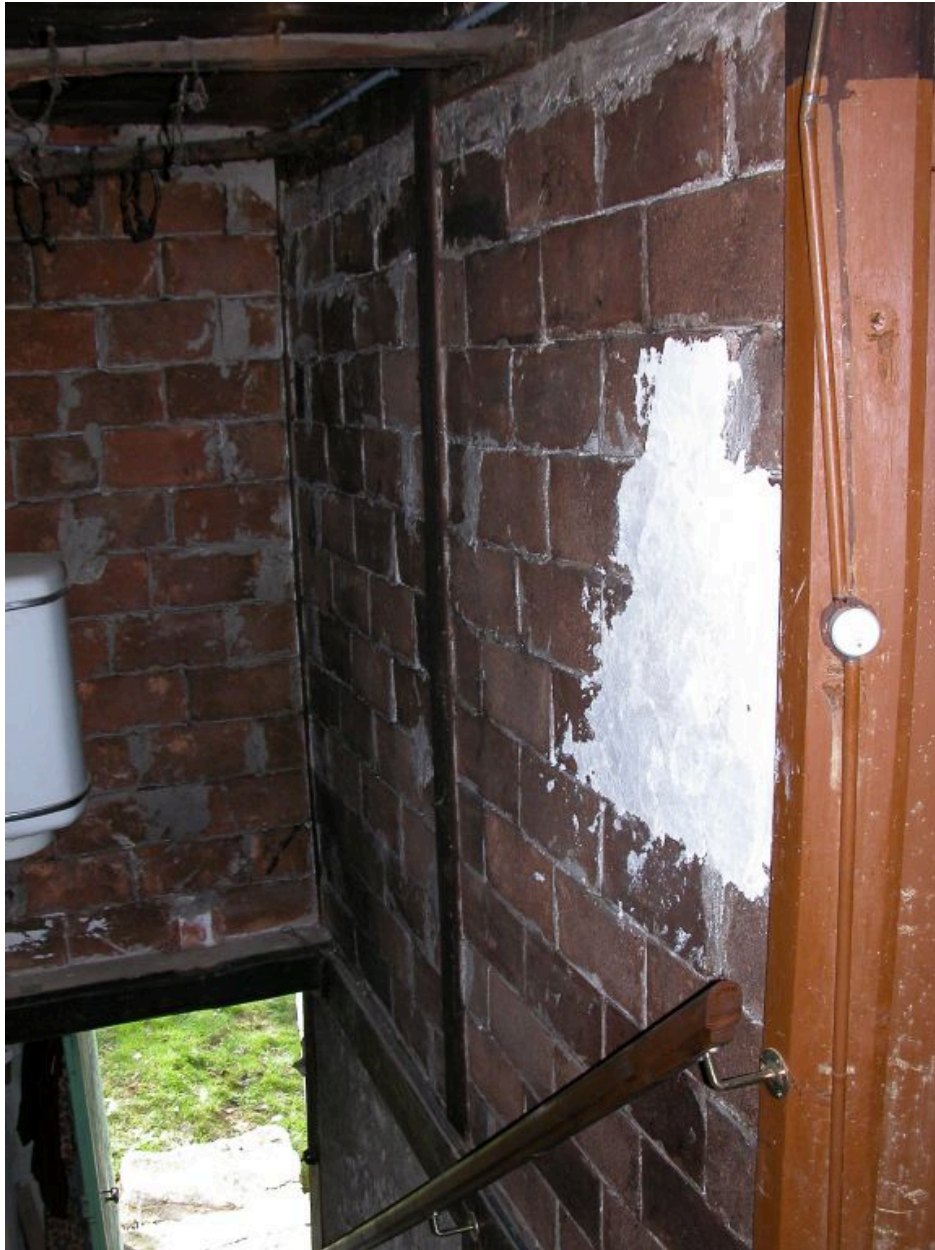
Vue d'ensemble de l'escalier intérieur du logis depuis le palier de l'étage carré.