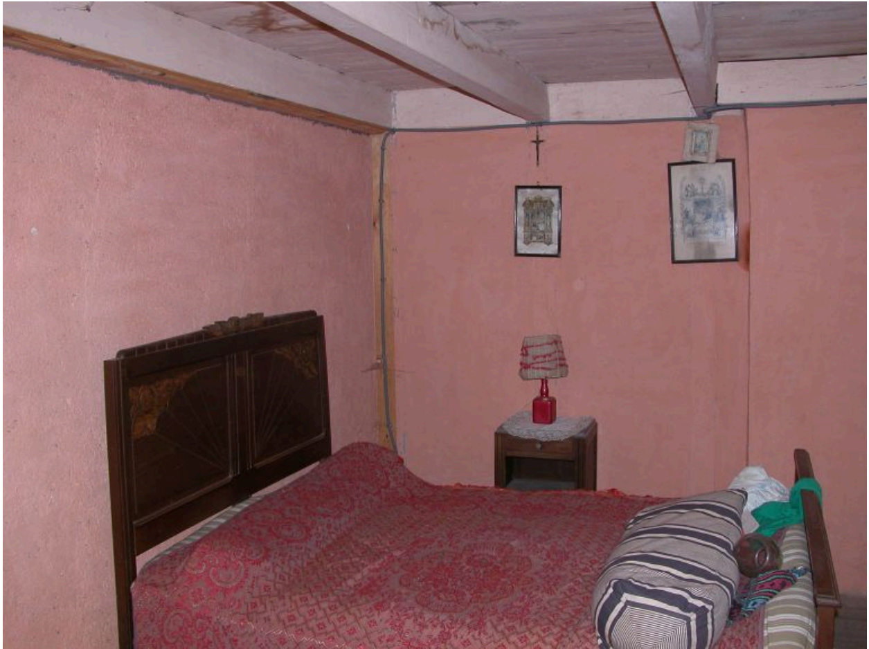
Vue partielle intérieure de la première chambre située à l'étage carré.