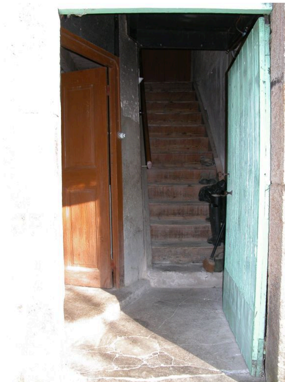
Vue d'ensemble de l'escalier intérieur du logis.