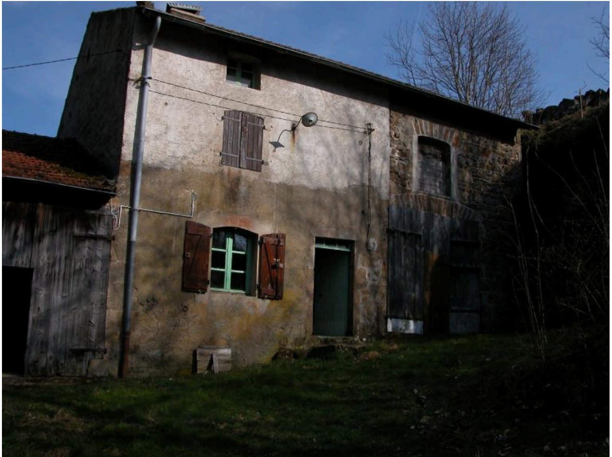
Vue partielle de la ferme de trois-quarts nord-ouest.