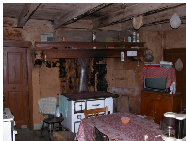
Vue d'ensemble de la cuisine, avec sa cheminée dans l'angle sud-est.