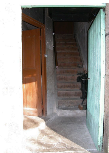
Vue d'ensemble de l'escalier intérieur du logis.