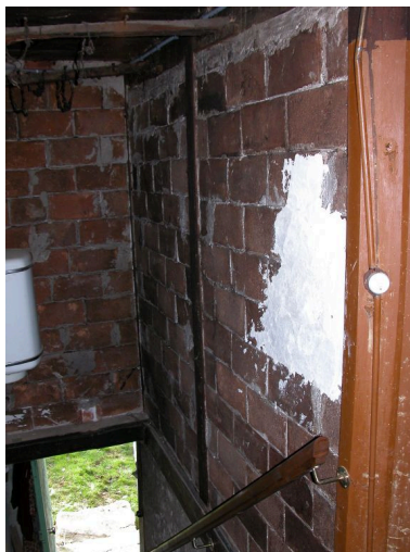
Vue d'ensemble de l'escalier intérieur du logis depuis le palier de l'étage carré. IVR82_20124200197NUCA