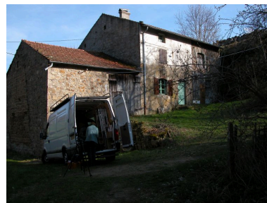
Vue générale IVR82_20124200192NUCA

IVR82_20124200191NUD