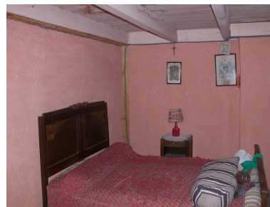
Vue partielle intérieure de la première chambre située à l'étage carré. IVR82_20124200198NUCA