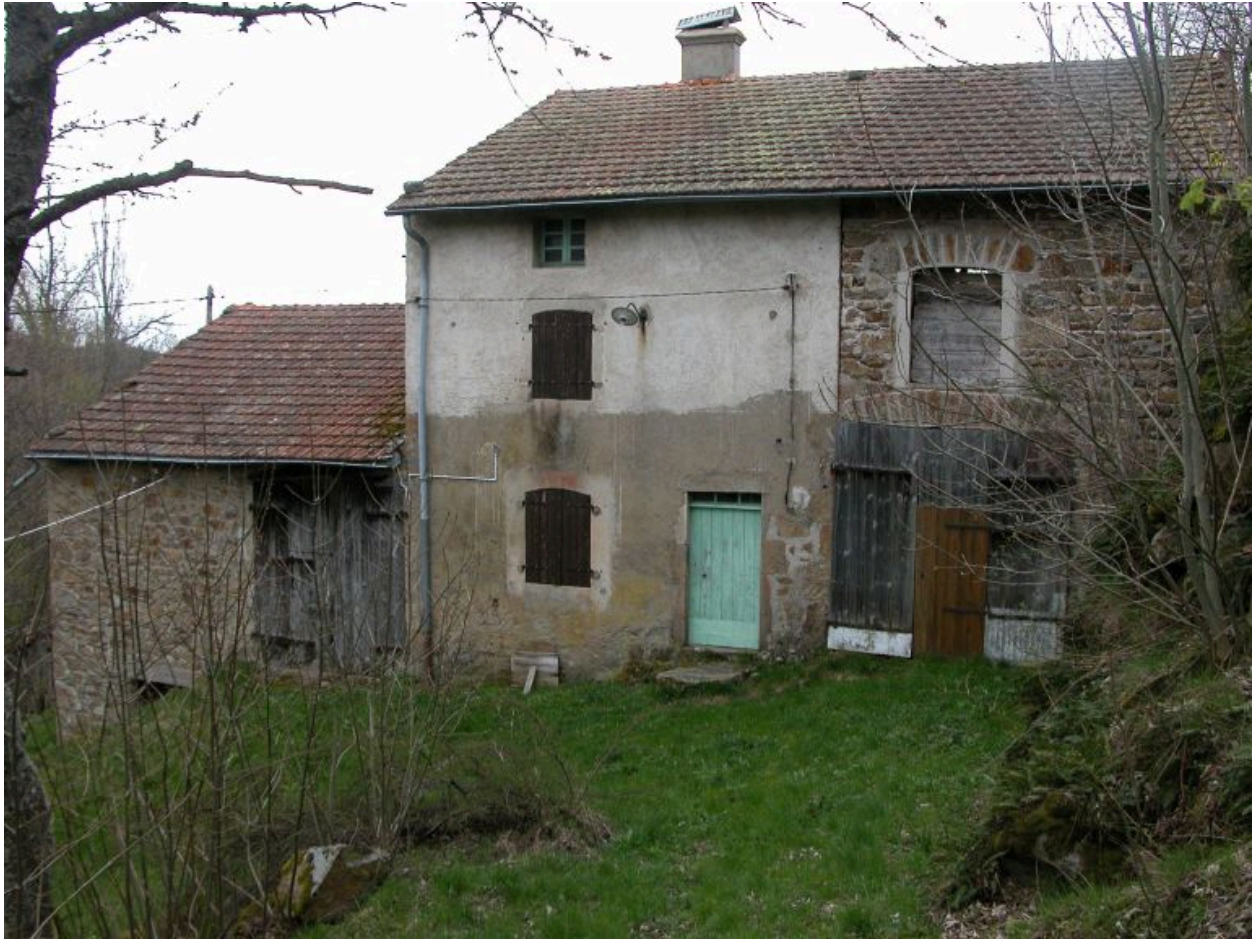
Vue d'ensemble de la façade ouest de la ferme.