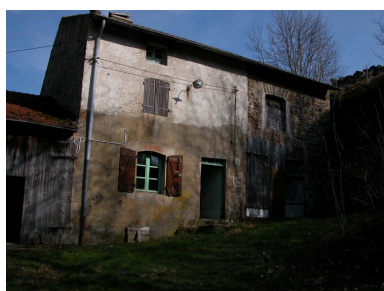
Vue partielle de la ferme de trois-quarts nord-ouest.

IVR82_20124200193NUCA