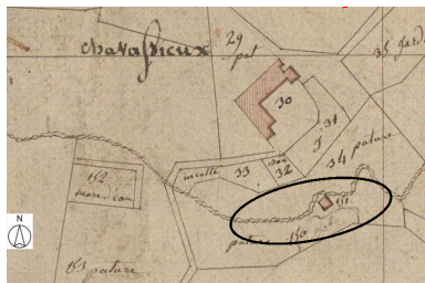
Plan de situation, d'après le cadastre de 1809, section A, échelle originale 1:2500.

Dess. Thierry Monnet IVR82_20124200040NUD