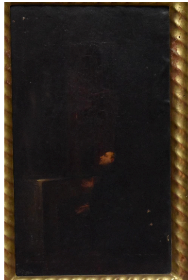
Vue générale - Saint Thomas de Villanova recevant l'annonce de sa mort IVR84_20216300884NUCA