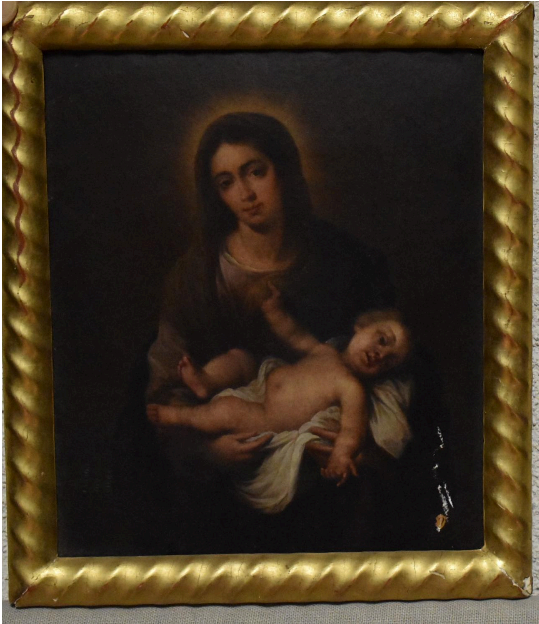
Vue générale - Vierge à l'Enfant