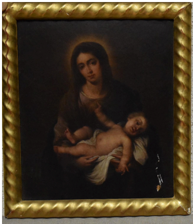
Vue générale - Vierge à l'Enfant IVR84_20216300882NUCA