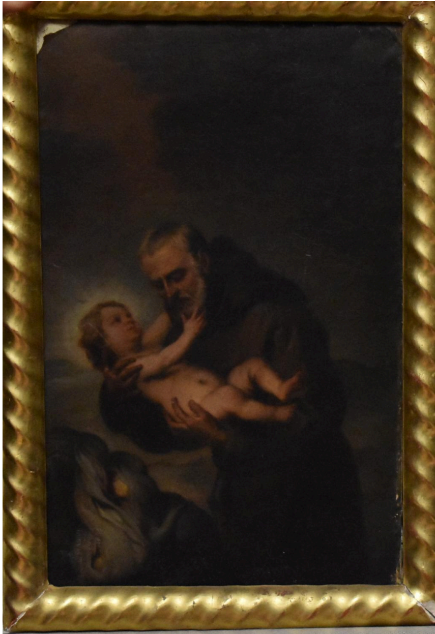
Vue générale - Saint Félix de Cantalice et l'Enfant Jésus