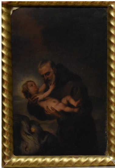
Vue générale - Saint Félix de Cantalice et l'Enfant Jésus IVR84_20216300883NUCA