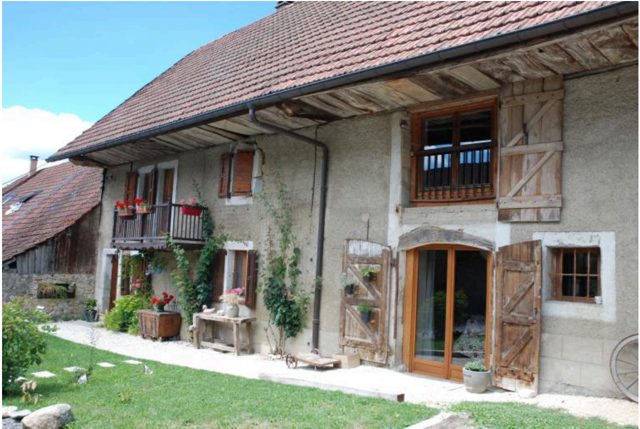
Vue de l'habitation ouest et de l'étable.