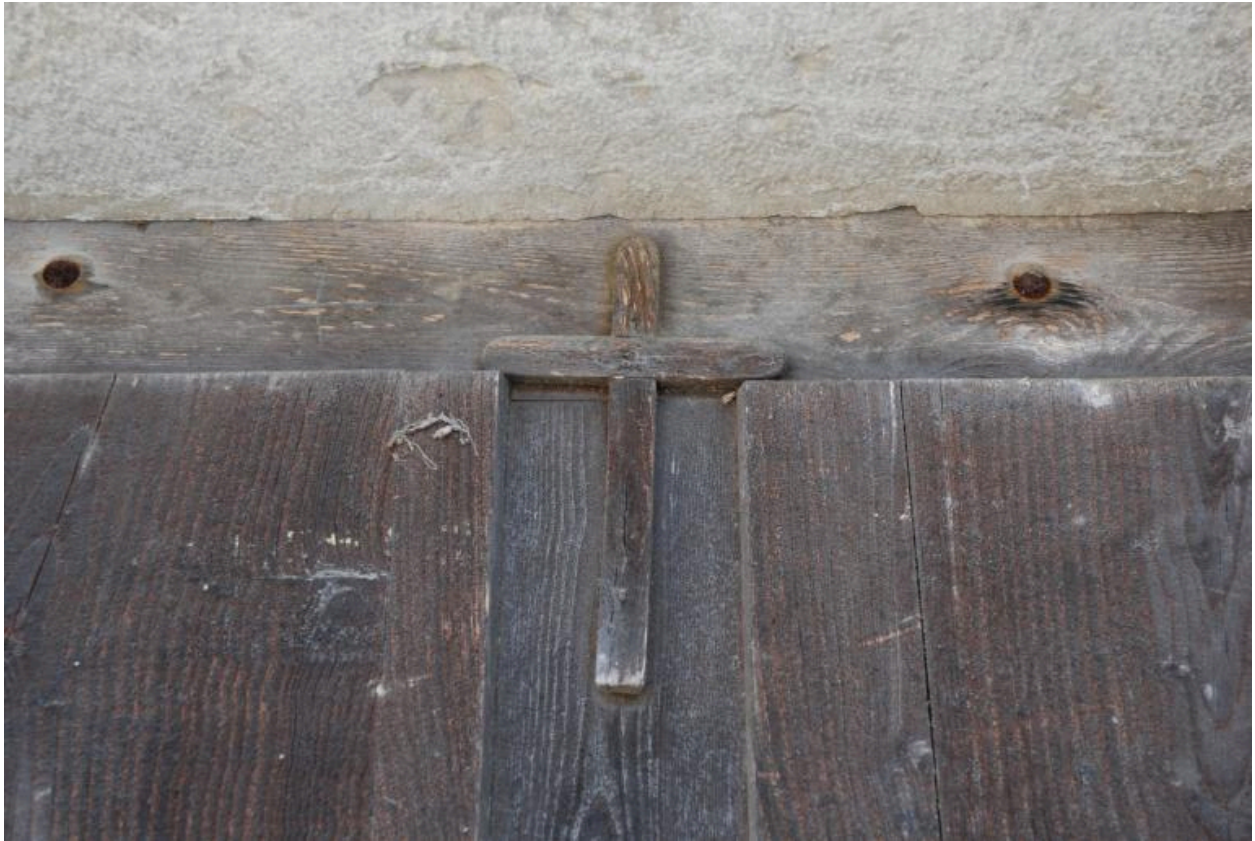
Détail des ouvertures de l'habitation est : croix clouée sur la porte.