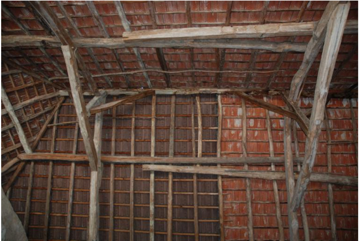
Vue intérieure de la charpente dans la grange.