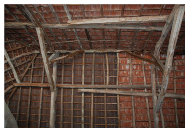
Vue intérieure de la charpente dans la grange.