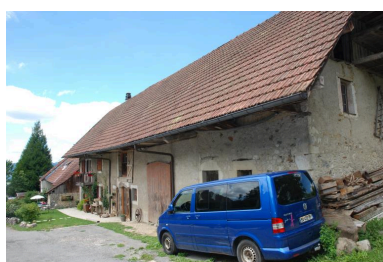
Vue d'ensemble. IVR84_20207400646NUCA