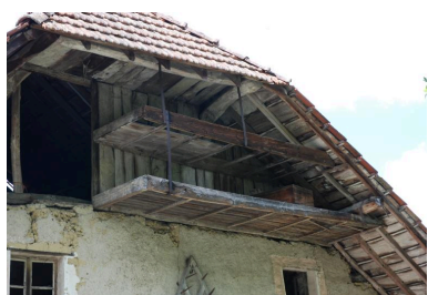
Vue du mur pignon est : détail des claies de séchage.