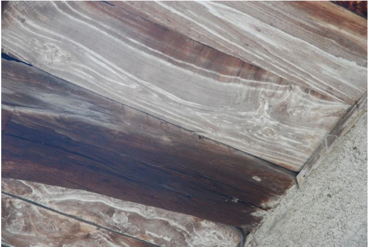
Détail de la date portée : 185...