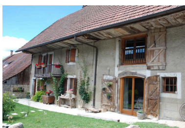
Vue de l'habitation ouest et de l'étable. IVR84_20207400647NUCA