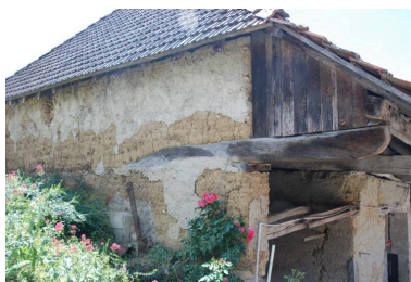
Grange-étable sud, détail du pignon en pisé. IVR84_20207400654NUCA