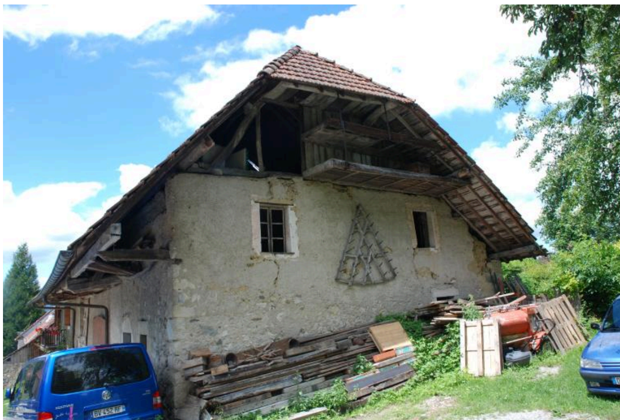
Vue du mur pignon est.