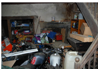
Vue intérieure de la cuisine de l'habitation est : cheminée. IVR84_20207400649NUCA