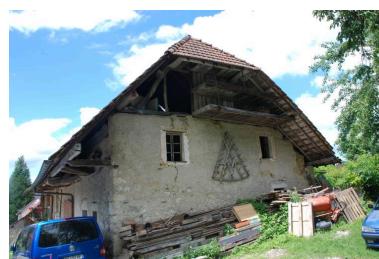
Vue du mur pignon est. IVR84_20207400643NUCA