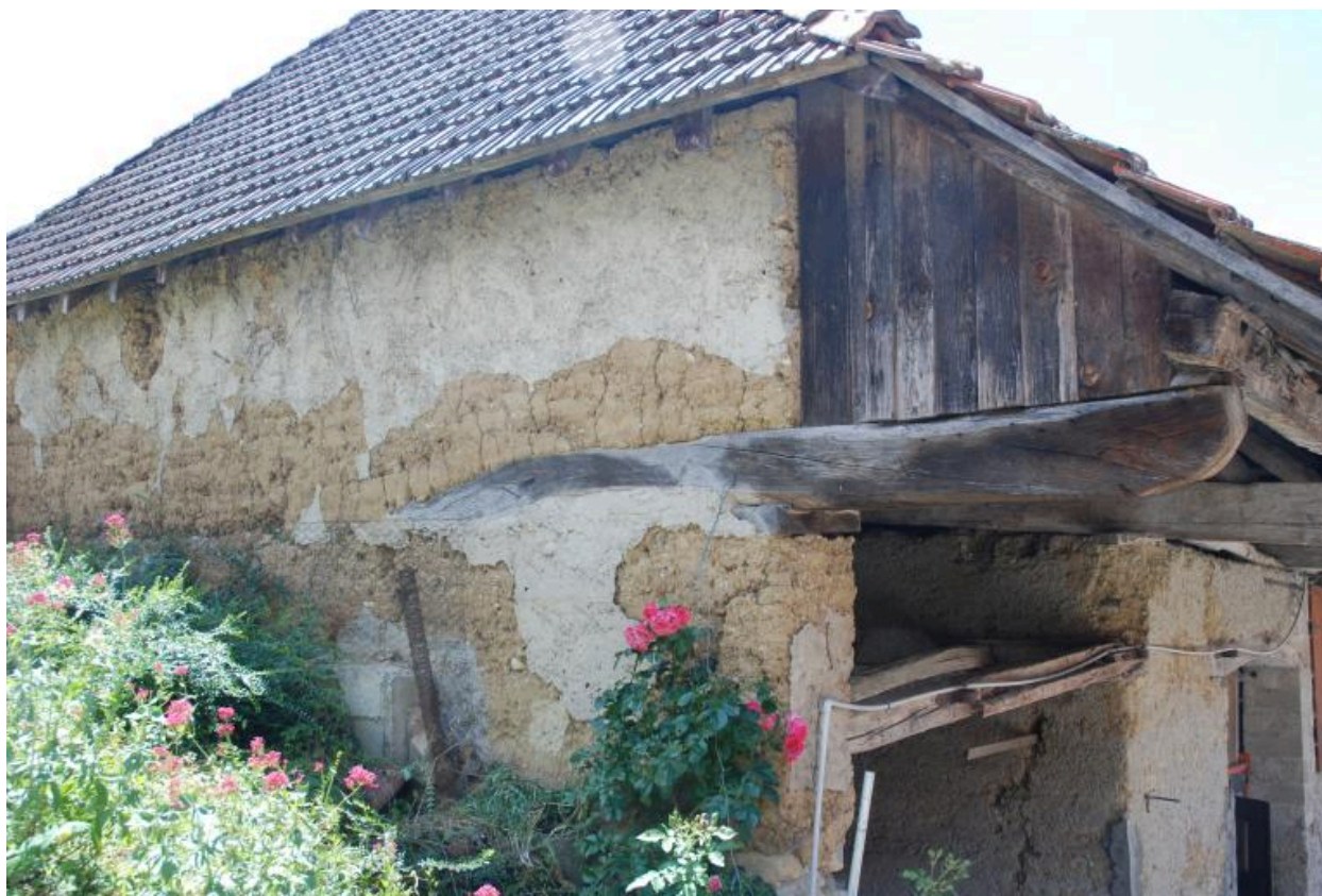
Grange-étable sud, détail du pignon en pisé.