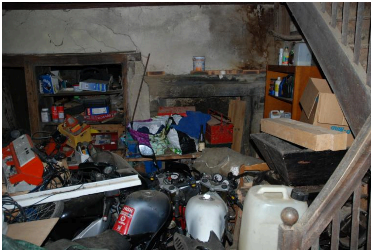
Vue intérieure de la cuisine de l'habitation est : cheminée.