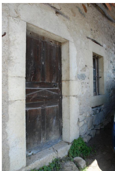
Détail des ouvertures de l'habitation est. IVR84_20207400651NUCA