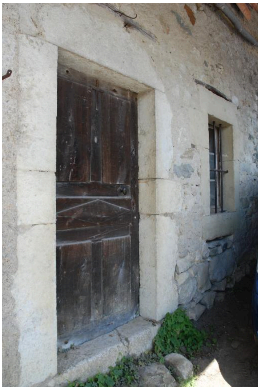
Détail des ouvertures de l'habitation est.