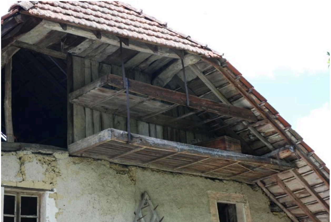
Vue du mur pignon est : détail des claies de séchage.