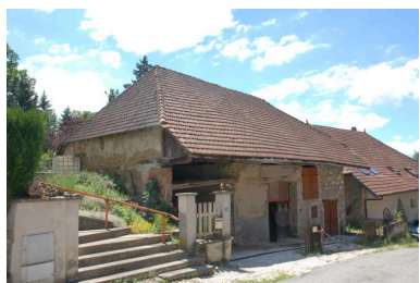
Vue de la grange-étable sud (2017 D2 132).