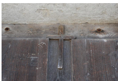
Détail des ouvertures de l'habitation est : croix clouée sur la porte.