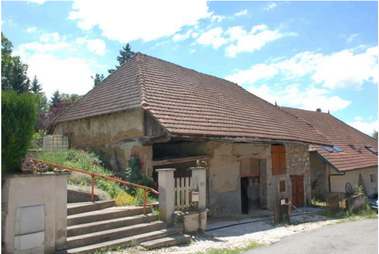
Vue de la grange-étable sud (2017 D2 132).