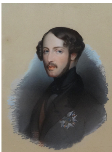
Détail