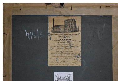
Vue de l'étiquette au dos IVR84_20216300837NUC4A