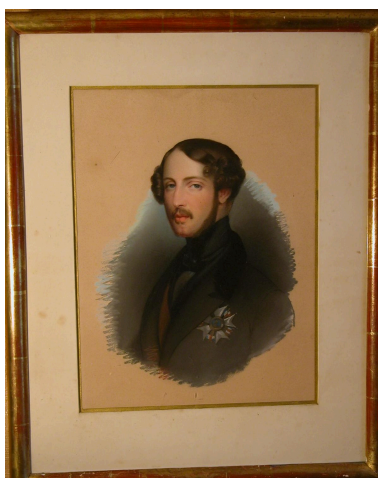
Vue générale IVR84_20216300833NUC4A