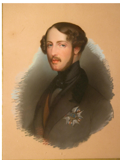
Détail IVR84_20216300835NUC4A