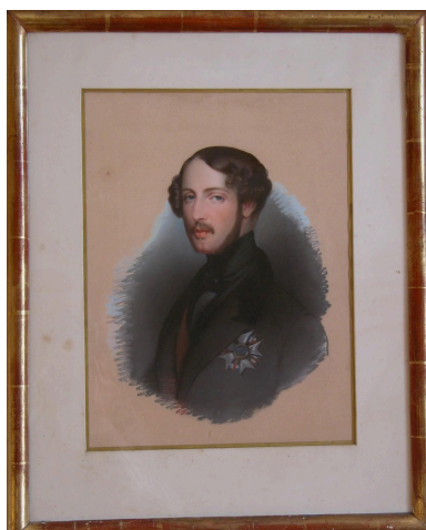
Vue générale IVR84_20216300832NUC4A