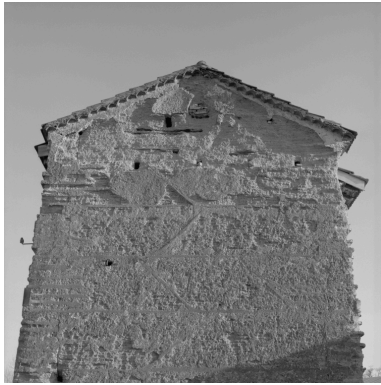
Colombier, détail du pisé du pignon gauche.