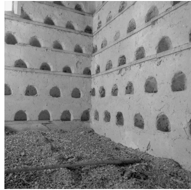
Colombier, vue intérieure. IVR82_20024201589X