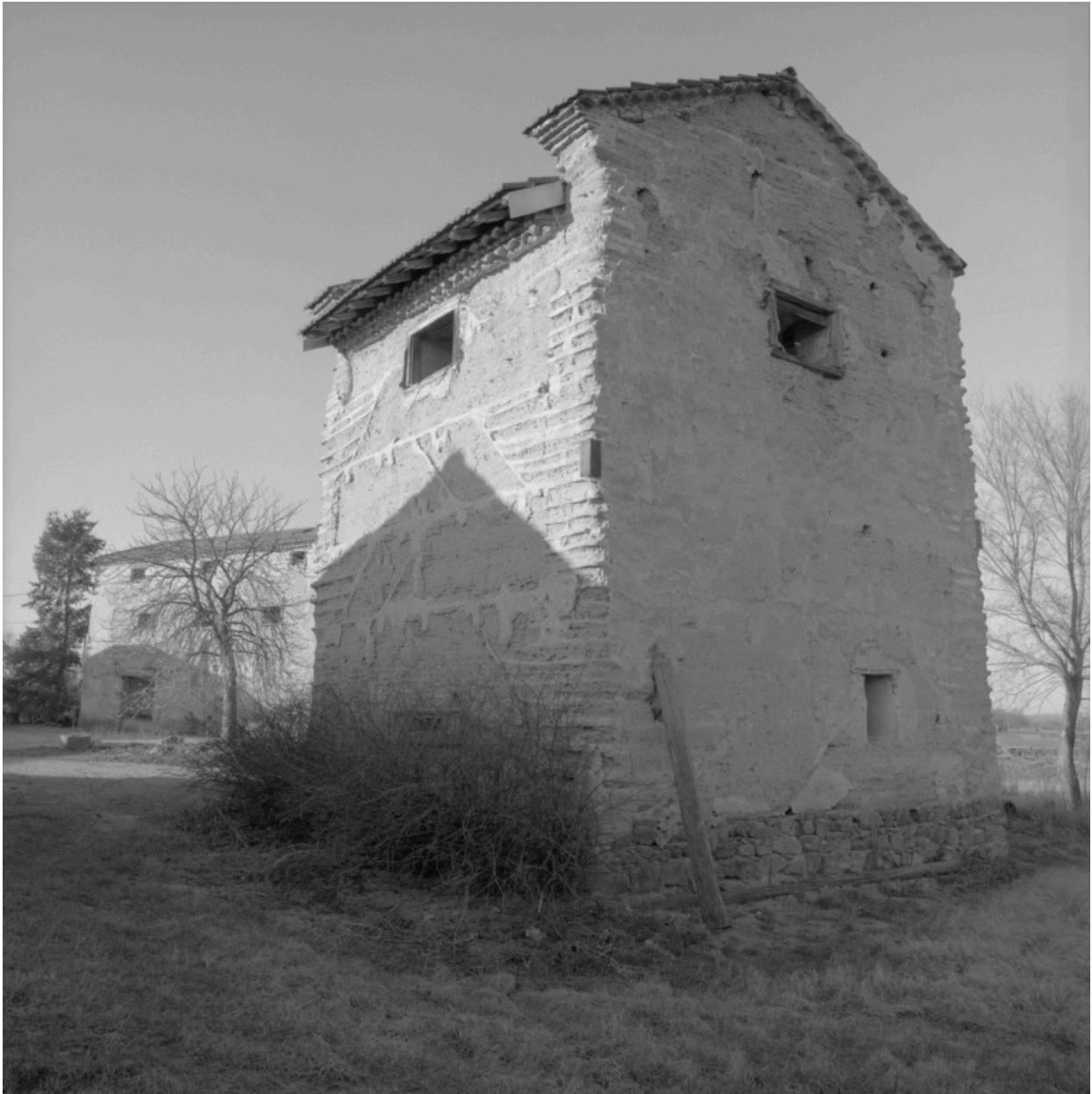
Colombier, vue d'ensemble de trois-quarts droite.