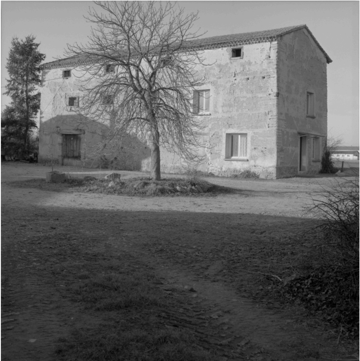
Vue d'ensemble du grenier.