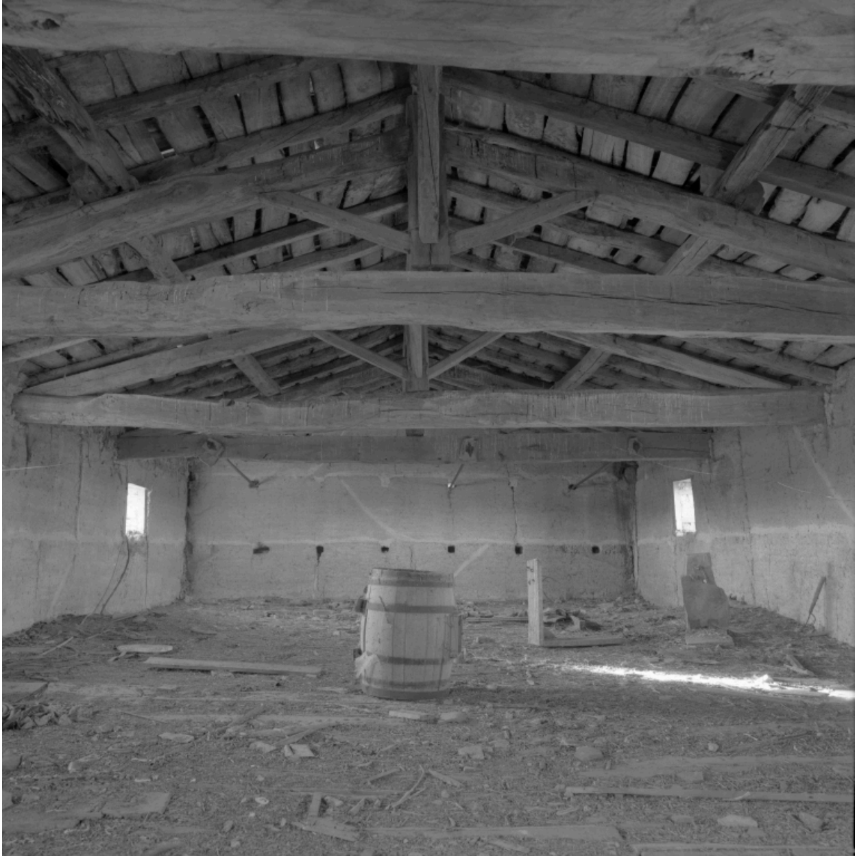
Vue intérieure du grenier, sous la charpente.