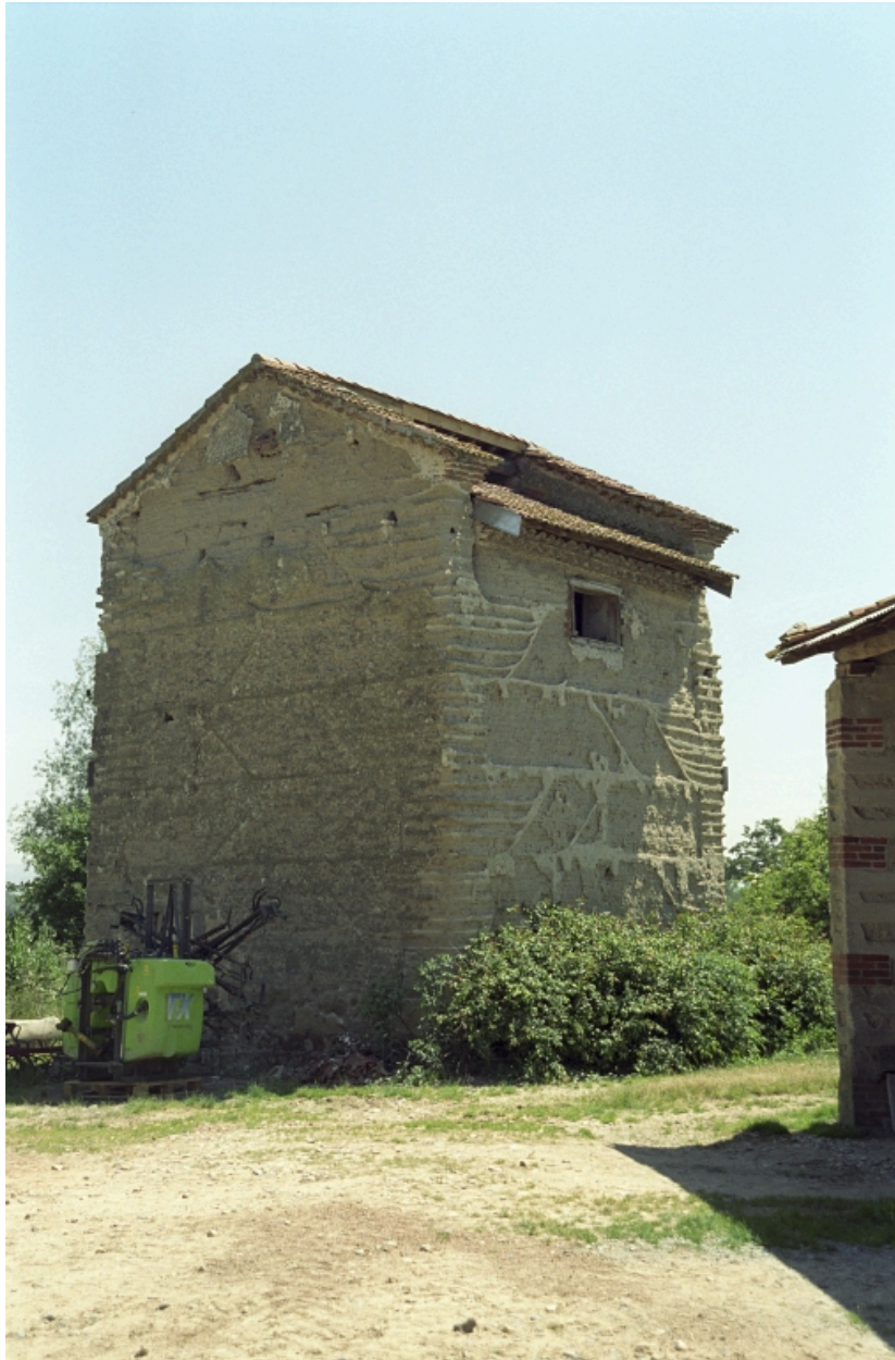
Colombier, vue d'ensemble.