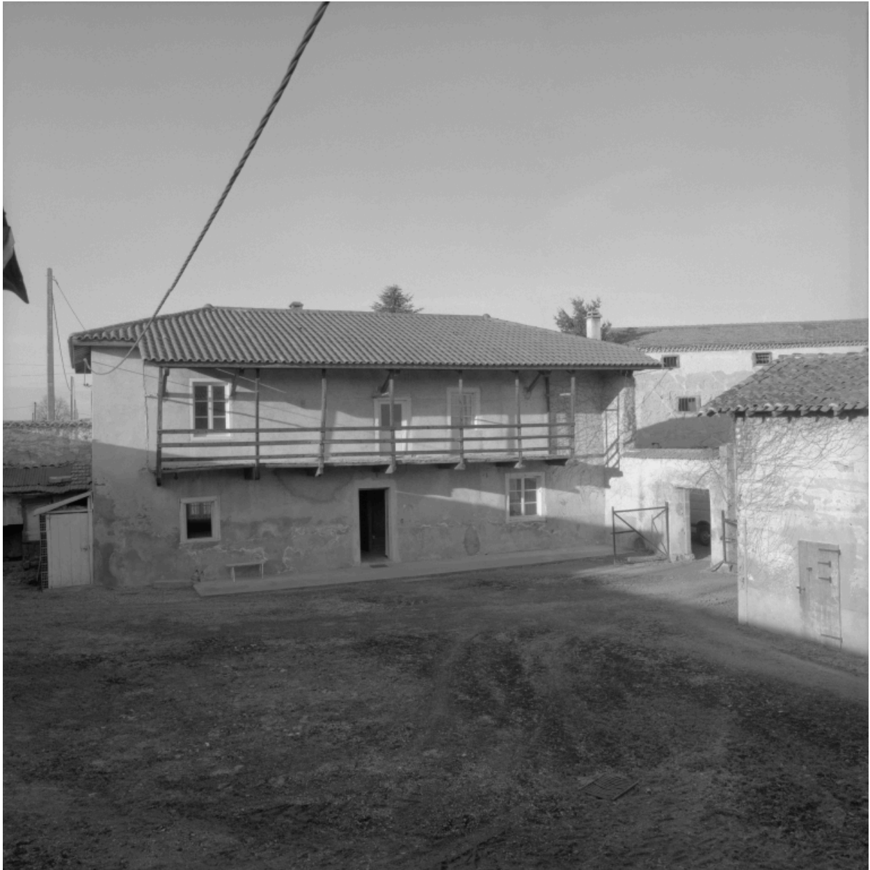
Vue d'ensemble de face du logis à aître, depuis la première cour.