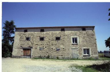
Vue d'ensemble du grenier.