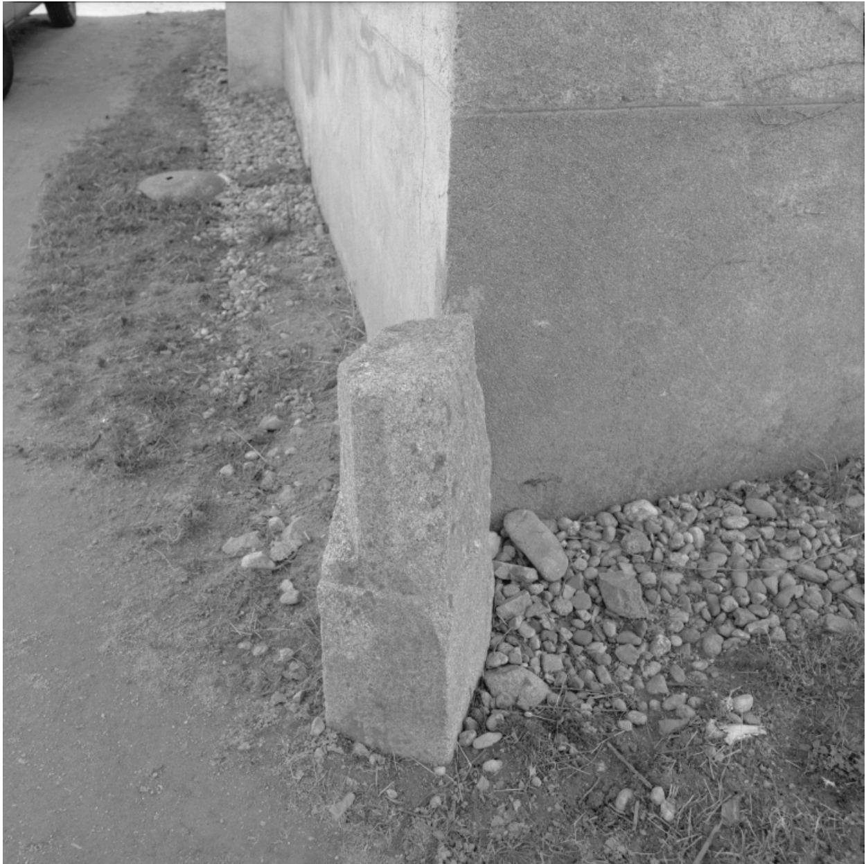
Détail d'une base de piédroit de cheminée en pierre.