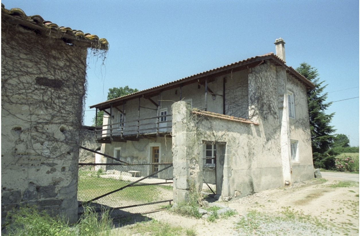
Vue d'ensemble du logis à aître depuis la deuxième cour.