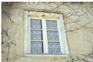
Logis à aître, élévation latérale droite, détail de la baie du premier étage. IVR82_20044200528ZE