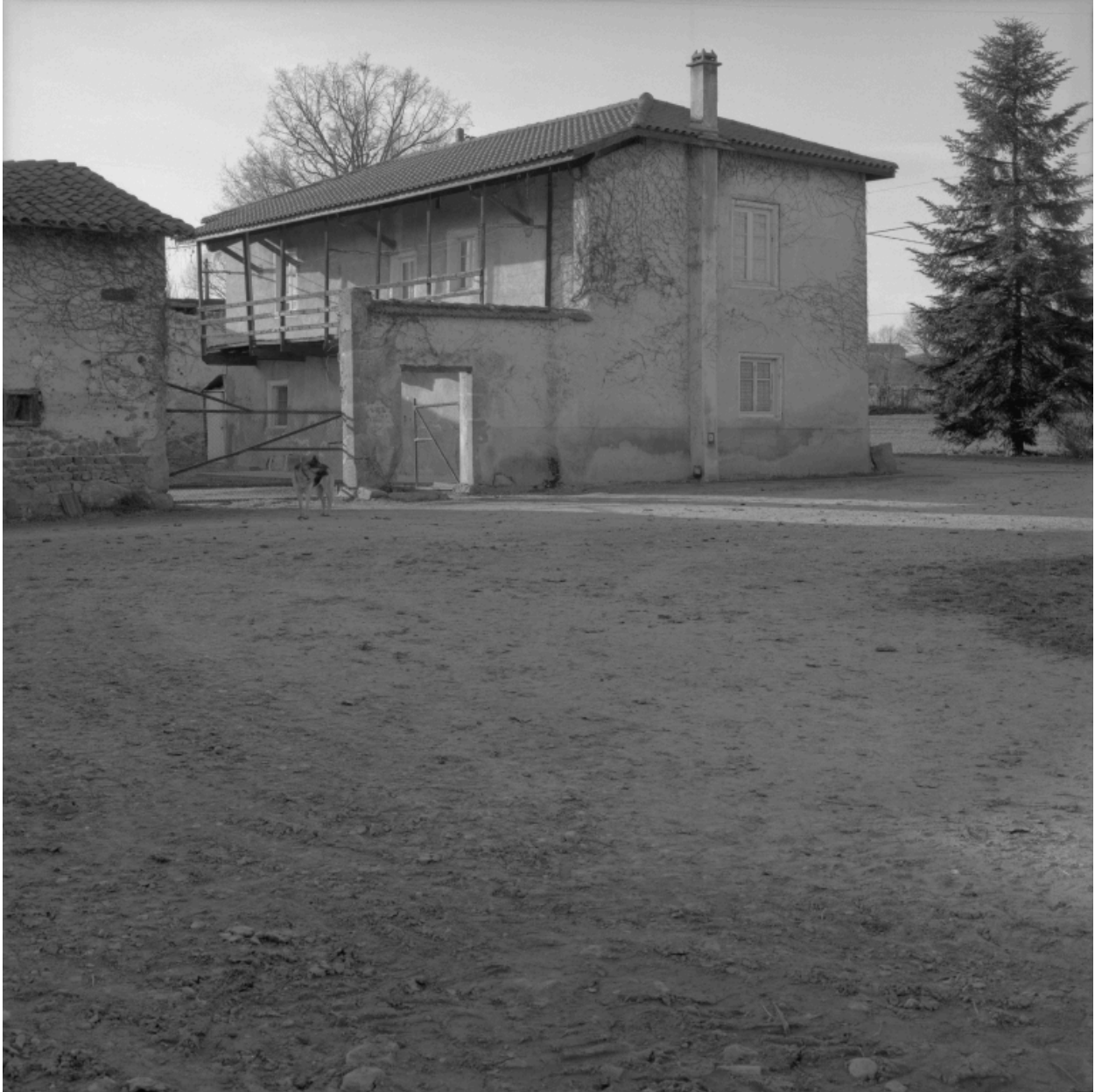
Vue d'ensemble du logis à aître depuis la deuxième cour.