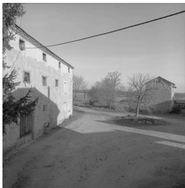
Vue d'ensemble du grenier et du colombier, depuis la deuxième cour. IVR82_20034200204X