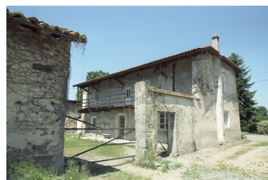
Vue d'ensemble du logis à âître depuis la deuxième cour.