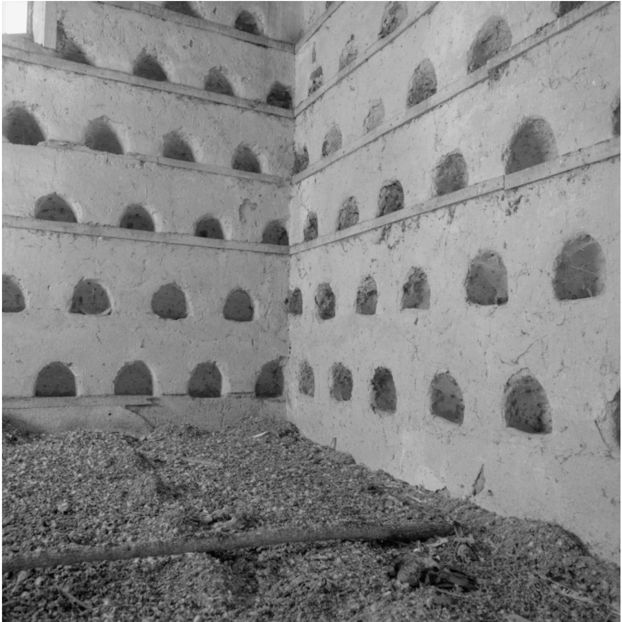
Colombier, vue intérieure.