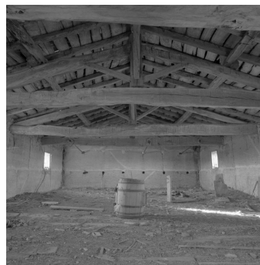
Vue intérieure du grenier, sous la charpente. IVR82_20034200208X