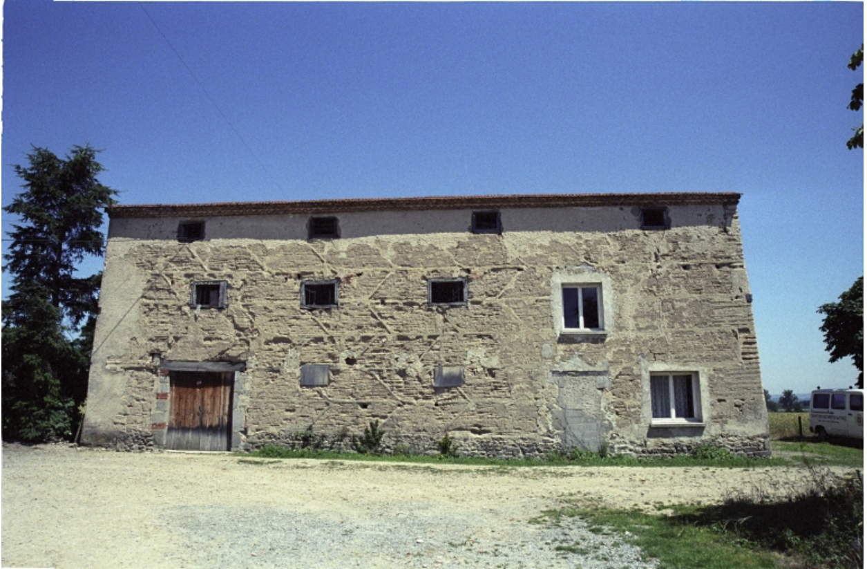
Vue d'ensemble du grenier.