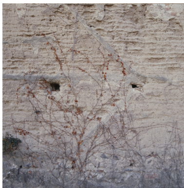
Détail du pisé du grenier.