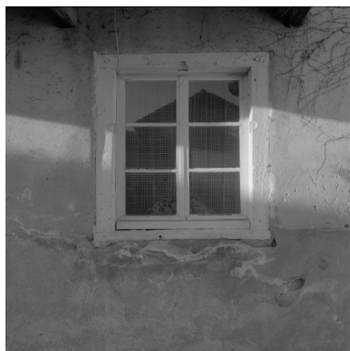
Logis à aître, élévation latérale droite, détail de la baie du rez-de-chaussée. IVR82_20034200202X