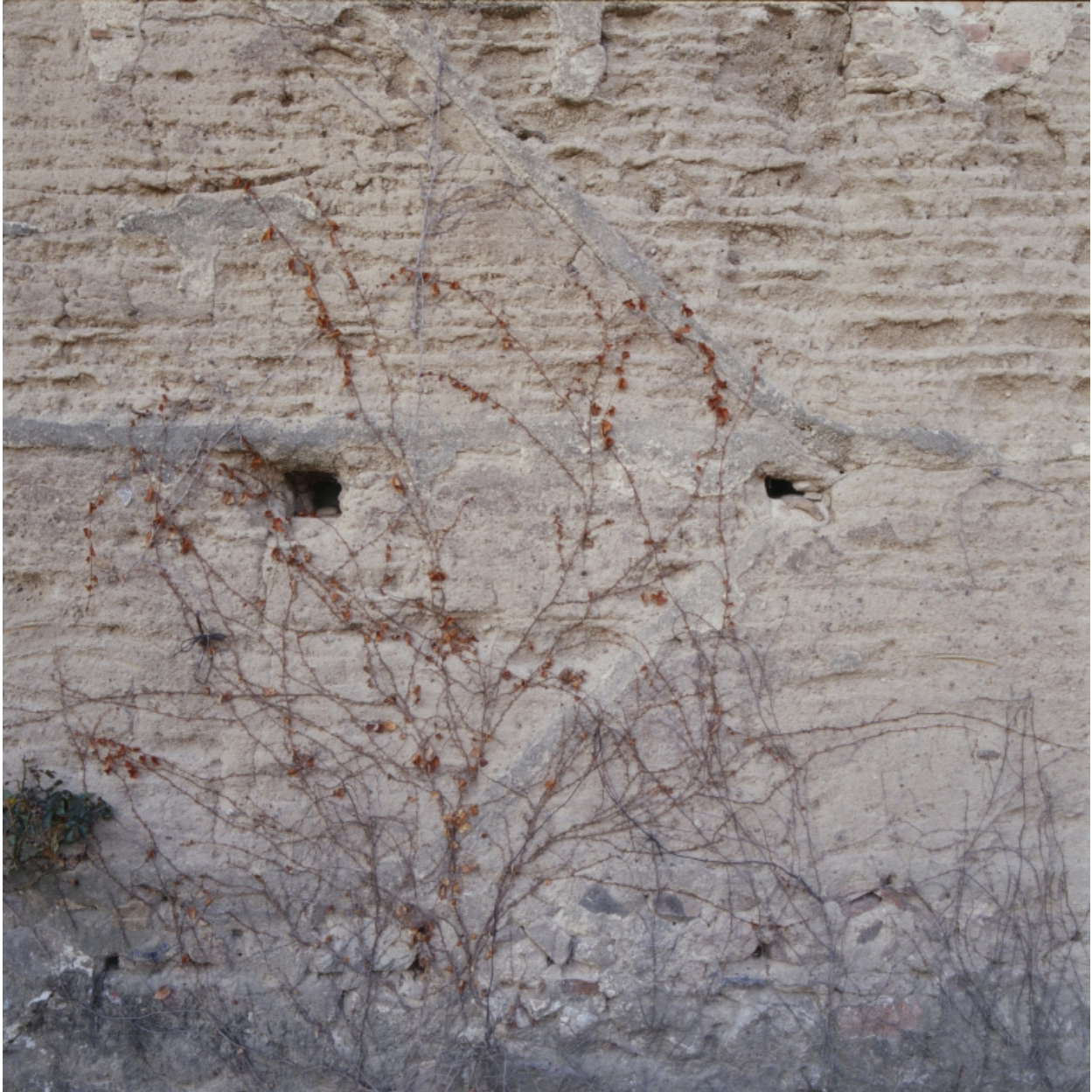
Détail du pisé du grenier.