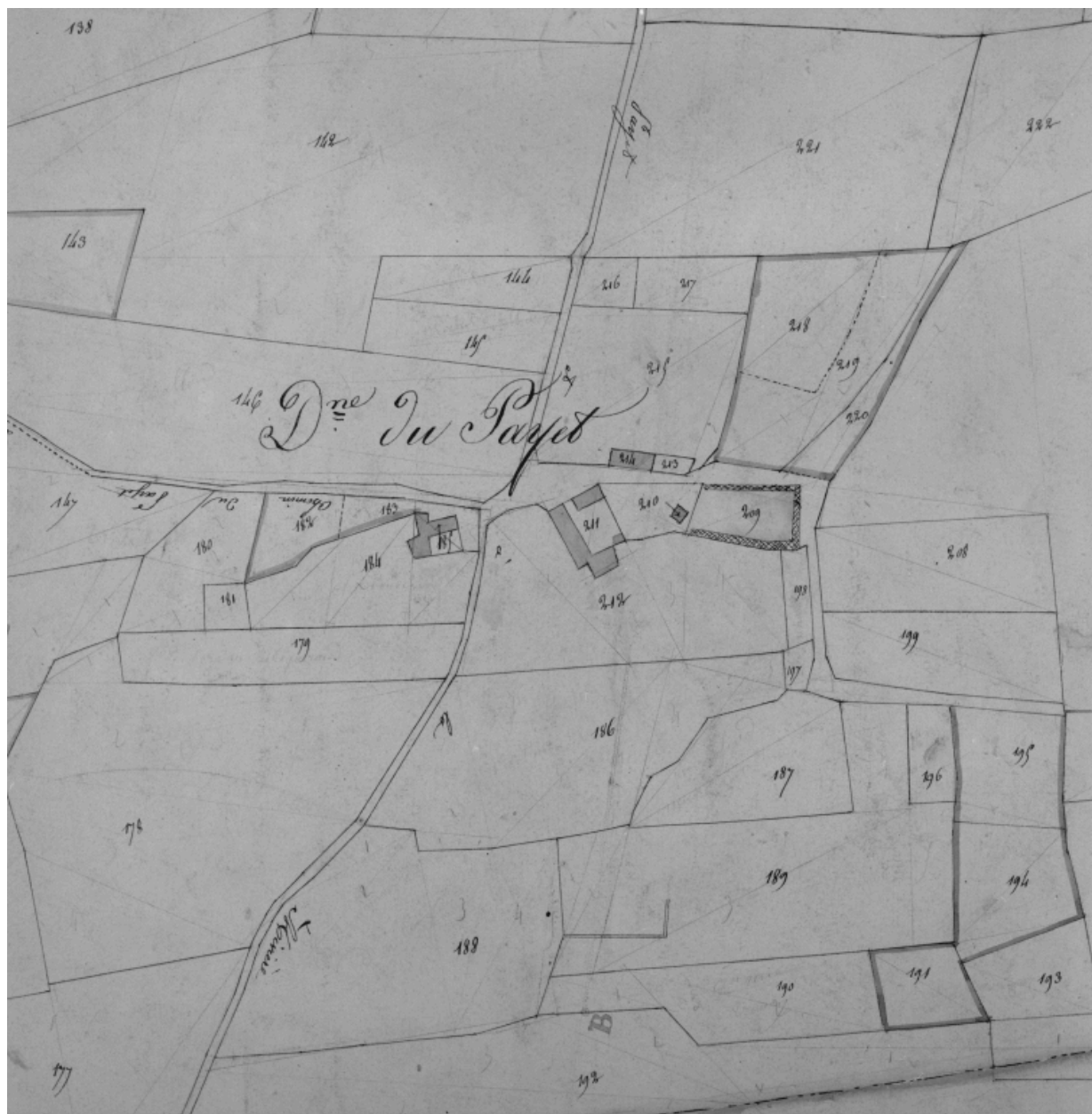
Plan cadastral ancien, 1826. Section C1, détail du Domaine du Payet, échelle originale 1/2500e.