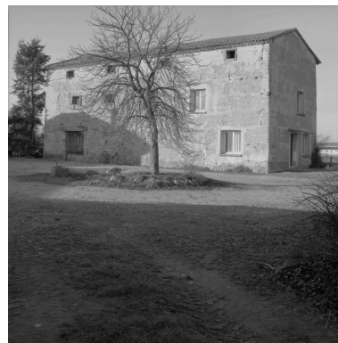
Vue d'ensemble du grenier. IVR82_20034200205X