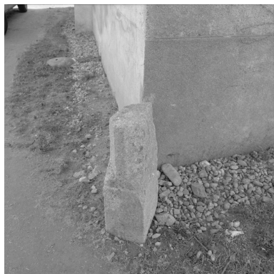
Détail d'une base de piédroit de cheminée en pierre. IVR82_20034200203X