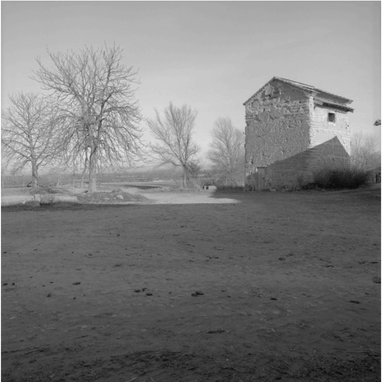
Colombier, vue d'ensemble.