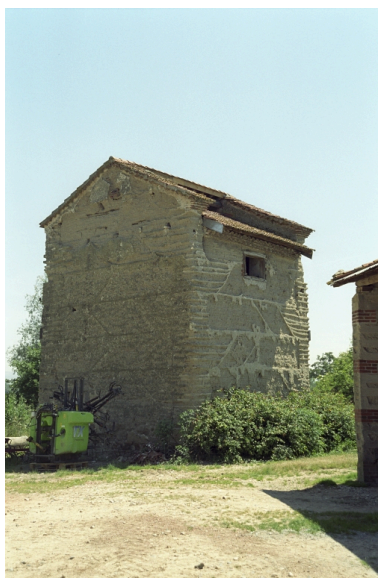
Colombier, vue d'ensemble.