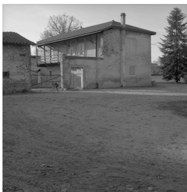
Vue d'ensemble du logis à âître depuis la deuxième cour.