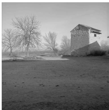
Colombier, vue d'ensemble.