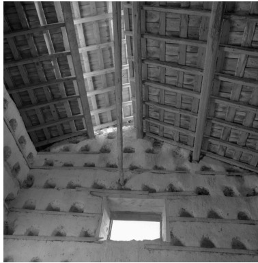
Colombier, vue intérieure : trous de boulins et toiture.