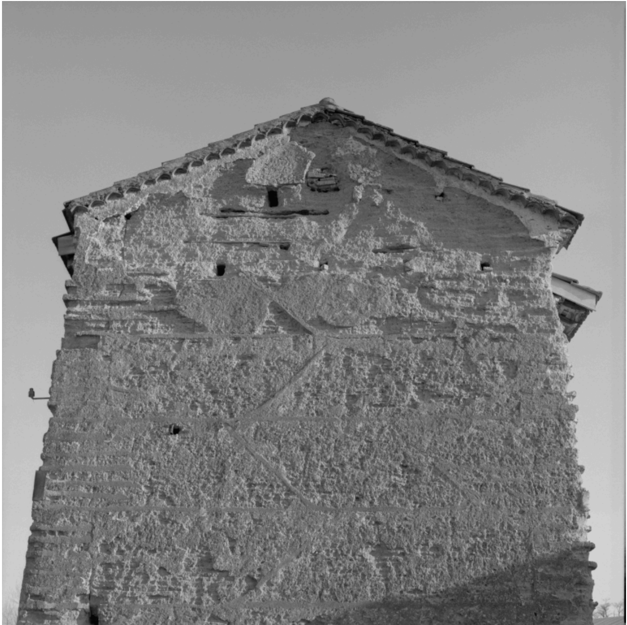
Colombier, détail du pisé du pignon gauche.