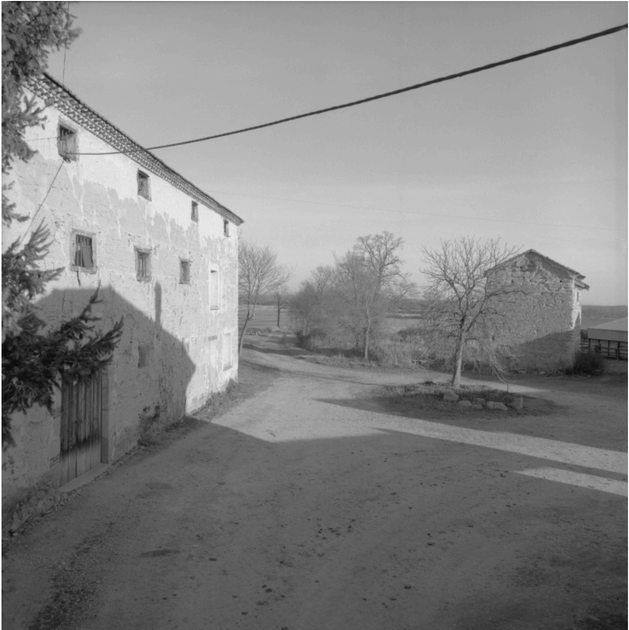
Vue d'ensemble du grenier et du colombier, depuis la deuxième cour.