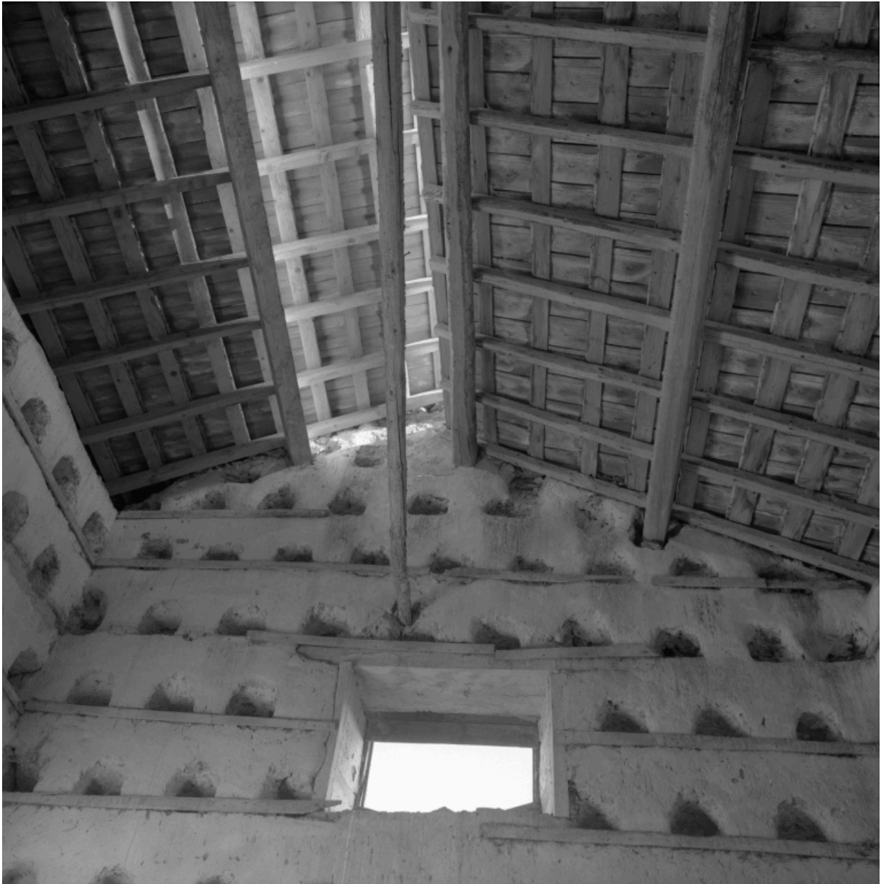
Colombier, vue intérieure : trous de boulins et toiture.