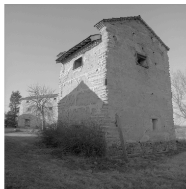
Colombier, vue d'ensemble de trois-quarts droite. IVR82_20024201587X