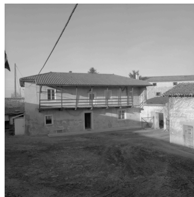
Vue d'ensemble de face du logis à aître, depuis la première cour.