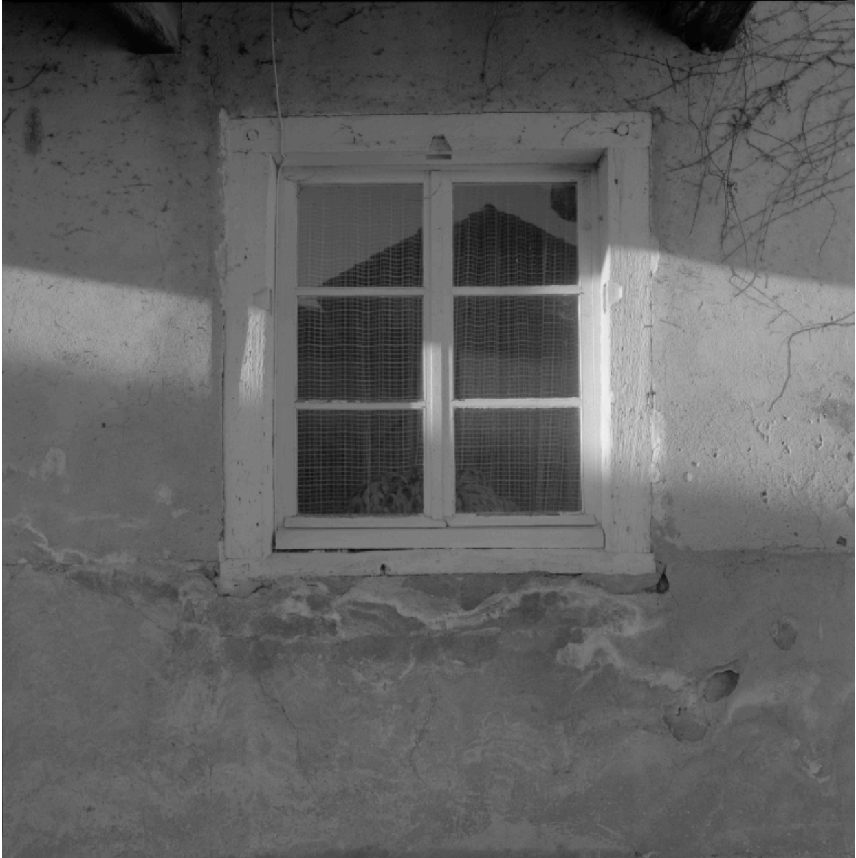
Logis à aître, élévation latérale droite, détail de la baie du rez-de-chaussée.