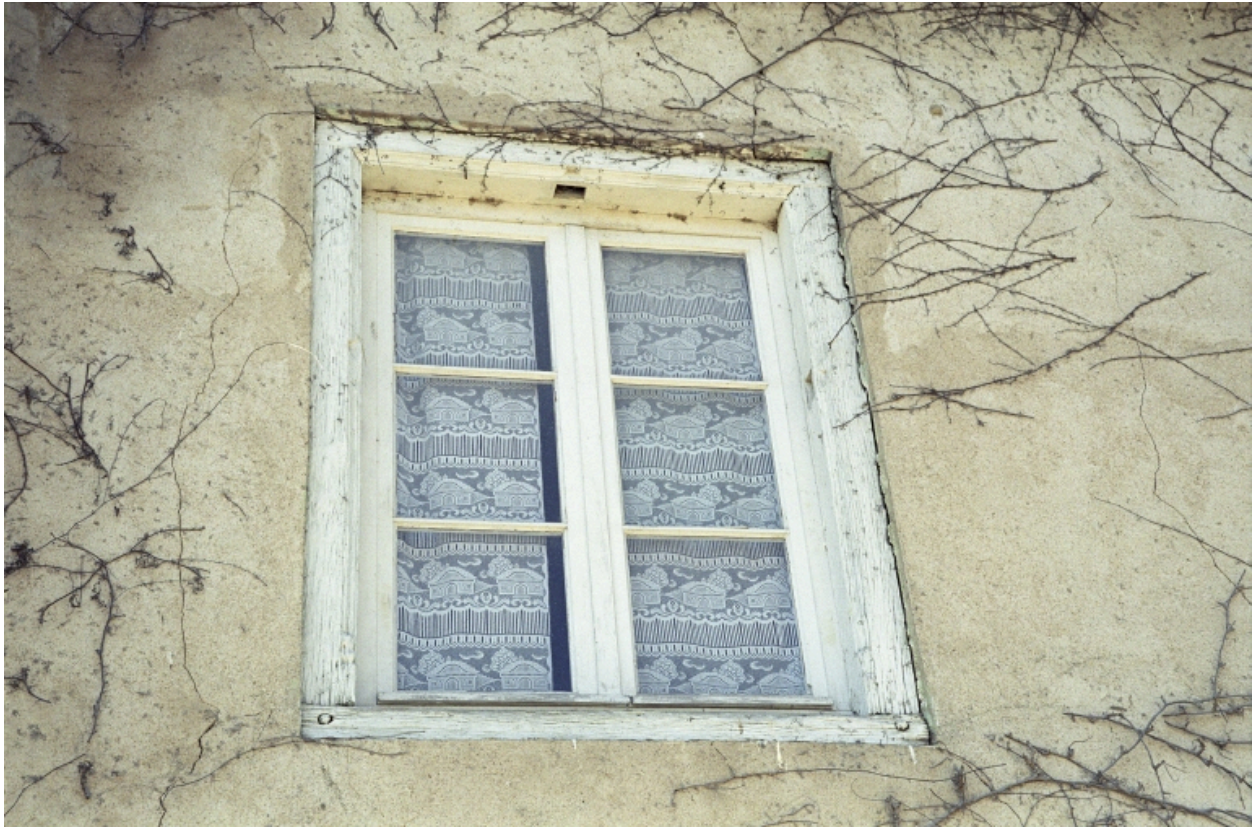
Logis à aître, élévation latérale droite, détail de la baie du premier étage.