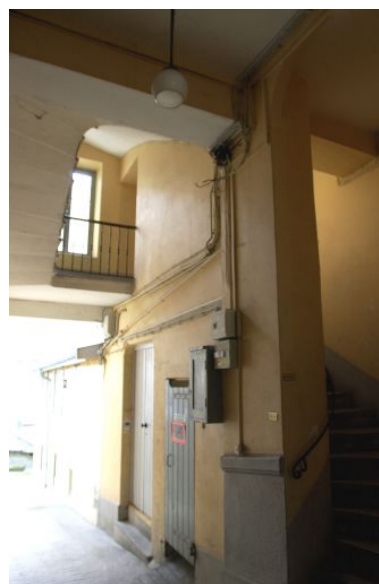
Détail de la 1ère volée d'escalier décalée. IVR82_20016900250NUCA