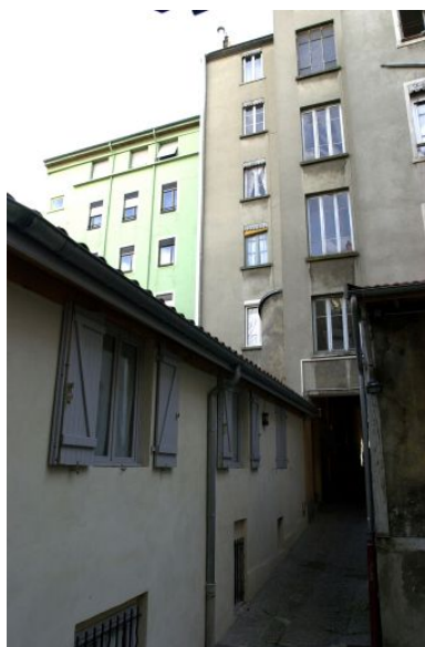
Elévations postérieures et tour d'escalier et vue du corps de bâtiment à droite de la cour IVR82_20016900252NUCA