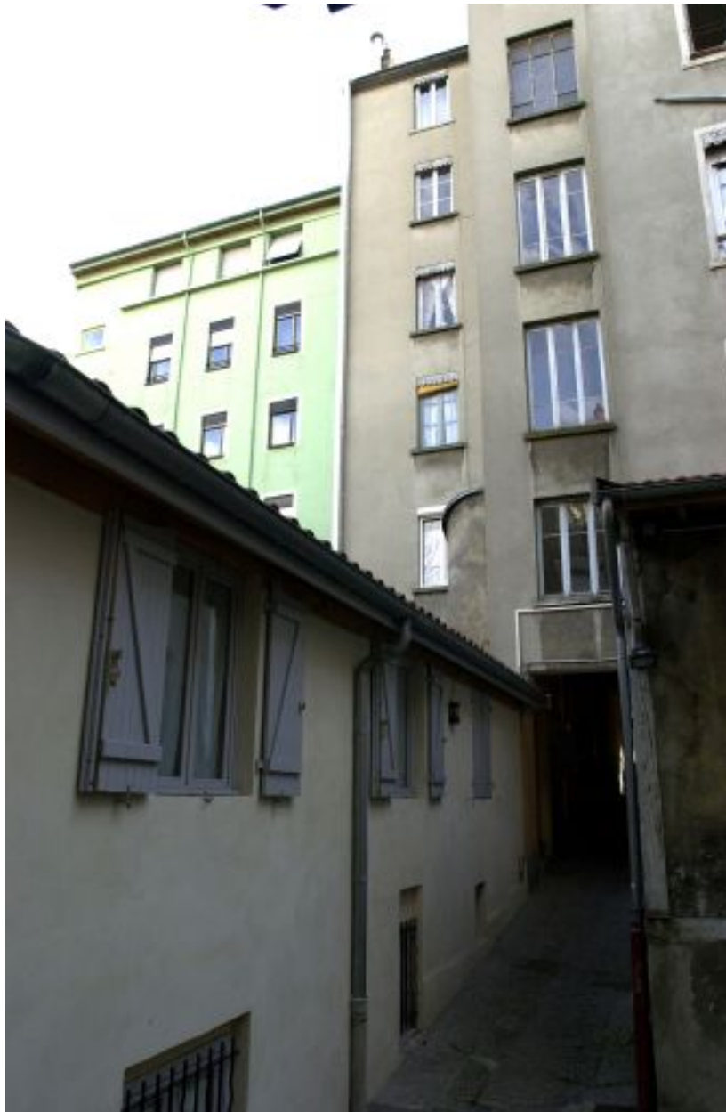
Elévations postérieures et tour d'escalier et vue du corps de bâtiment à droite de la cour