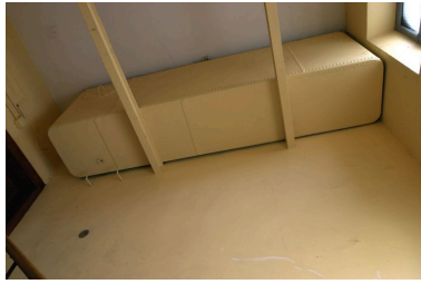
Vue de la citerne en tôle au dernier étage IVR82_20016900257NUCA