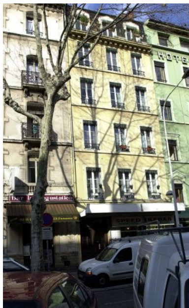
Elévation principale IVR82_20016900248NUCA