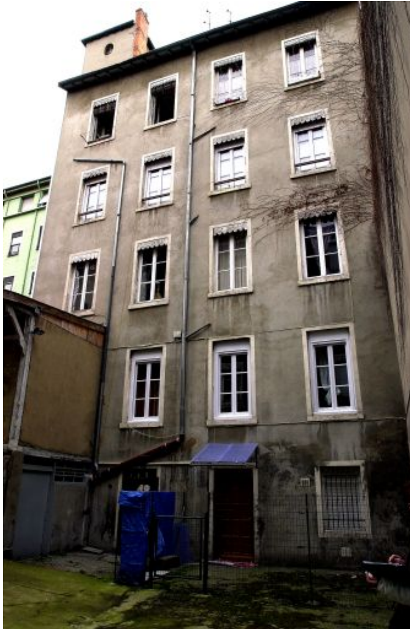
Elévation du corps de bâtiment sur cour