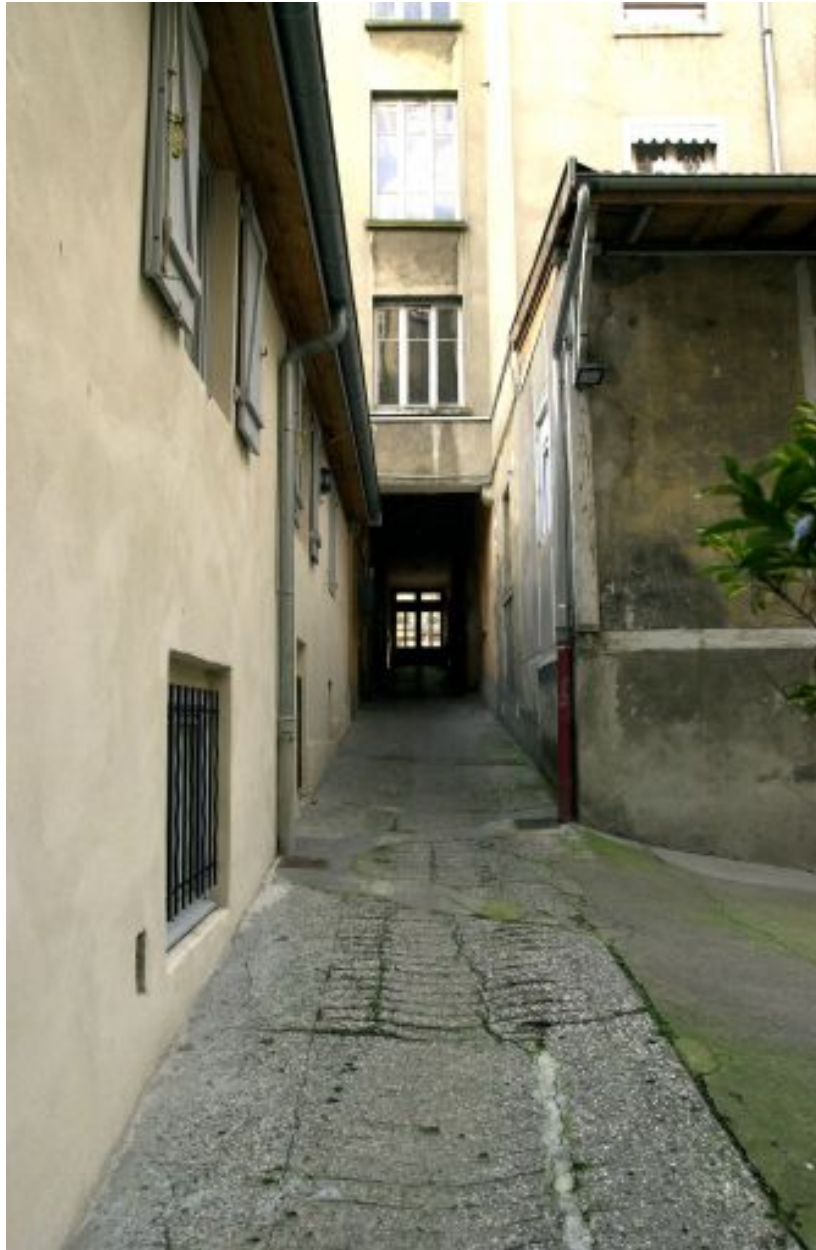
Vue du passage cocher depuis la cour