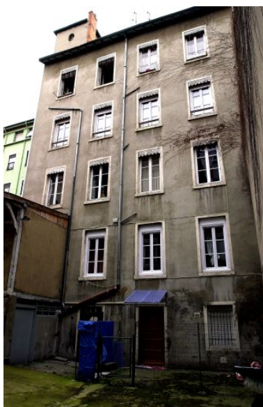
Elévation du corps de bâtiment sur cour IVR82_20016900258NUCA