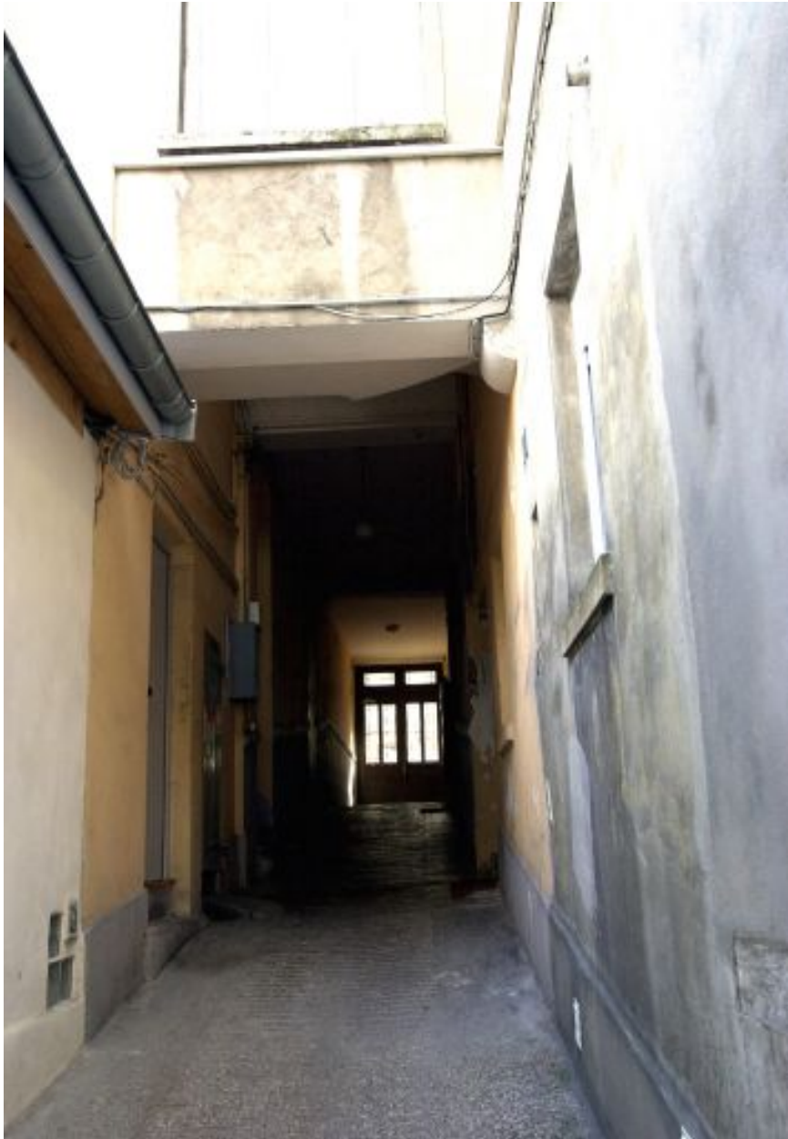
Vue rapprochée du passage cocher