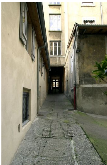
Vue du passage cocher depuis la cour IVR82_20016900249NUCA