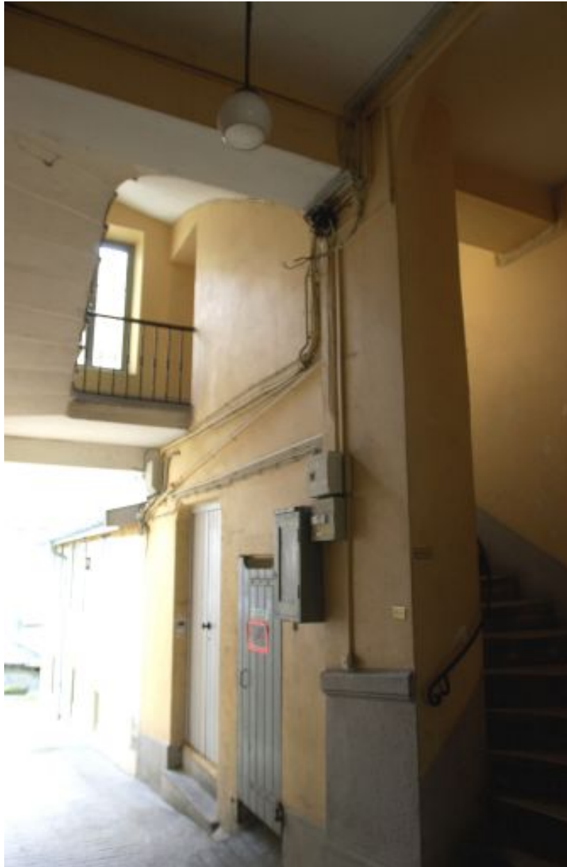
Détail de la 1ère volée d'escalier décalée.