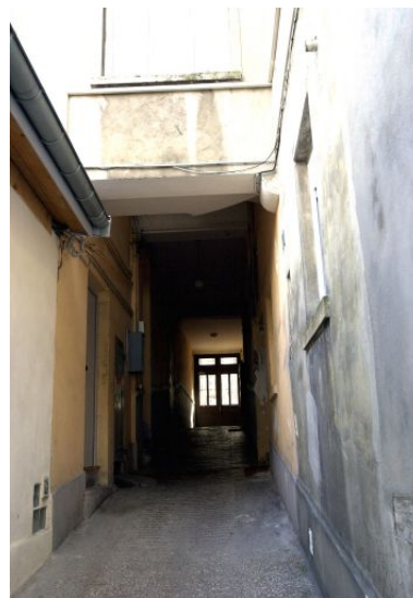
Vue rapprochée du passage cocher