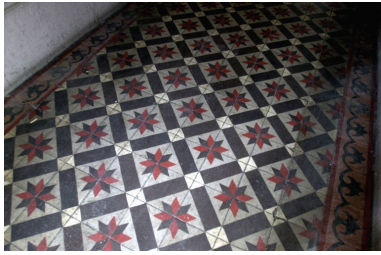
Pavement du vestibule en carreaux de ciment. IVR82_20016900253NUCA