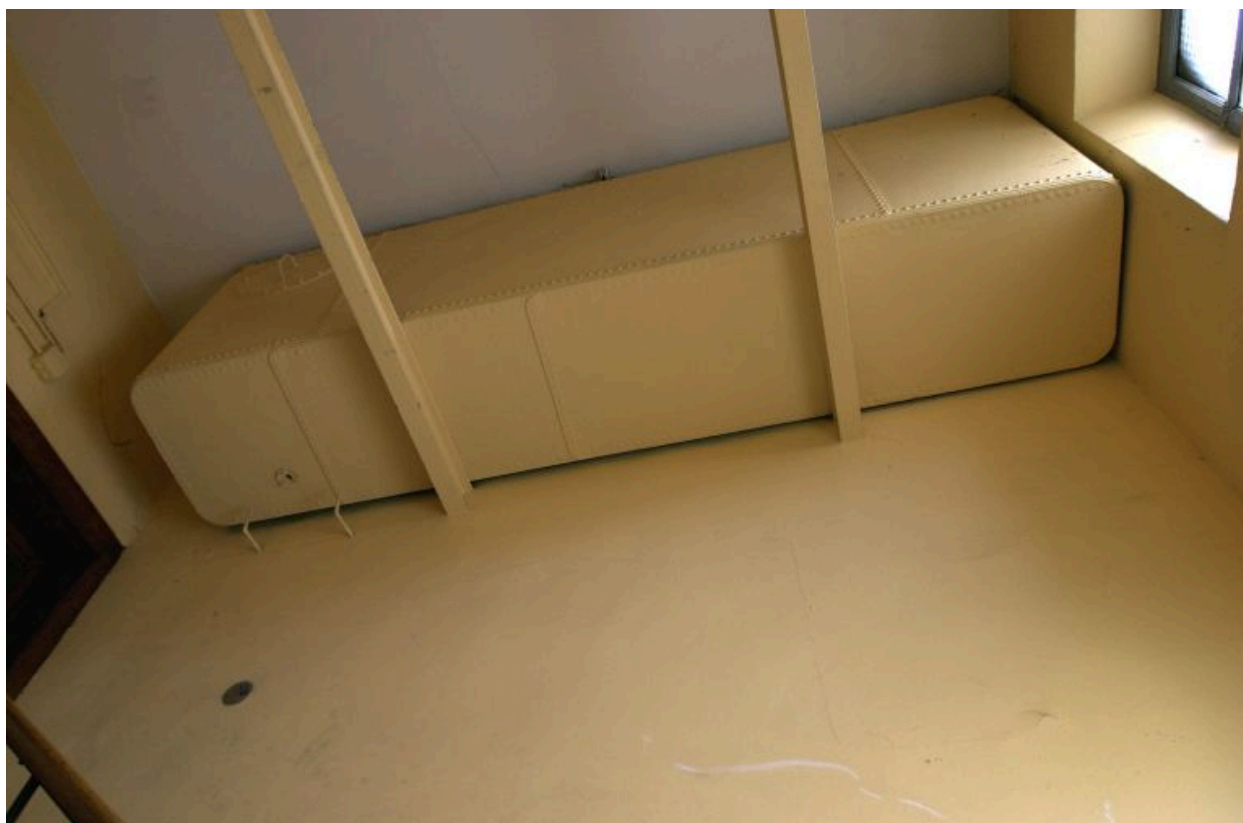
Vue de la citerne en tôle au dernier étage