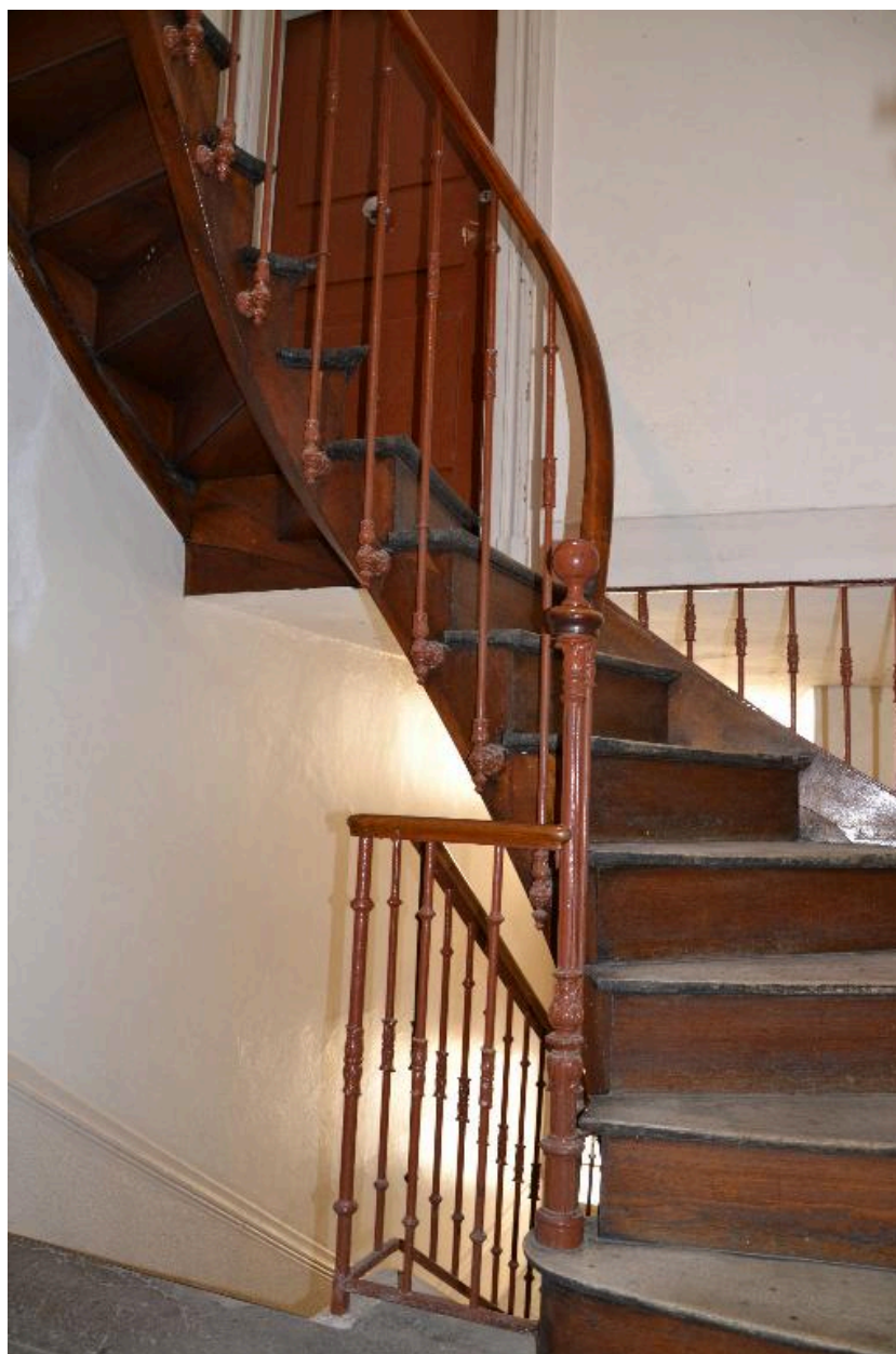
Escalier dernier niveau