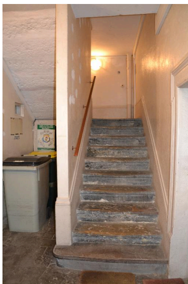
Départ escalier