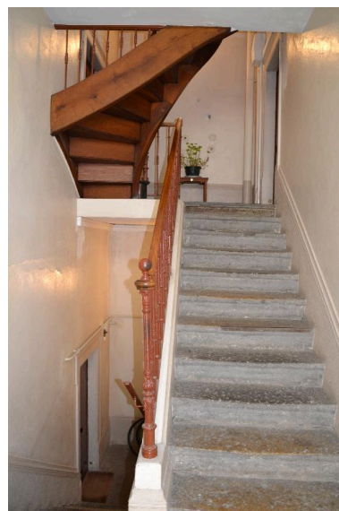
Escalier IVR82_20156900659NUCA