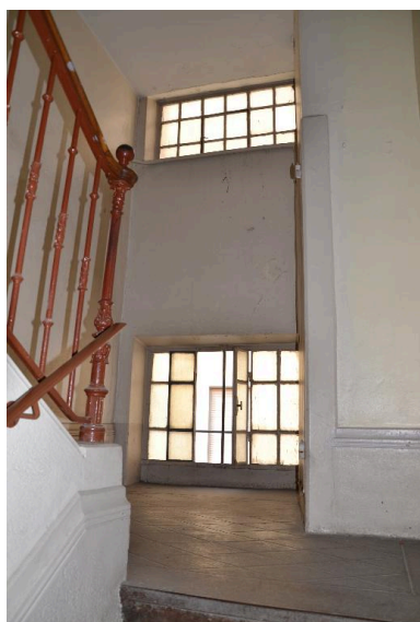
Baie escalier IVR82_20156900661NUCA