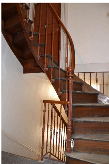
Escalier dernier niveau