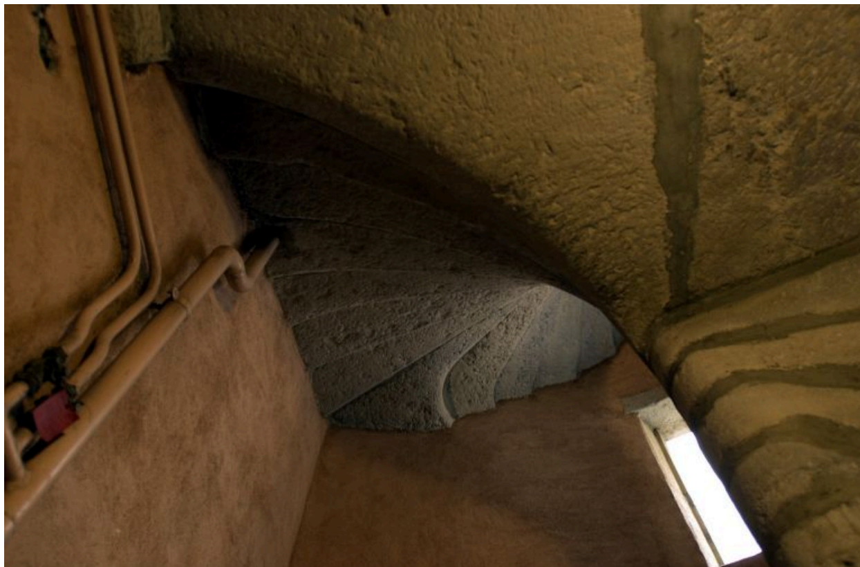
Escalier, raccord au 3e étage entre les marches de la partie ancienne et celles de la partie ajoutée au 18e siècle, vu par dessous