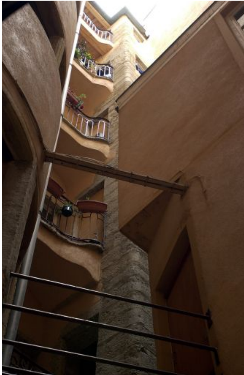
Passage de la tour d'escalier vers le corps en fond de cour et galeries de l'aile gauche