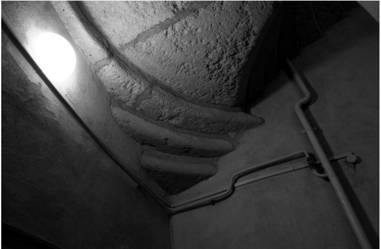
Escalier, console soutenant un angle vu depuis le palier du 2e étage