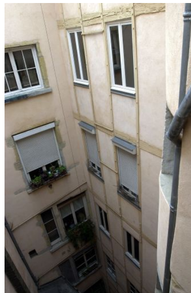
Elévation sur cour et aile droite