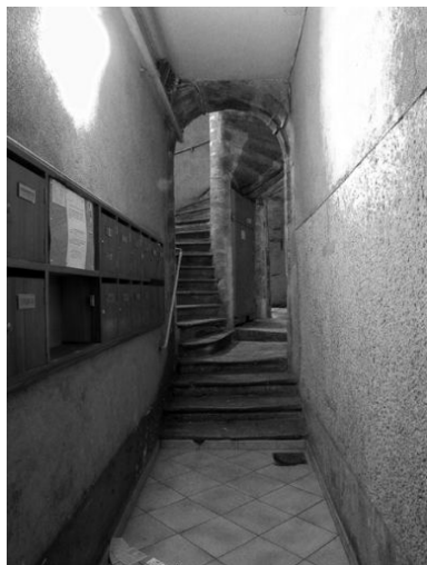
Allée et escalier IVR82_20036901180NUC