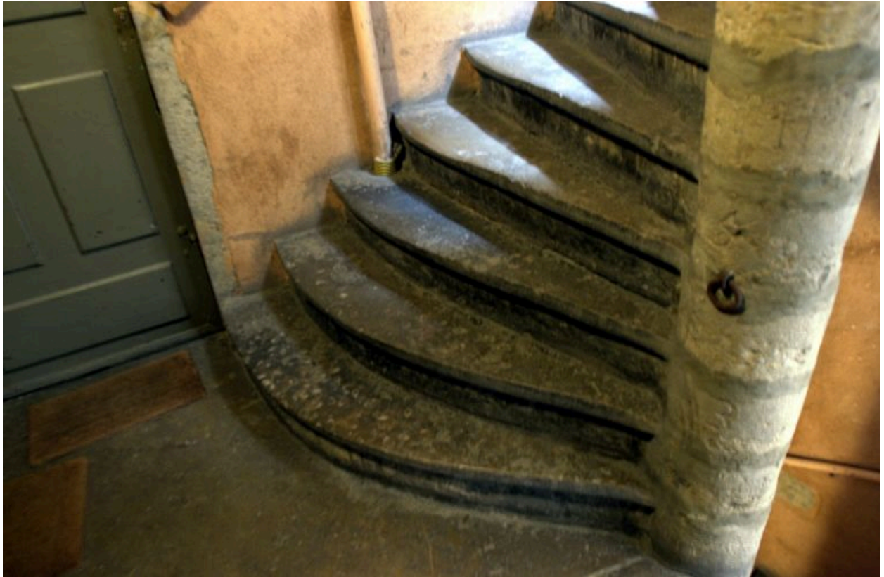
Escalier, palier du 3e étage, détail des marches de la partie ajoutée au 18e siècle