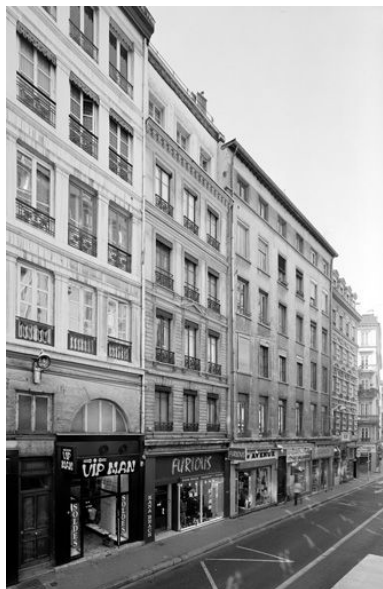
Façade, vue générale IVR82_20056902667V