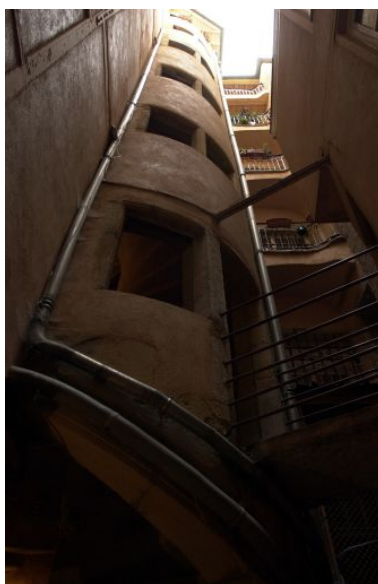
Tour d'escalier IVR82_20036901181NUCA