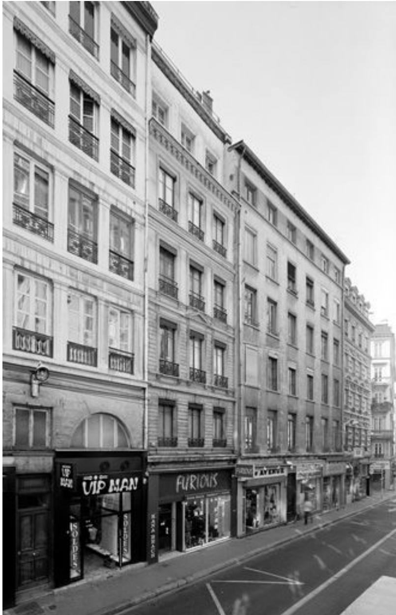
Façade, vue générale