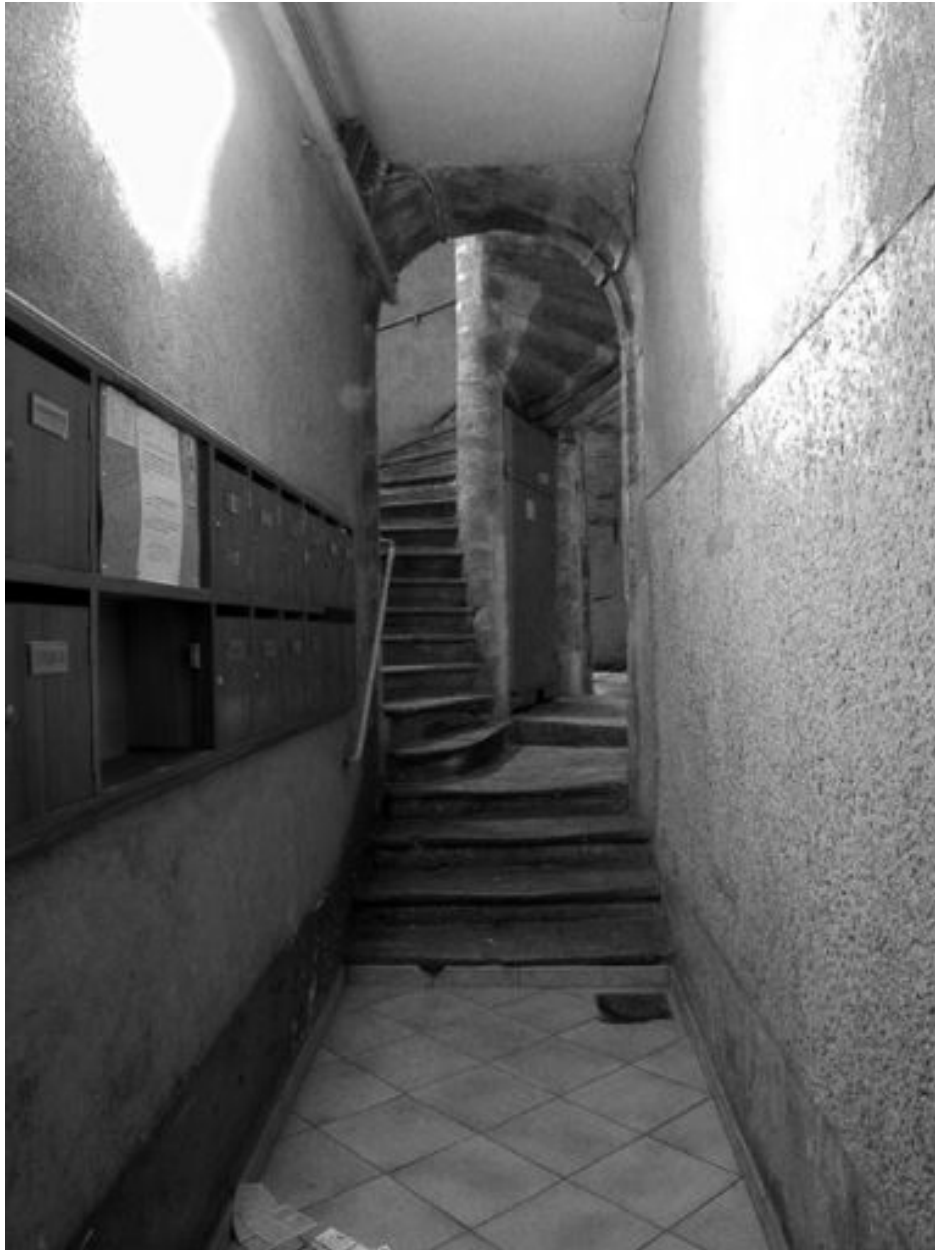
Allée et escalier