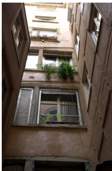
Aile droite