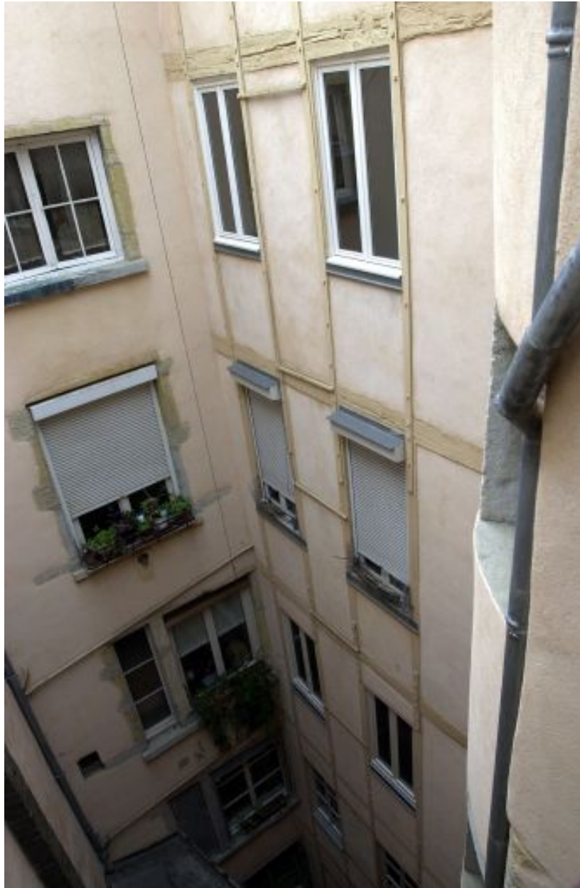
Elévation sur cour et aile droite