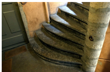
Escalier, palier du 3e étage, détail des marches de la partie ajoutée au 18e siècle IVR82_20036901187NUCA