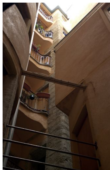
Passage de la tour d'escalier vers le corps en fond de cour et galeries de l'aile gauche