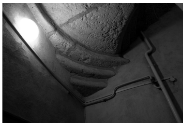
Escalier, console soutenant un angle vu depuis le palier du 2e étage IVR82_20036901184NUC