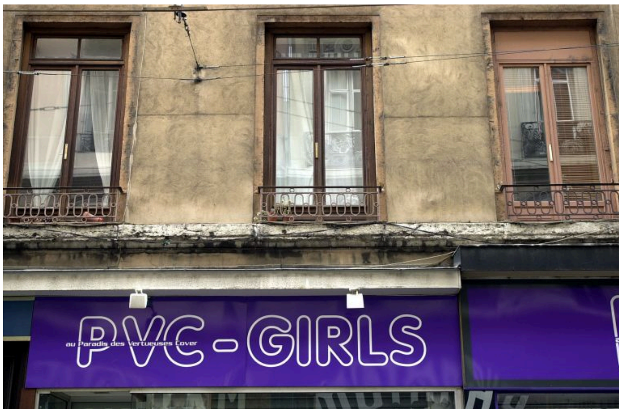
Façade, détail des fenêtres du premier étage