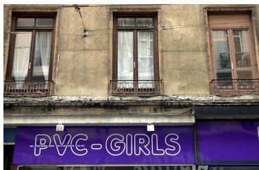
Façade, détail des fenêtres du premier étage