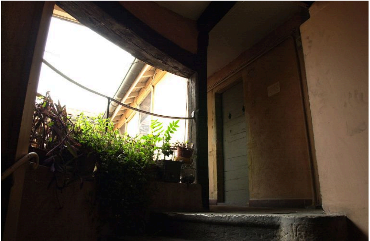
Escalier, dernier palier et galerie longeant l'arrière du premier corps de bâtiment