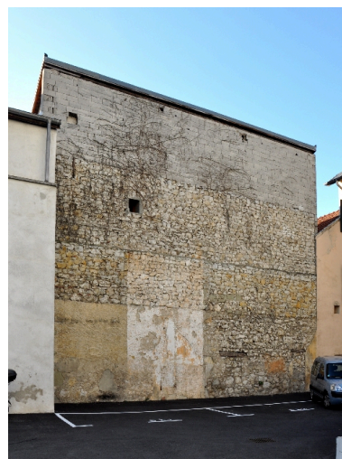
Elévation postérieure IVR82_20097301076NUCA