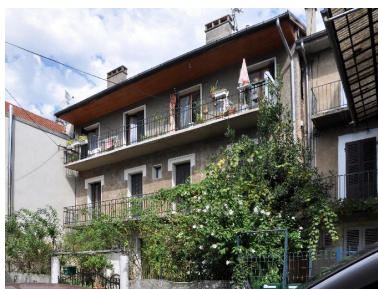
Vue générale IVR82_20117300530NUCA