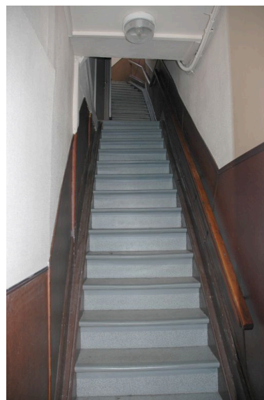
Escalier droit en bois, à deux volées entre-murs.