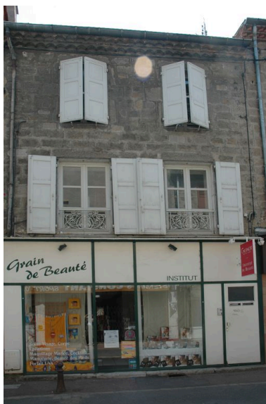
Vue générale