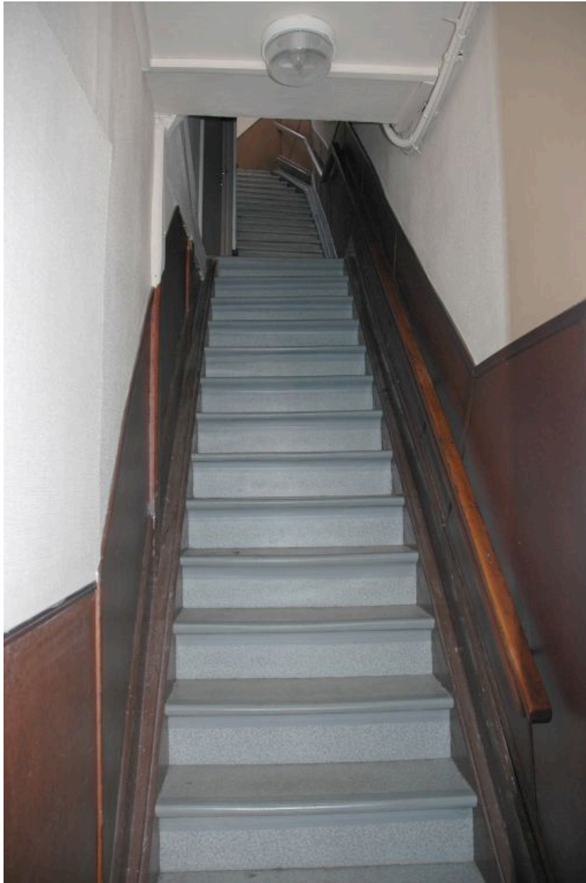
Escalier droit en bois, à deux volées entre-murs.