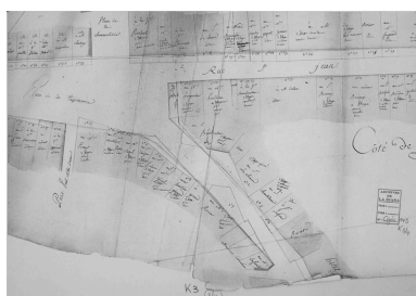
Vue partielle de la traversée de Montbrison en 1780, détail feuille K3 (3/4) : 13 rue Saint-Jean. plan de 1780