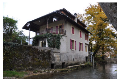
Encoches du canal de fuite percées dans la digue IVR82_20117401302NUCA