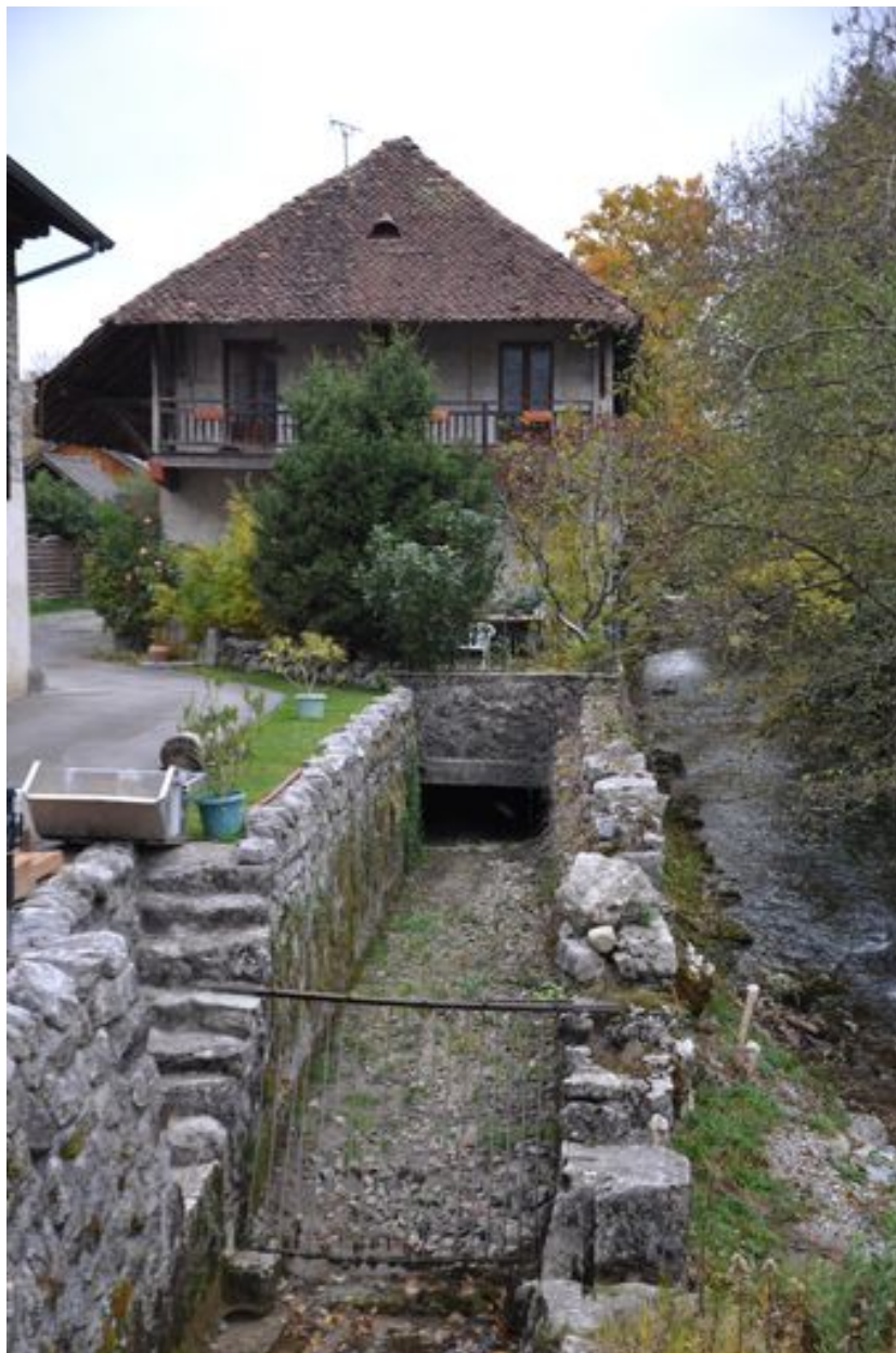
Canal d'amenée donnant sur le mur pignon sud de la scierie