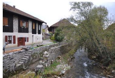
Vue d'ensemble prise depuis le pont de Verthier IVR82_20117401299NUCA