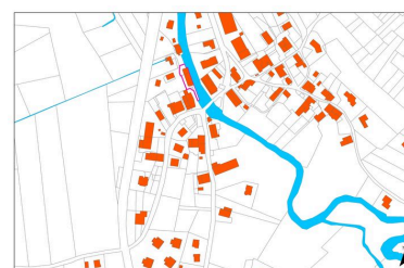
Cadastre 2011 IVR82_20117401296NUCA