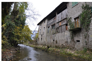
Défilé de la façade donnant sur le ruisseau de l'Eau-Morte IVR82_20117401300NUCA