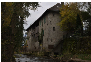
Le bâtiment de la scierie se révèle depuis le ruisseau de l'Eau-Morte IVR82_20117401301NUCA