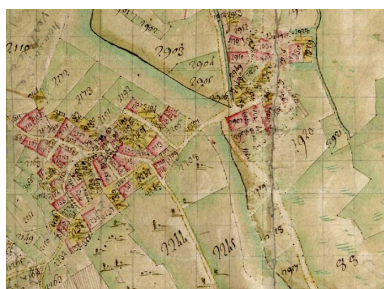
Copie de la carte sarde, cadastre de 1739, 1728-1738. Plan. Archives départementales de la Haute-Savoie 1 C d 12 - COPIE IVR82_20117401294NUCA