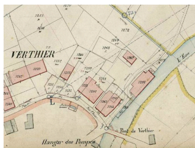
Extrait de la Section B Feuille n°5 du cadastre de Doussard, 1905. Plan. Archives départementales de la Haute-Savoie 3 P 3/4232 IVR82_20117401295NUCA