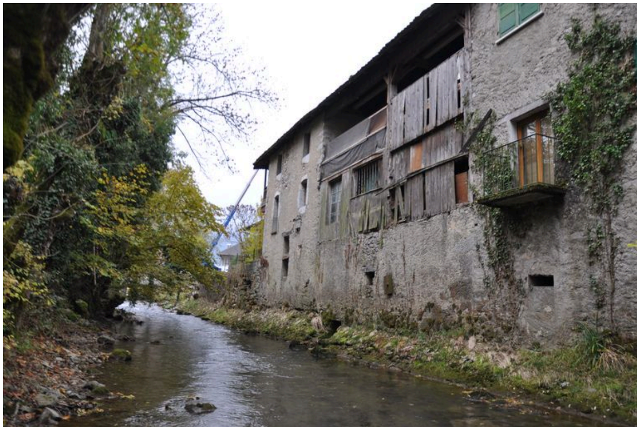
Défilé de la façade donnant sur le ruisseau de l'Eau-Morte