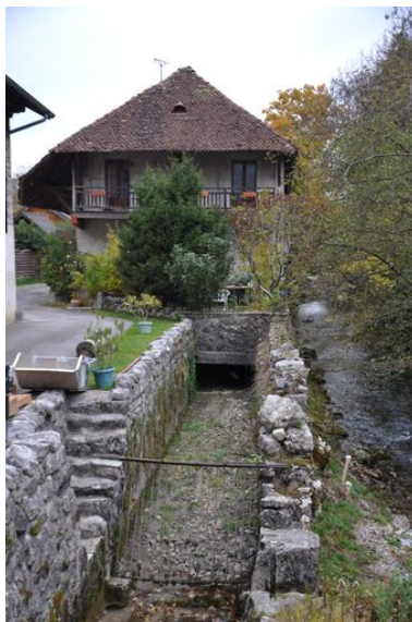
Canal d'amenée donnant sur le mur pignon sud de la scierie IVR82_20117401298NUCA