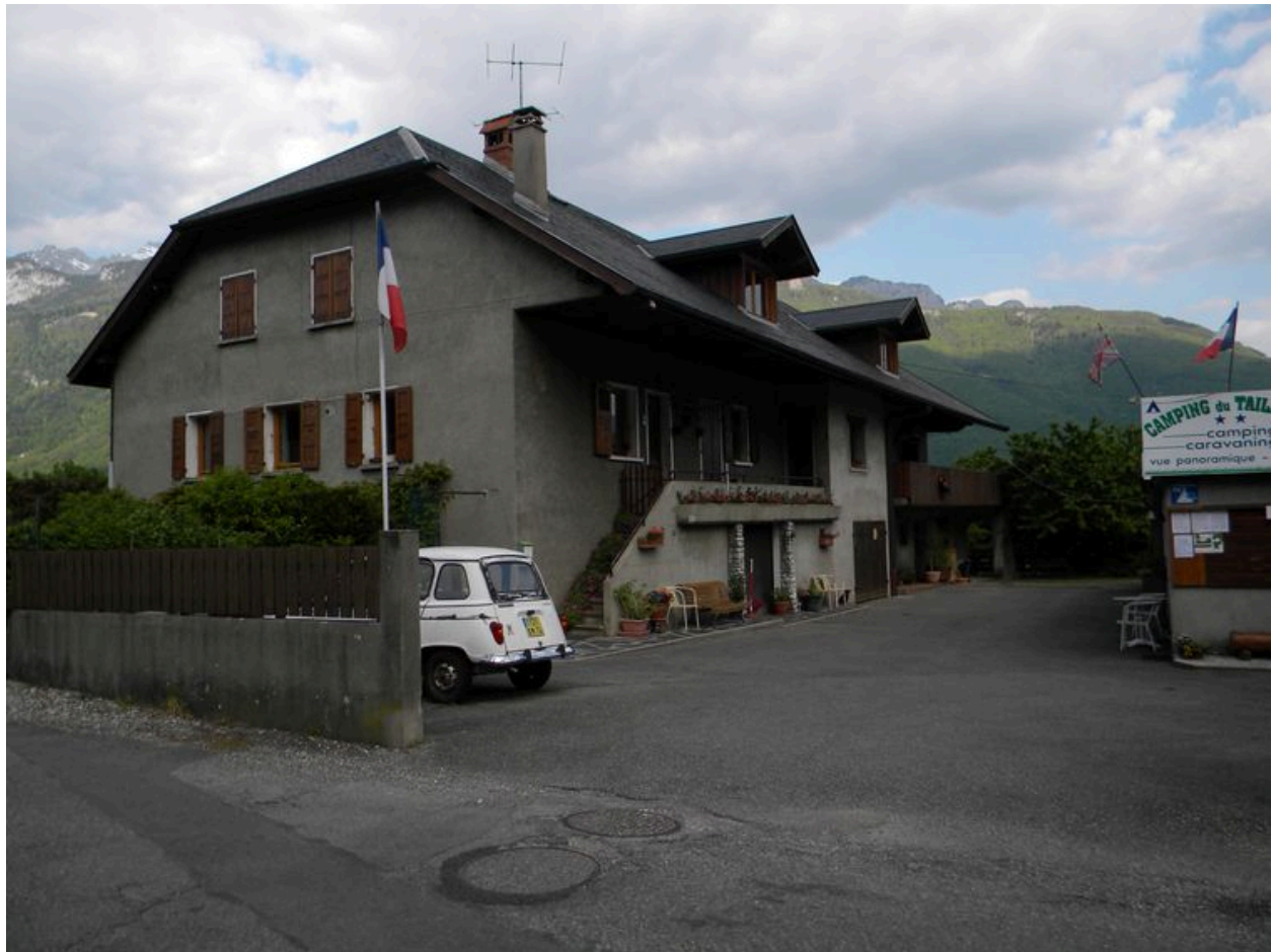
Vue générale d'une ancienne ferme (A4 3148).