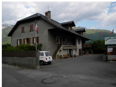
Vue générale d'une ancienne ferme (A4 3148).