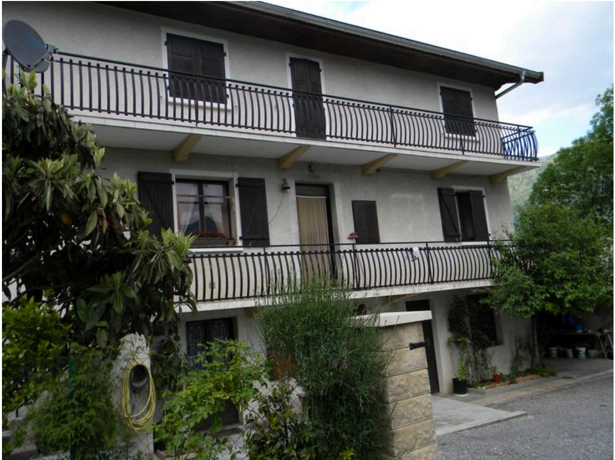
Façade principale d'une ancienne maison reconstruite dans la seconde moitié du XXe siècle.