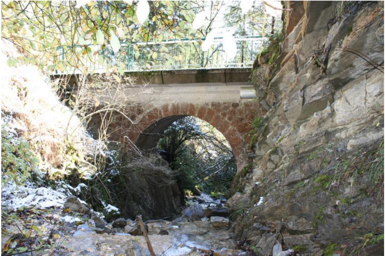
Pont des Granges, face amont