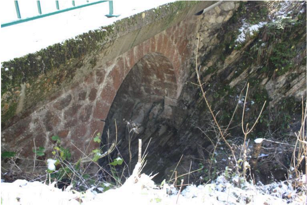
Pont des Granges, détails voute, culée et plinthe