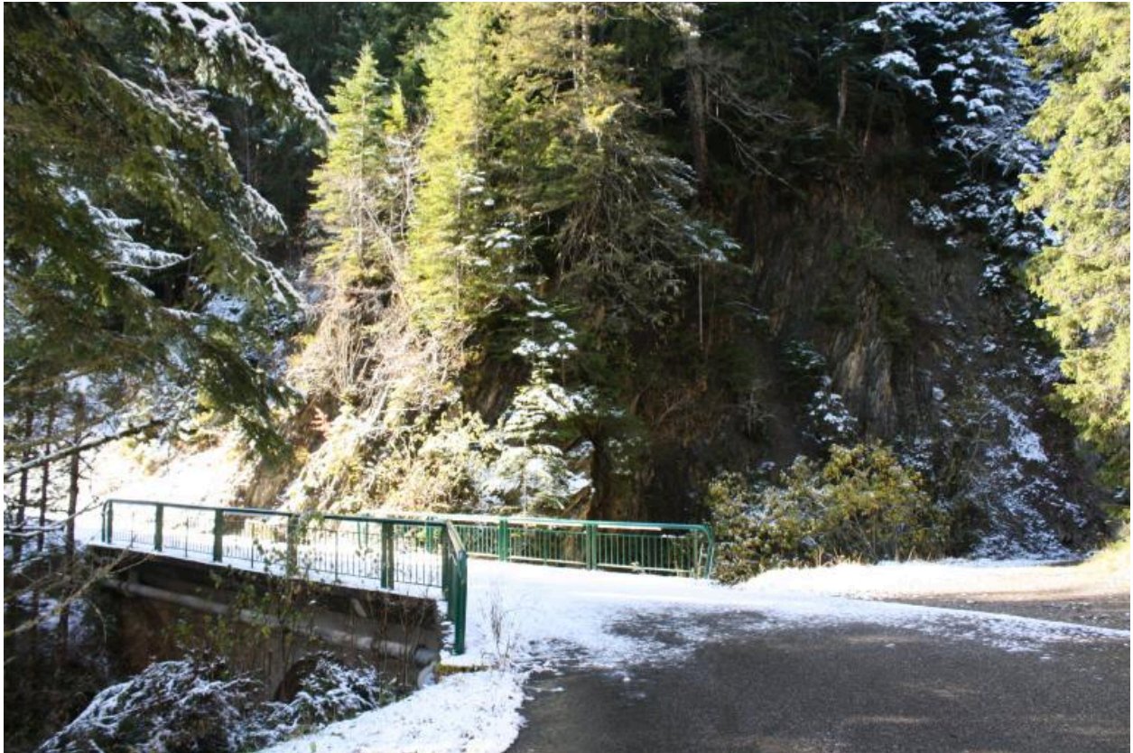
Pont des Granges, contexte