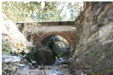
Pont des Granges, face amont IVR84_20197401283NUCA