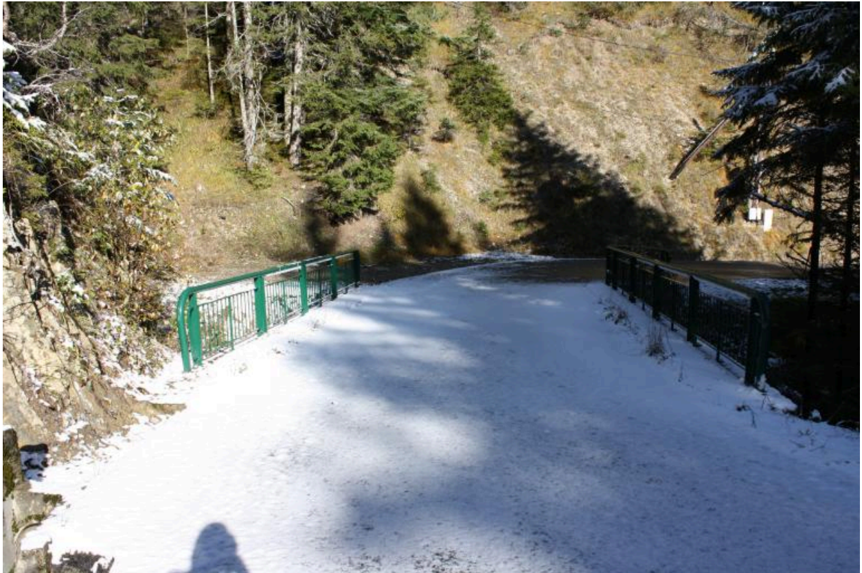
Pont des Granges, Chaussée et gardes corps