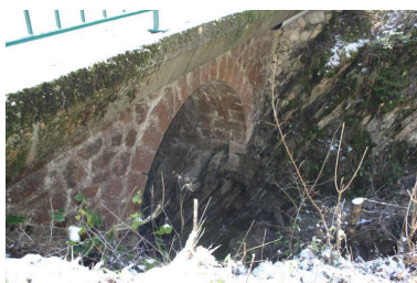
Pont des Granges, détails voûte, culée et plinthe IVR84_20207401273NUCA