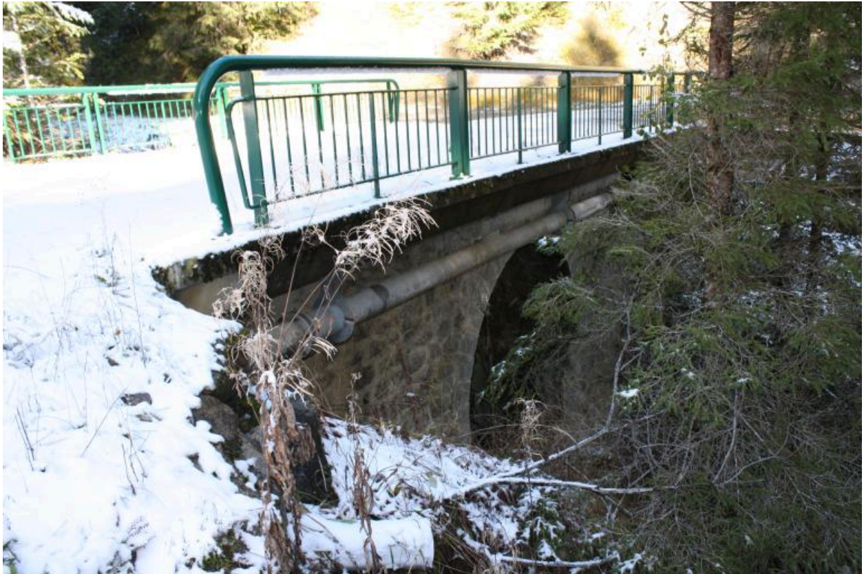
Pont des Granges, face aval