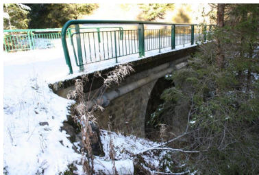
Pont des Granges, face aval