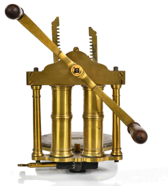
Pompe à vide, vue 2 IVR84_20256901834NUCA