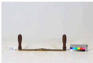
Manivelle de pompe à vide, IVR84_20256901150NUCA