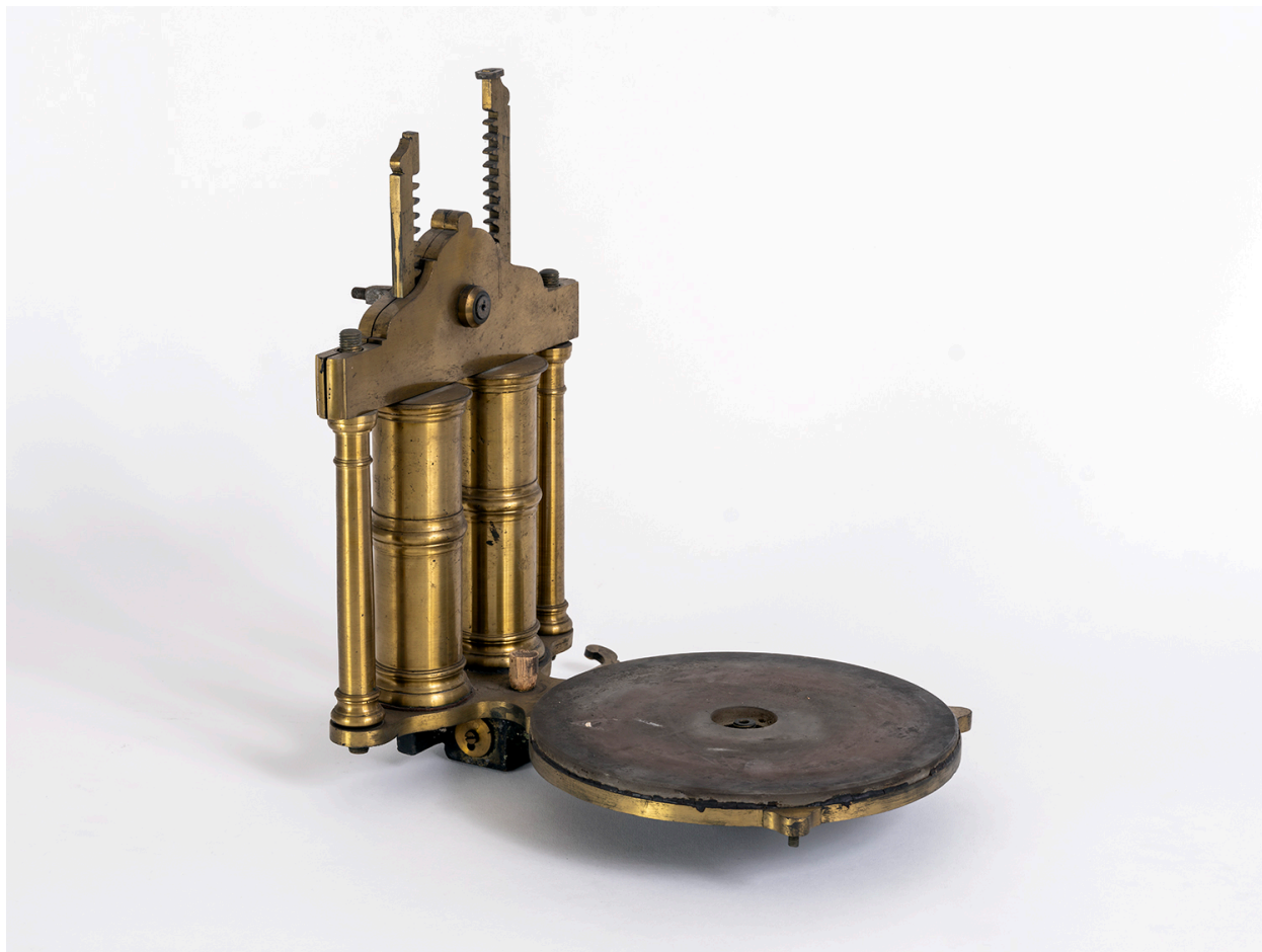
Vue d'ensemble (manquent la cloche en verre, le thermomètre et la double manivelle)