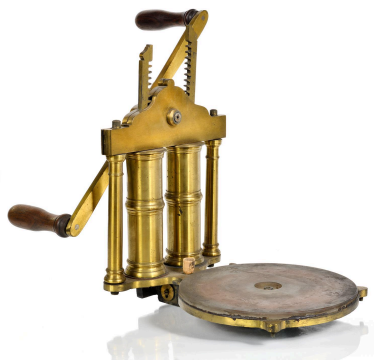
Pompe à vide, vue 1 IVR84_20256901833NUCA