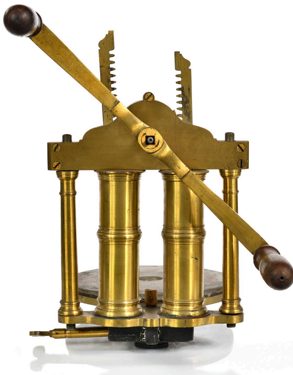
Pompe à vide, vue 2