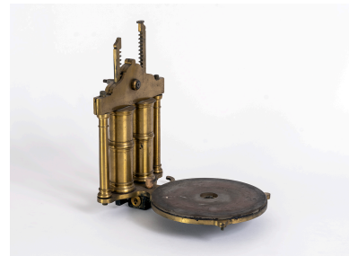
Vue d'ensemble (manquant la cloche en verre, le thermomètre et la double manivelle) IVR84_20246900139NUCA