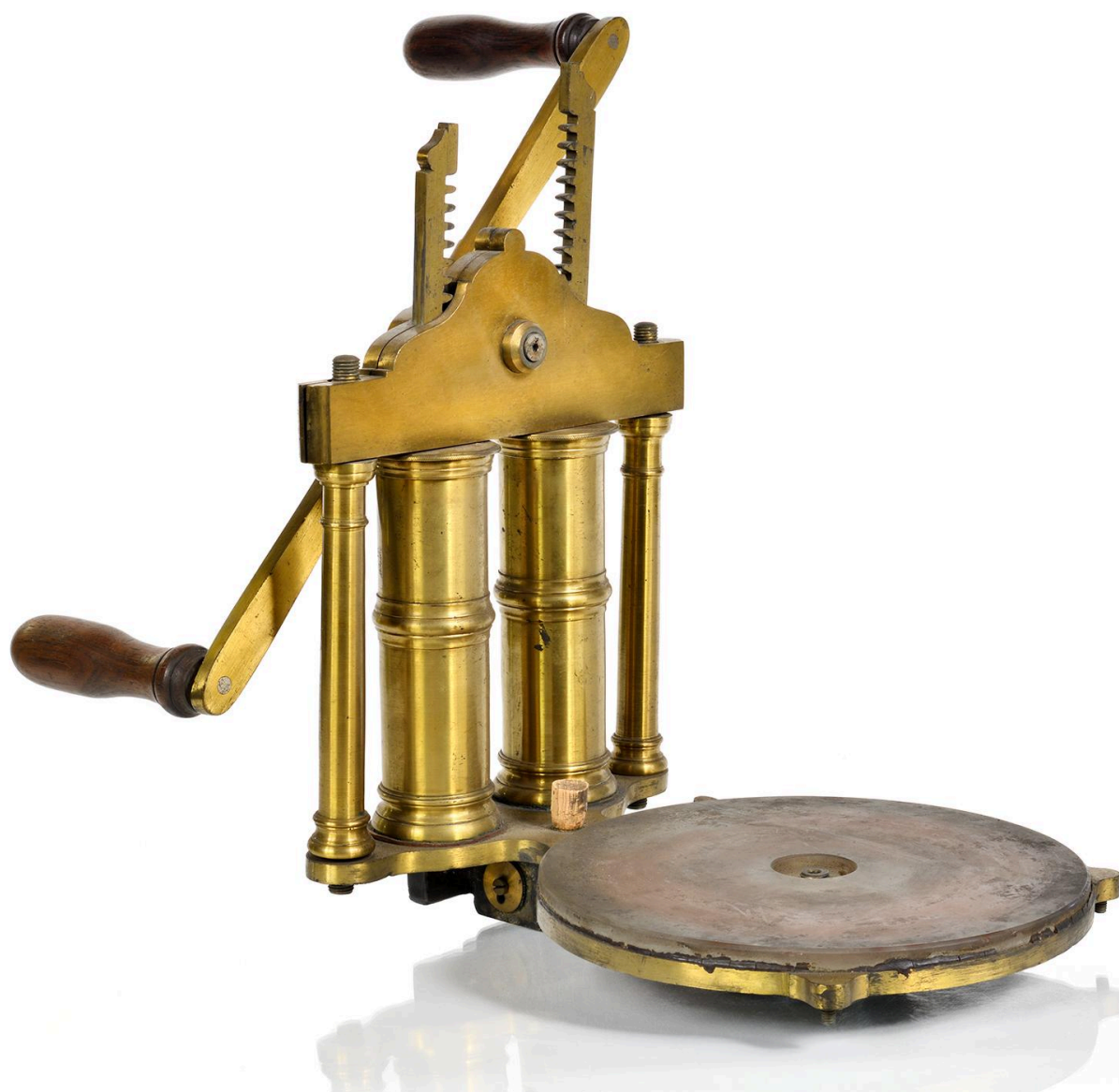
Pompe à vide, vue 1