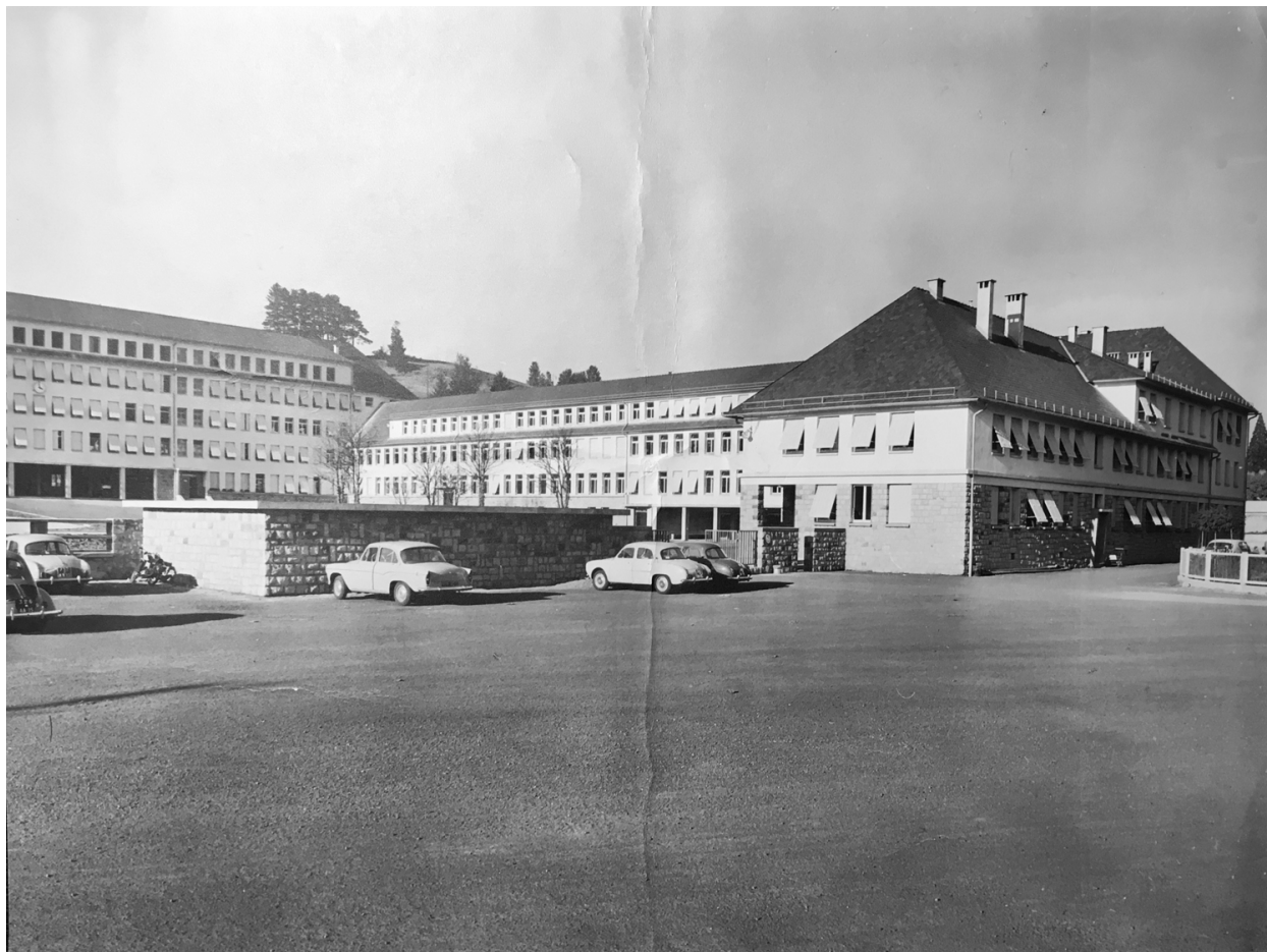
Vue partielle des bâtiments après achèvement des travaux, v. 1965 (AN, 19880466/45)