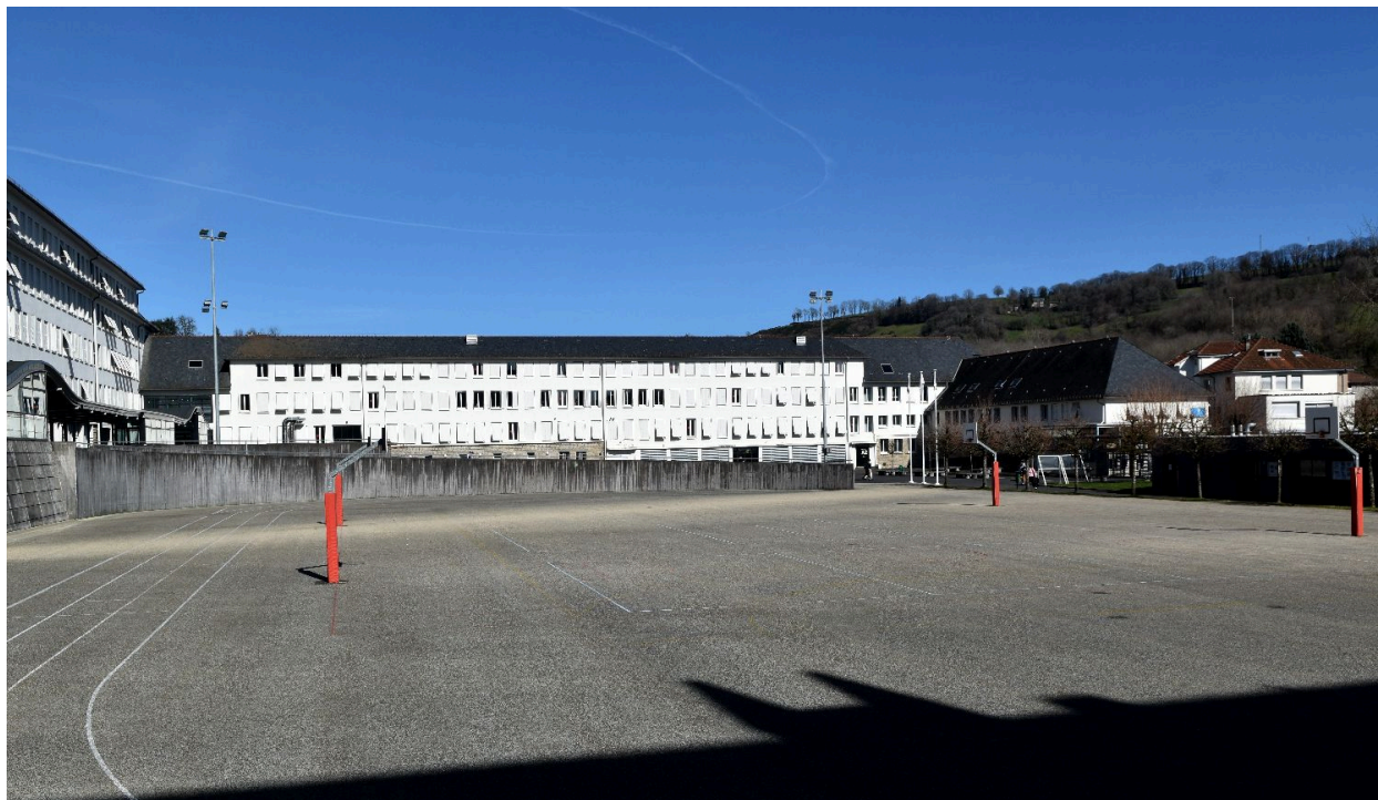
Vue de la cour principale, depuis le sud-ouest