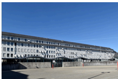
Bâtiment d'enseignement général nord-ouest