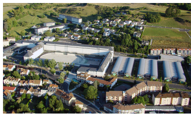
Vue aérienne IVR84_20231500034NUCA