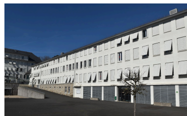
Bâtiment d'enseignement général nord-est IVR84_20241500039NUCA