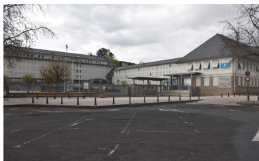
Vue d'ensemble depuis le sud-ouest IVR84_20231500118NUCA