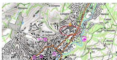
Plan de situation IVR84_20231500146NUDA