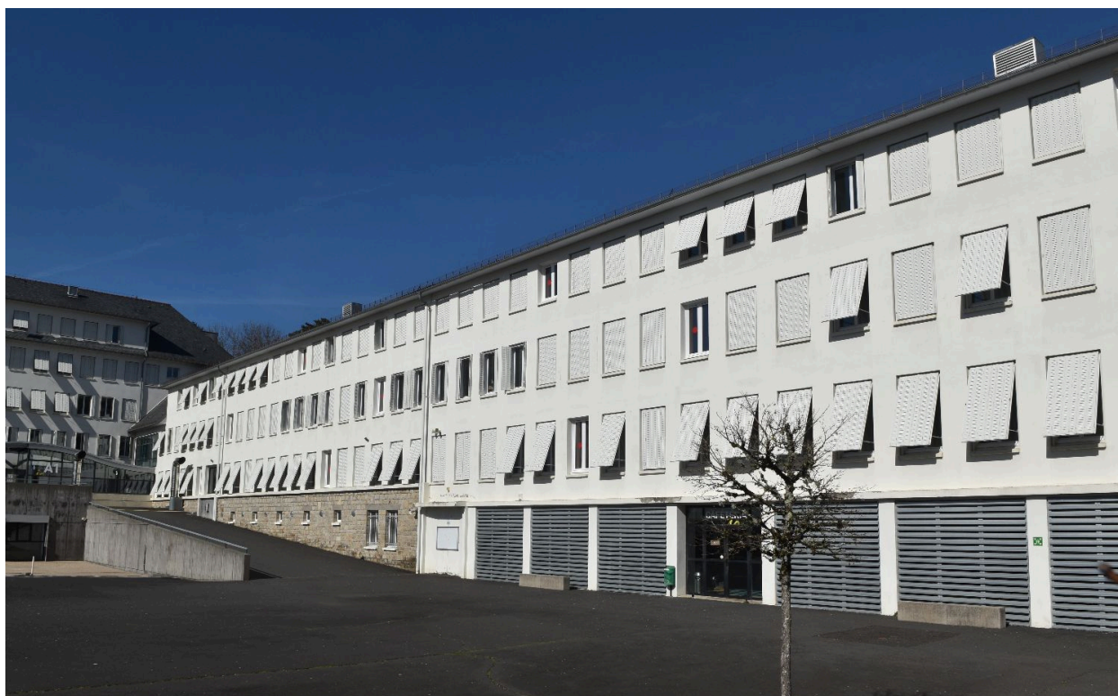
Bâtiment d'enseignement général nord-est