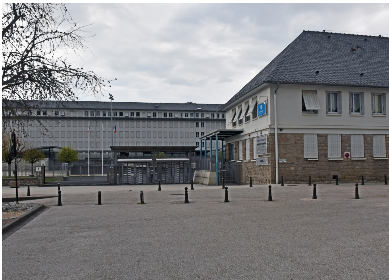
Vue de l'entrée