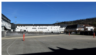
Vue de la cour principale, depuis le sud-ouest IVR84_20241500036NUCA