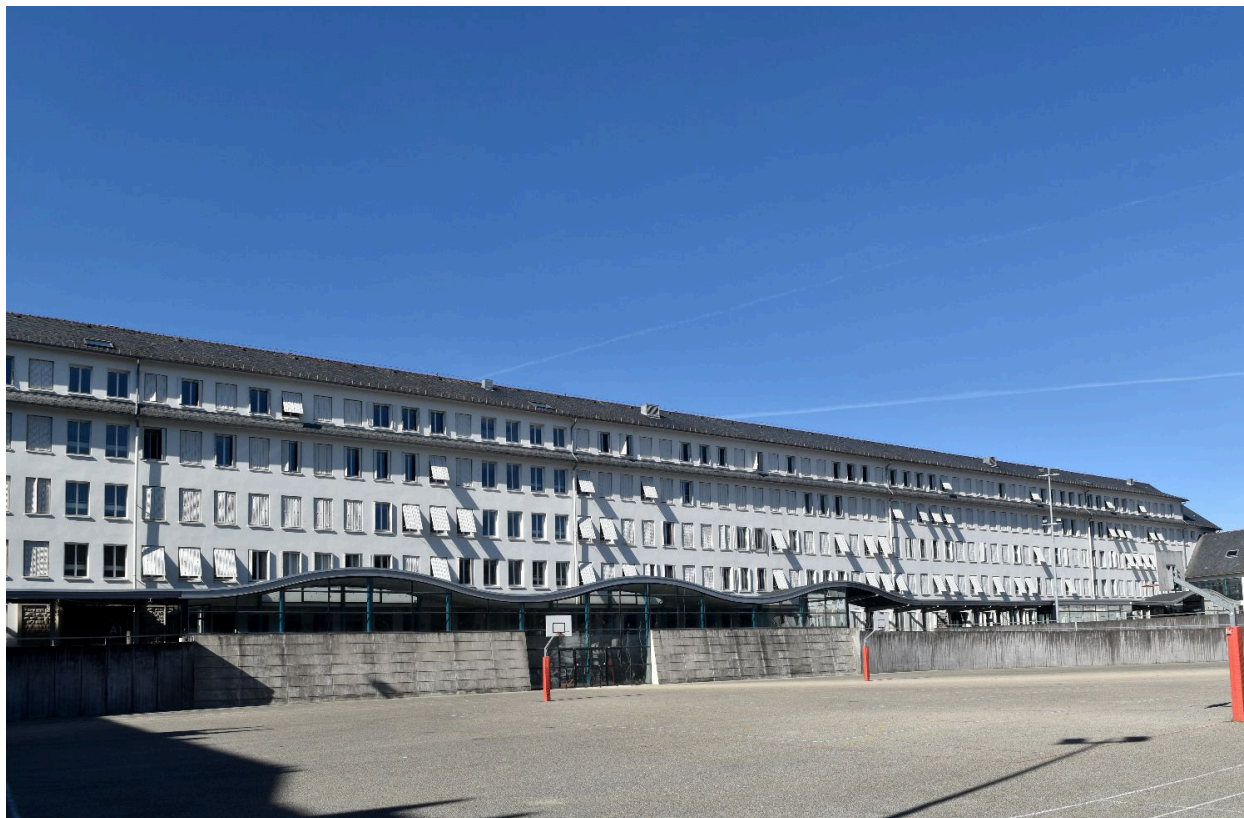
Bâtiment d'enseignement général nord-ouest