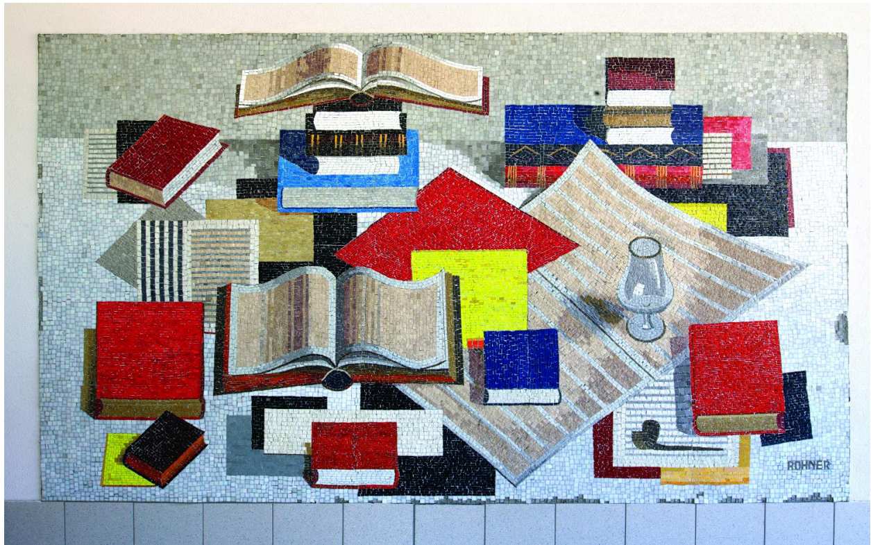
Nature morte aux livres (IM74000920), G. Rohner.