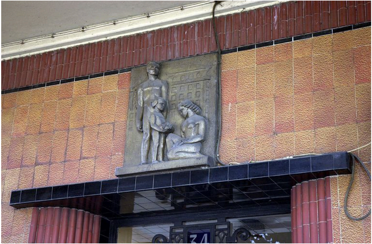
Détail du haut-relief ornant l'entrée au n° 34