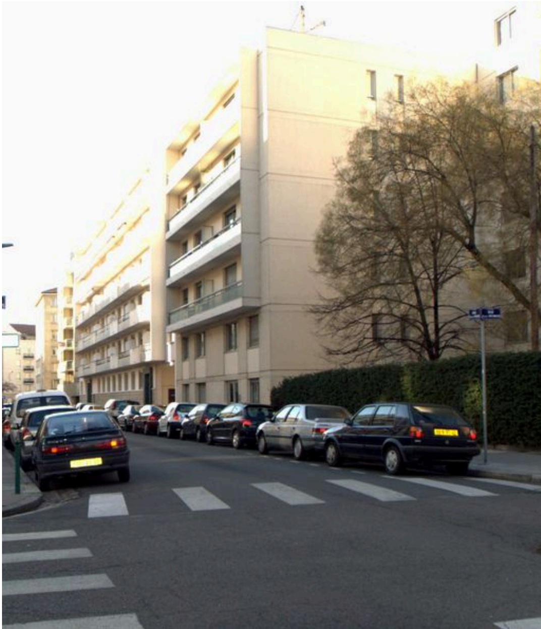
Vue générale depuis le nord