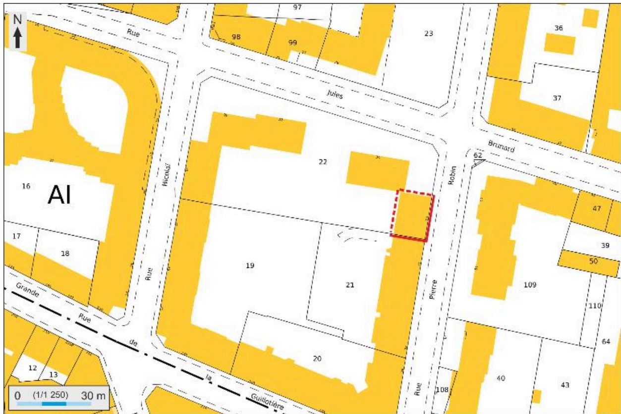
Plan masse et de situation, extrait de http://cadastre.gouv.fr