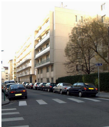
Vue générale depuis le nord IVR82_20116904142NUCA