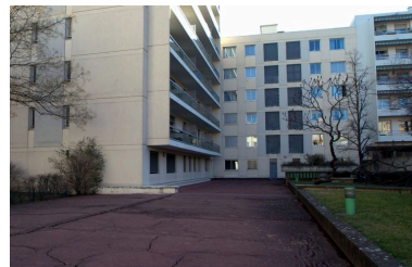
Elévation postérieure IVR82_20116904141NUCA