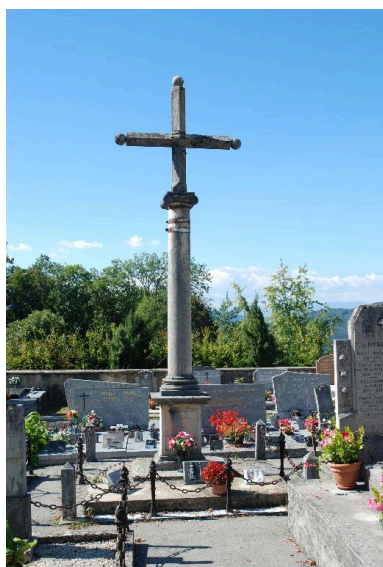
Vue d'ensemble. IVR84_20167304725NUCA