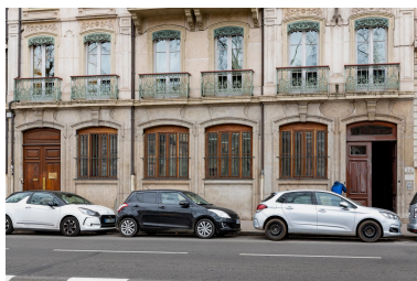
Le rez-de-chaussée et l'entresol quai Tilsitt