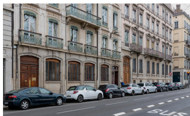
Rez-de-chaussée et entresol