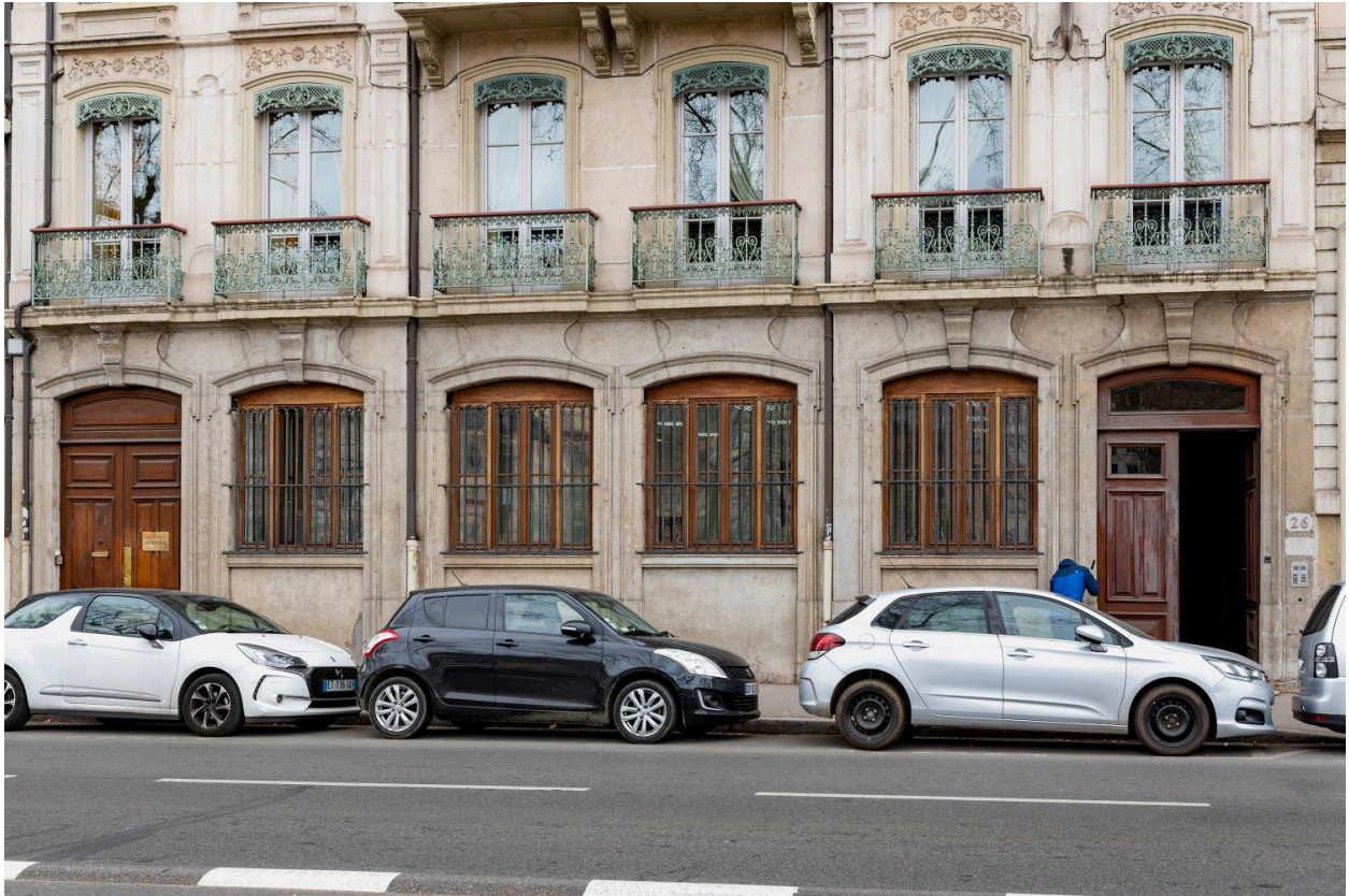
Le rez-de-chaussée et l'entresol quai Tilsitt