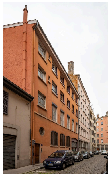
Elévation rue Guynemer IVR84_20216900384NUCA