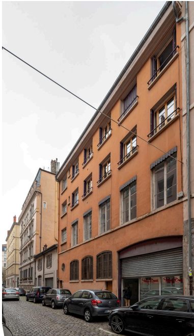
Elévation rue Guynemer