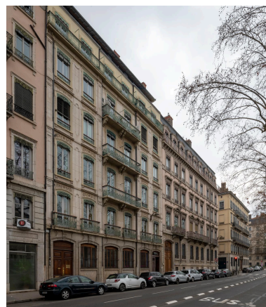
Elévation antérieure, 26 quai Tilsitt IVR84_20216900388NUCA

Corniches, rosaces en staff : projet de plaque pour l'entreprise Vitet et Charbonnel, version 2, Autr. Maison Bonioli puis Labranche, puis Luppivet, puis P. Vitet successeur, puis Vitet-Charbonnel, puis Charbonnel IVR84_20206900978NUCA