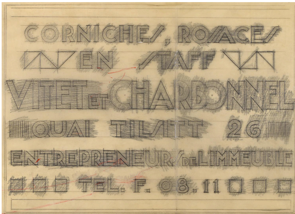
Corniches, rosaces en staff : projet de plaque pour l'entreprise Vitet et Charbonnel, version 2