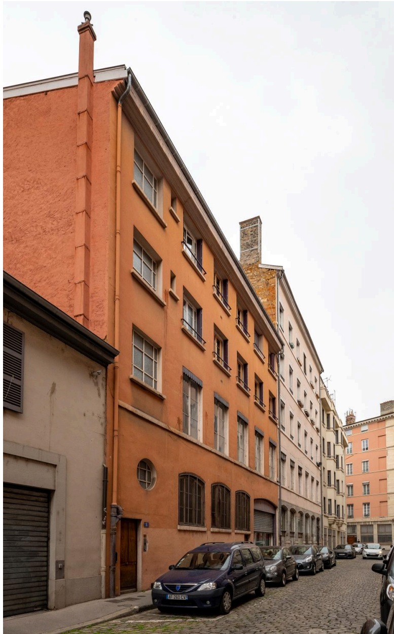
Elévation rue Guynemer