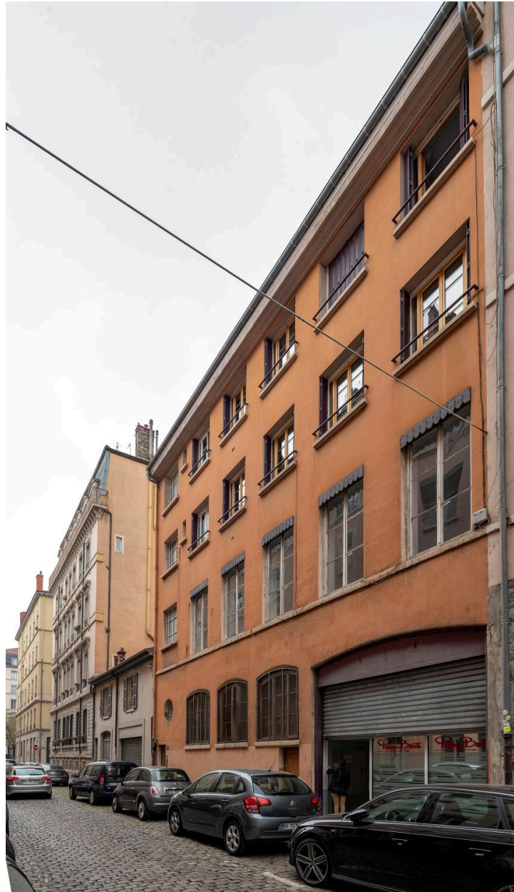
Elévation rue Guynemer