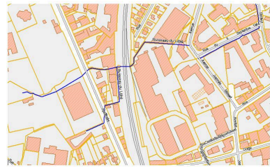
Ruisseau souterrain à Vaise : localisation du ruisseau du Littre IVR84_20246901158NUCA