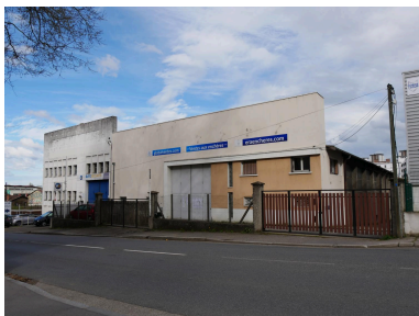
Vue d'ensemble du centre de contrôle à Vaise IVR84_20246900653NUCA