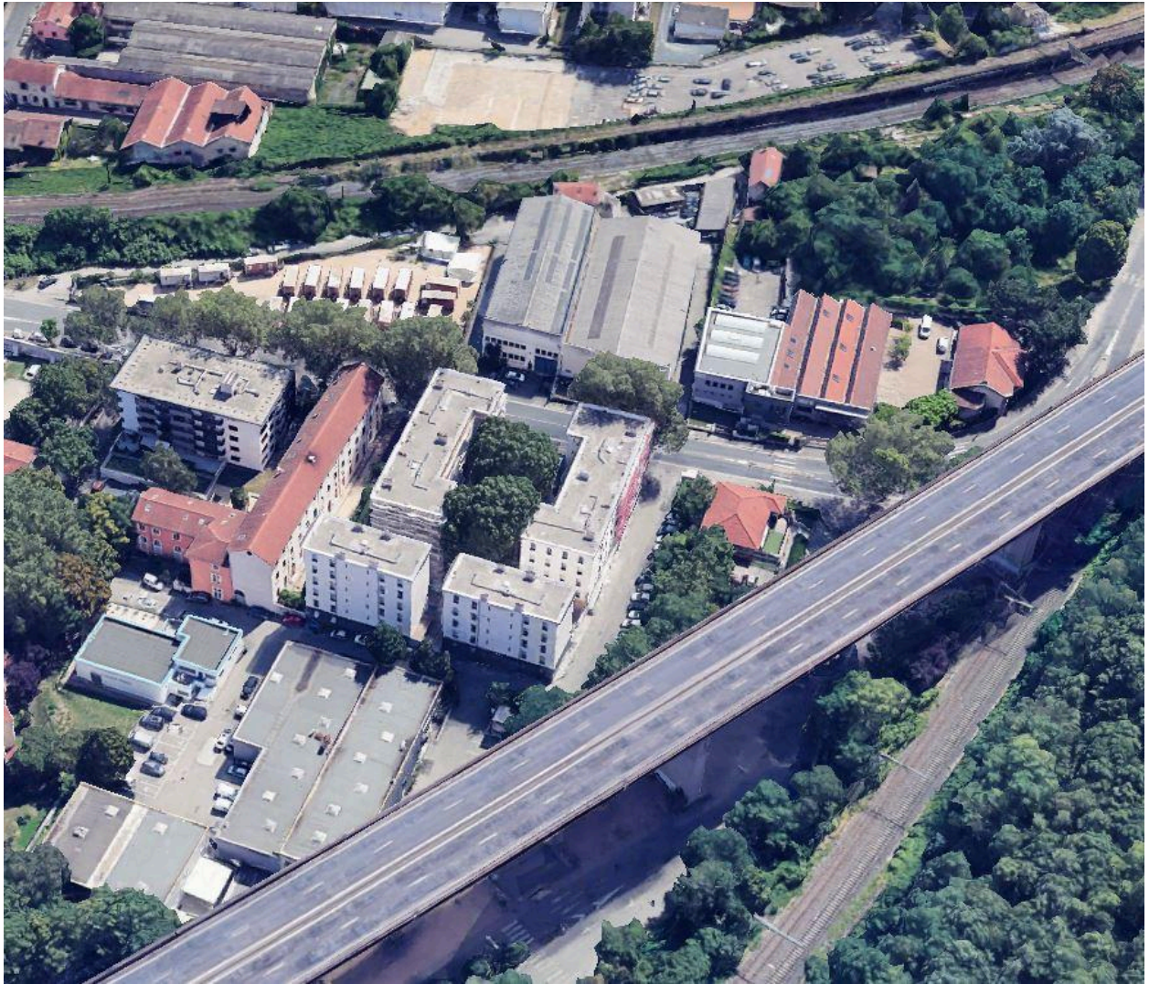
Vue d'ensemble rue Sidoine Apollinaire