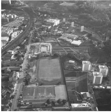
Rue Sidoine Apollinaire fin des années 1960 (la piscine de Vaise est en cours de construction et inaugurée en 1968) IVR84_20246901156NUCA