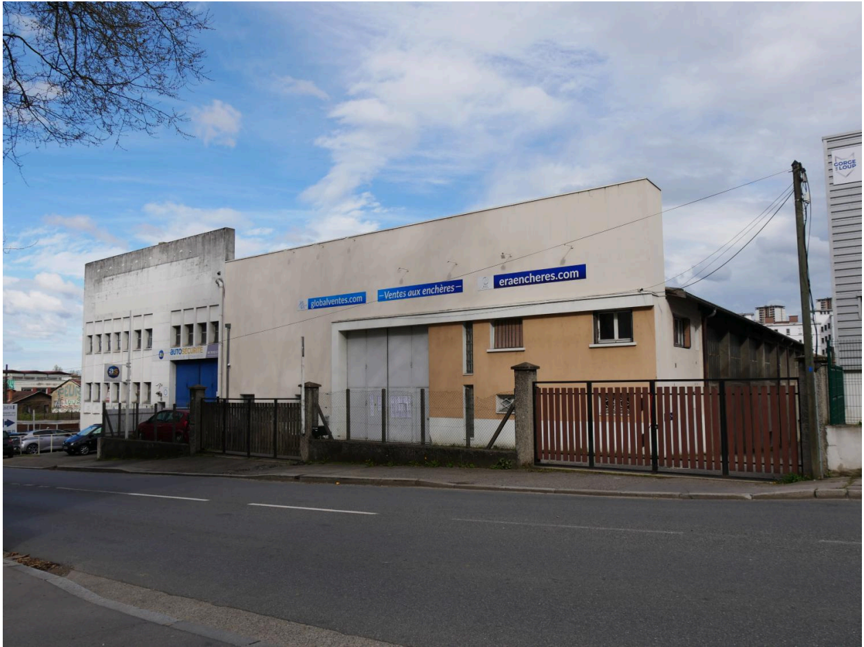
Vue d'ensemble du centre de contrôle à Vaise