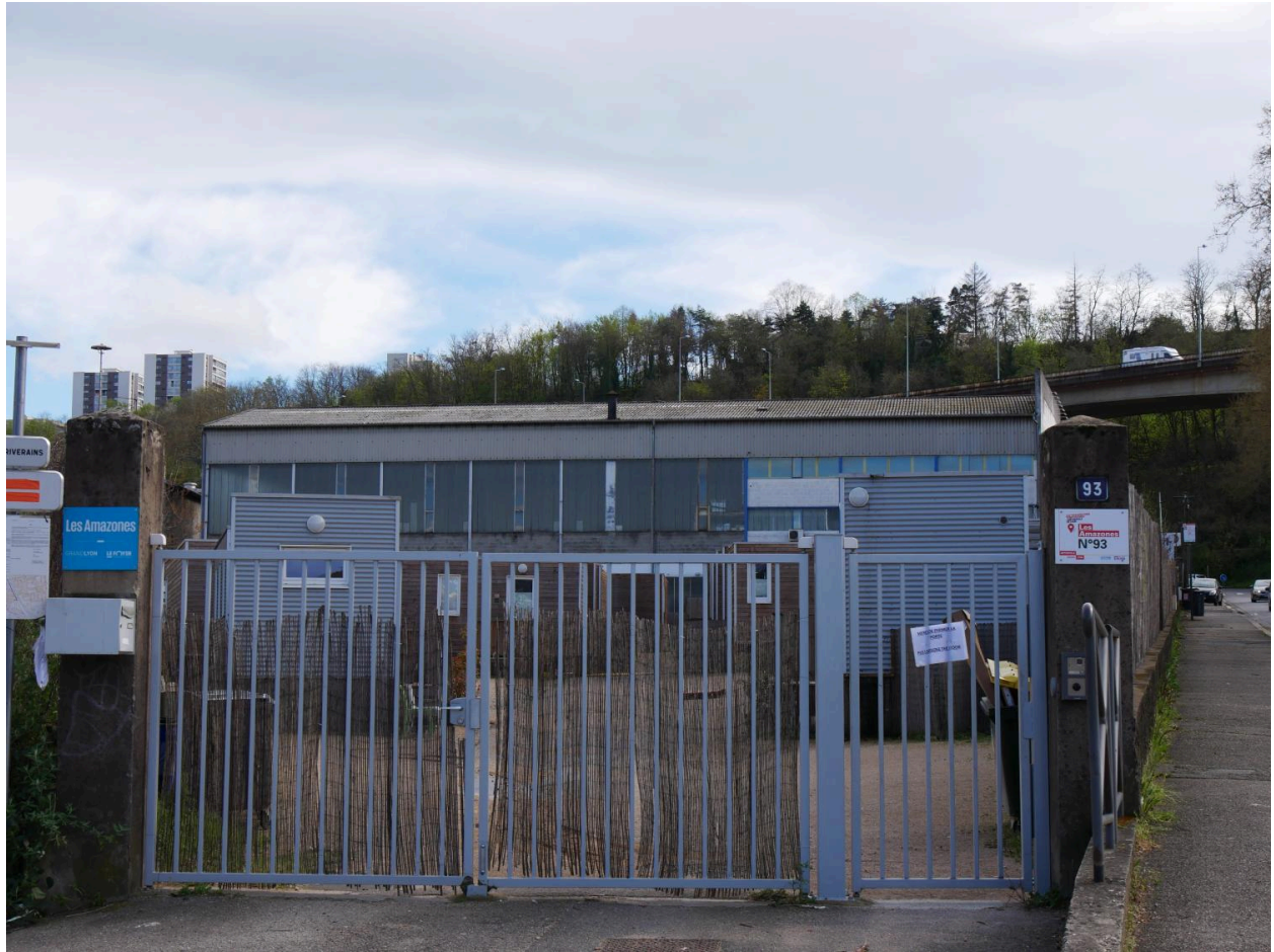
Vue ouest d'ensemble du site