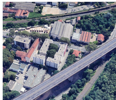
Vue d'ensemble rue Sidoine Apollinaire (vue Google) IVR84_20246900663NUCA