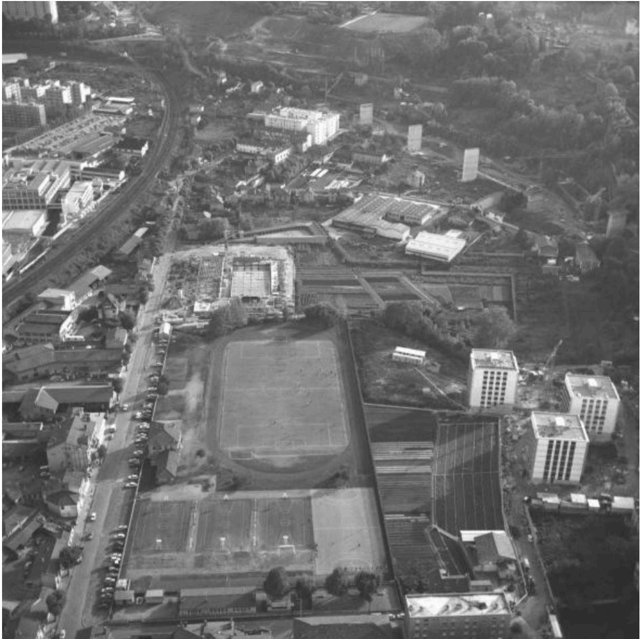
Rue Sidoine Apollinaire fin des années 1960 (la piscine de Vaise est en cours de construction et inaugurée en 1968)