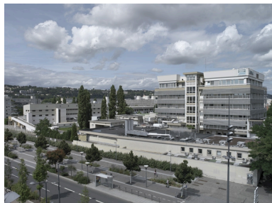
Vue d'ensemble sud