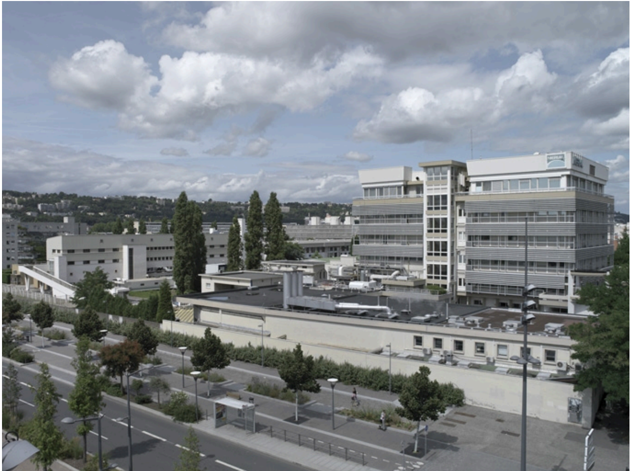
Vue d'ensemble sud