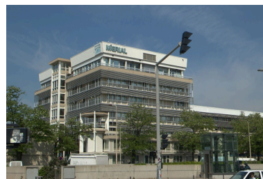
Vue sud-ouest du bâtiment principal IVR82_20086900452NUCA