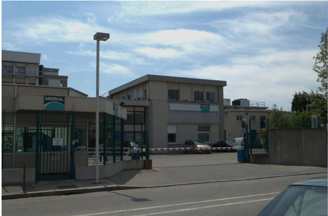
Entrée 4 rue du Vercors