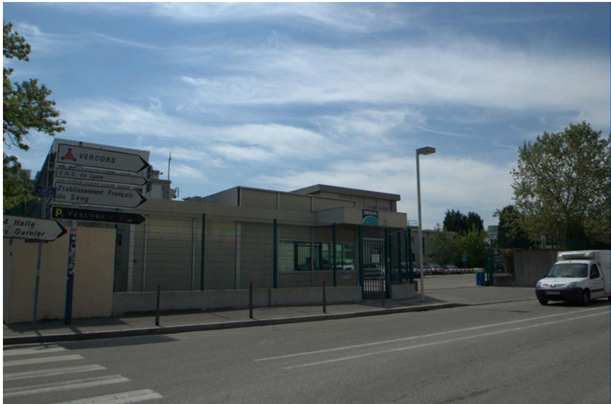
Vue est, rue du Vercors