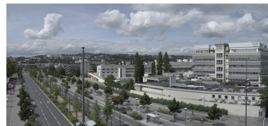
Vue d'ensemble sud-est