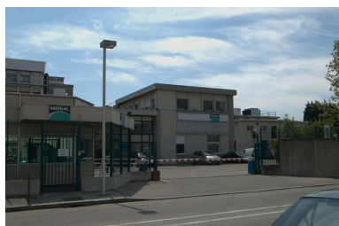
Entrée 4 rue du Vercors IVR82_20086900456NUCA