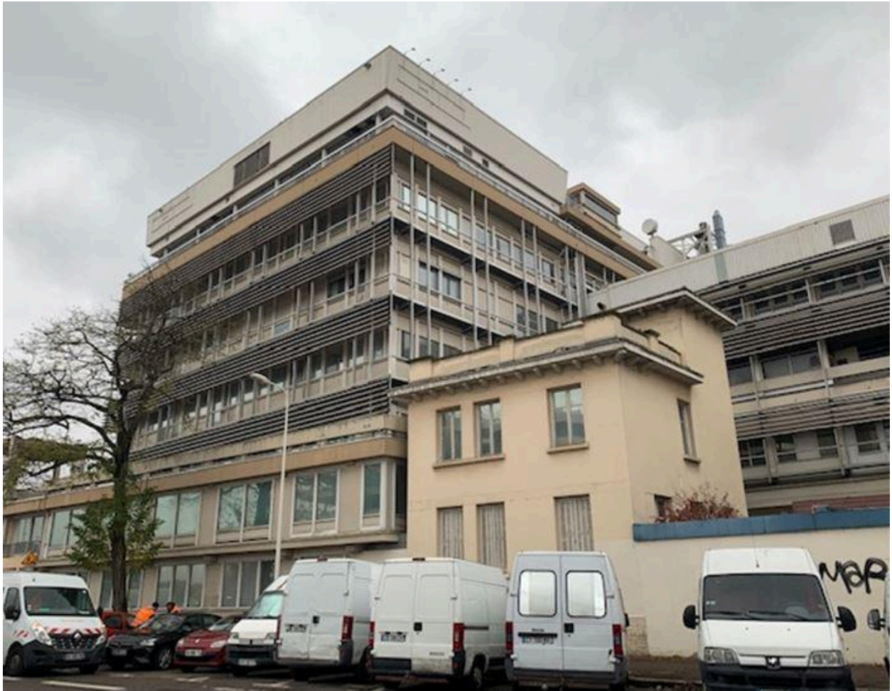
Petit bâtiment attribué à Tony Garnier (vers 1908-1910) architecte