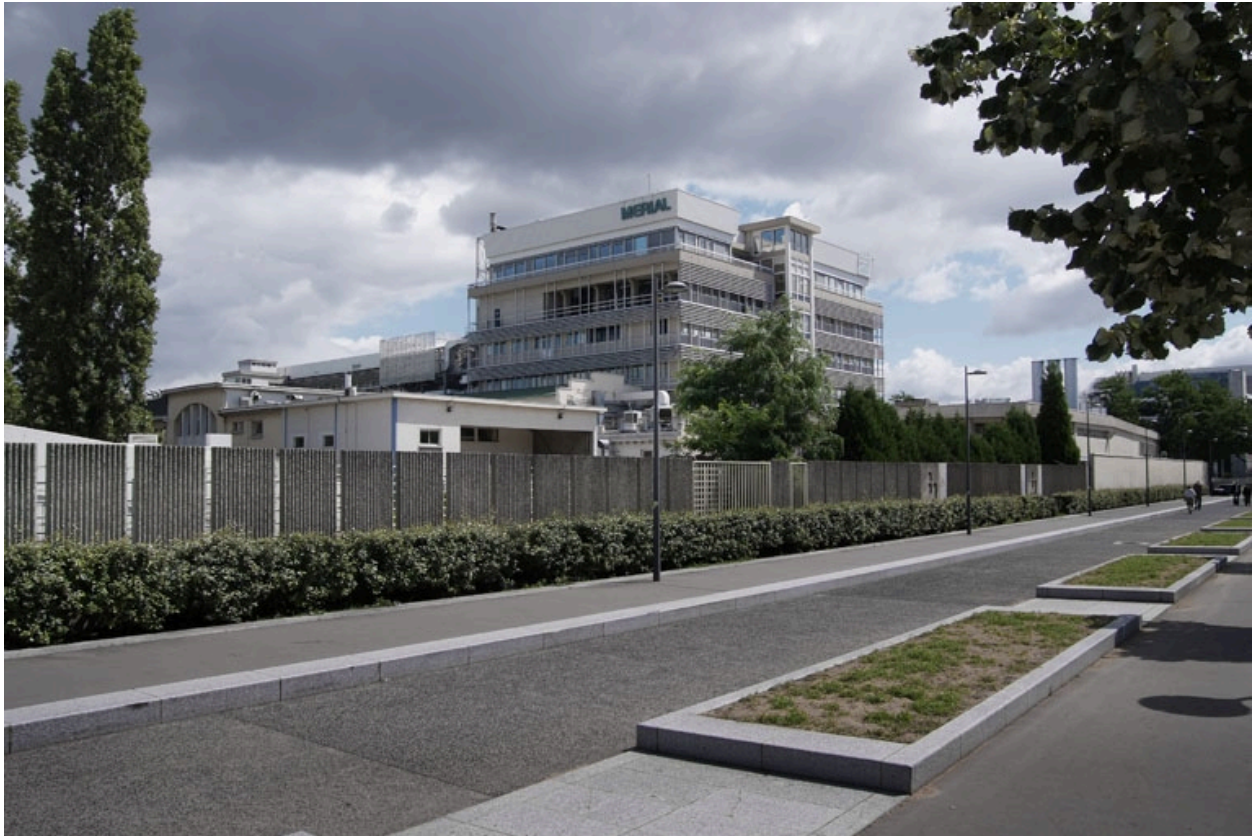
Vue générale sud-ouest