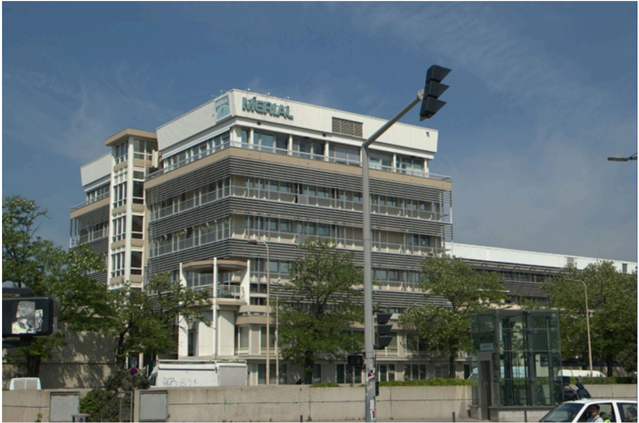
Vue sud-ouest du bâtiment principal