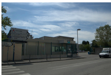
Vue est, rue du Vercors IVR82_20086900457NUCA