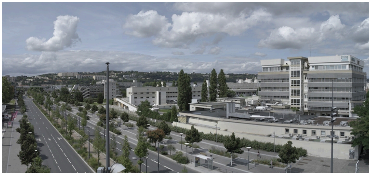
Vue d'ensemble sud-est