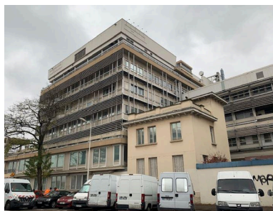
Petit bâtiment attribué à Tony Garnier (vers 1908-1910) architecte IVR84_20186901445NUCA