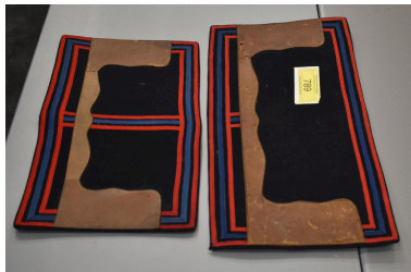
Vue d'un des petits tapis et du moyen IVR84_20226303406NUC4A