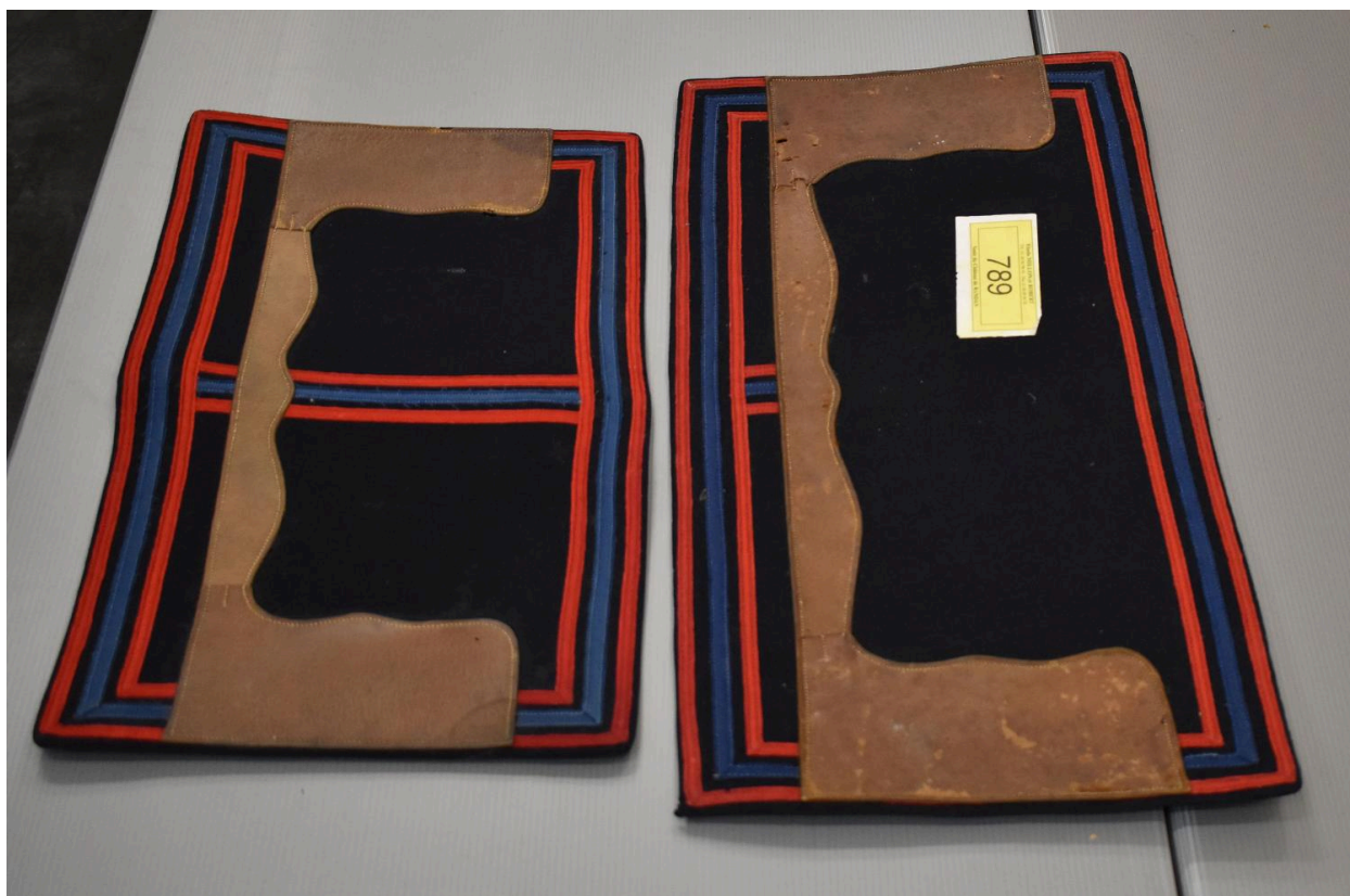
Vue d'un des petits tapis et du moyen