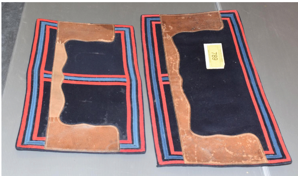
Vue d'un des petits tapis et du moyen