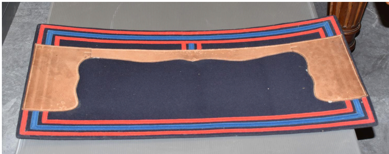
Vue d'un des grands tapis