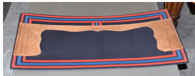
Vue d'un des grands tapis IVR84_20226303405NUC4A