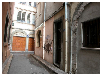
Façade sur la rue Valfenière, rez-de-chaussée IVR82_20046900299NUCA