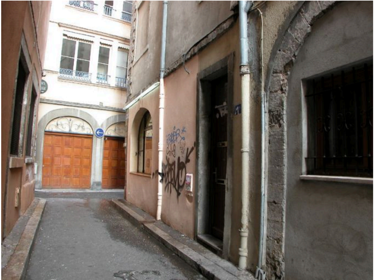
Façade sur la rue Valfenière, rez-de-chaussée