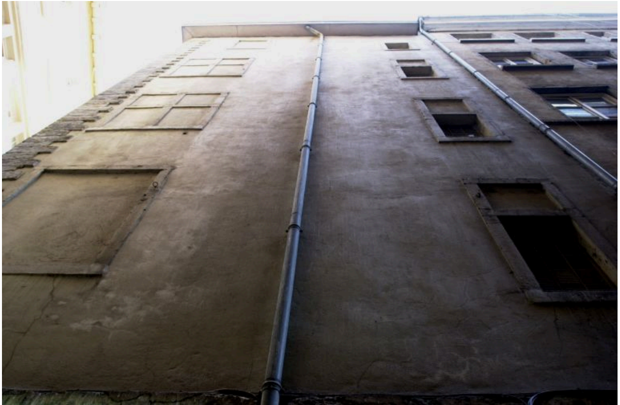
Façade rue Valfenière, vue générale des étages