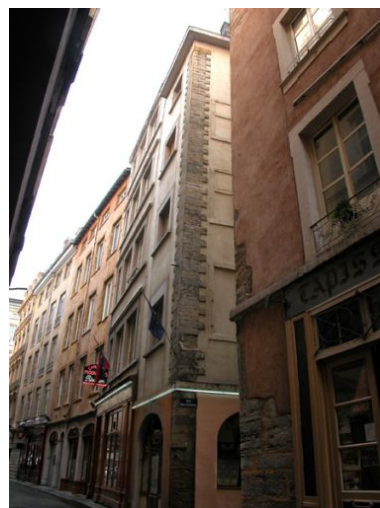
Angle des deux façades, niveaux 2 à 5 IVR82_20036901065NUCA