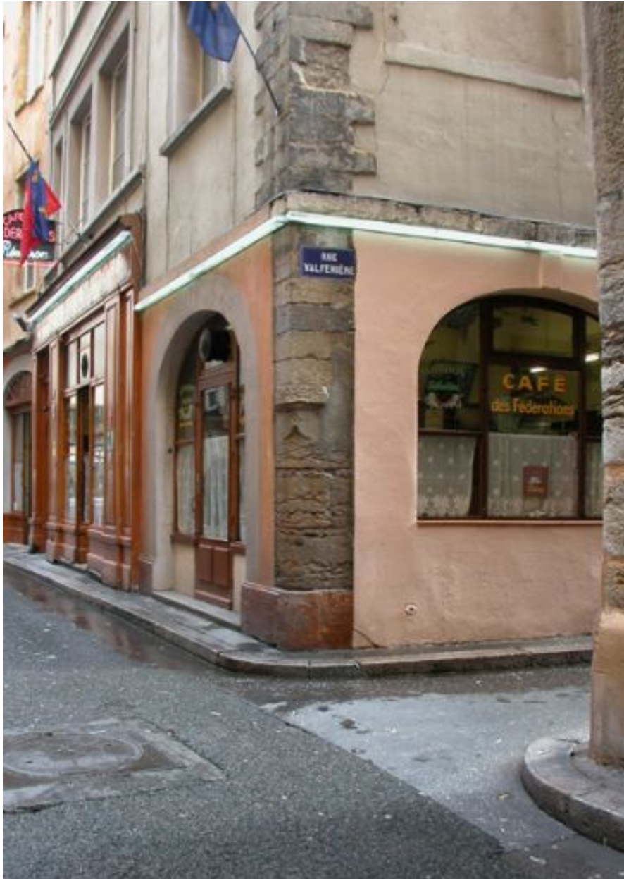
Angle des deux façades, premier niveau