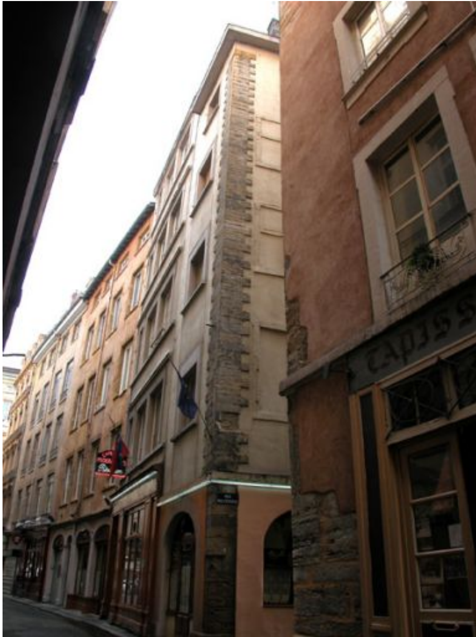
Angle des deux façades, niveaux 2 à 5