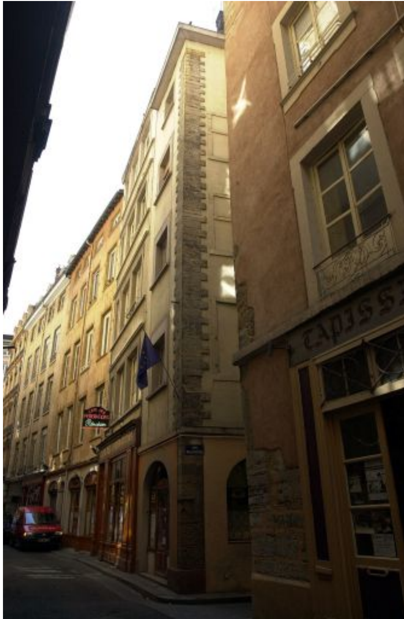
Angle des deux façades