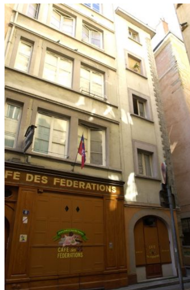
Façade sur la rue Major-Martin IVR82_20036901057NUCA