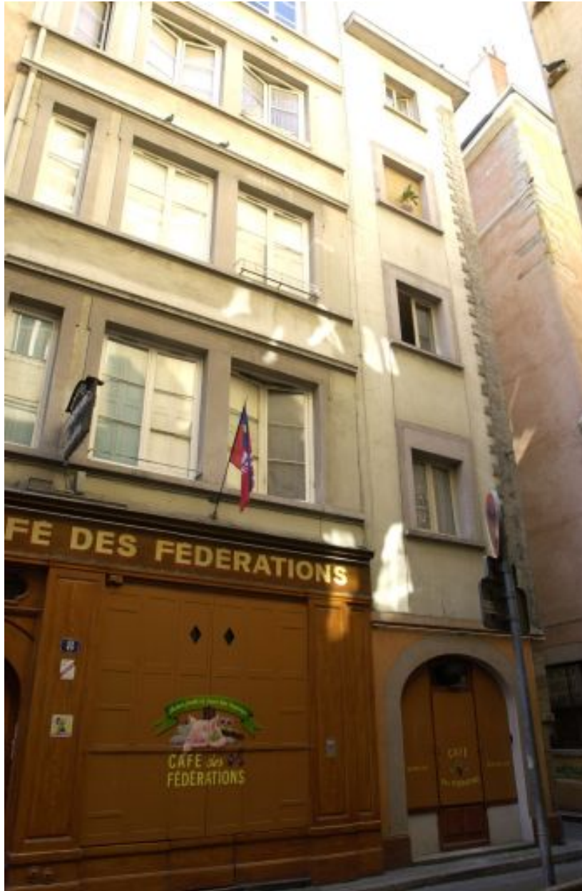
Façade sur la rue Major-Martin