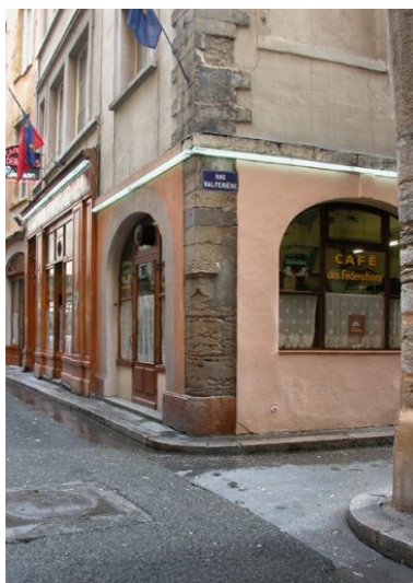
Angle des deux façades, premier niveau IVR82_20036901064NUCA