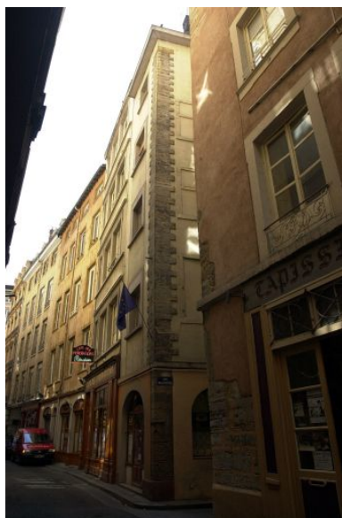
Angle des deux façades IVR82_20036901254NUCA