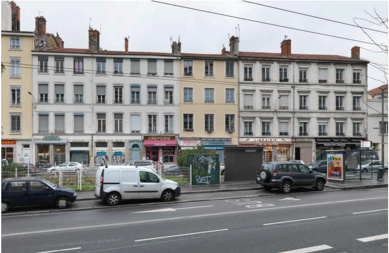
Vue de situation (au centre), dans l'alignement des façades de la rue Saint-Jérôme