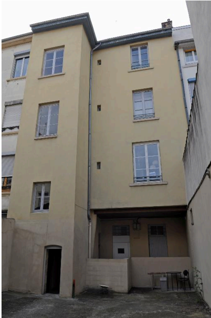
Elévation sur cour