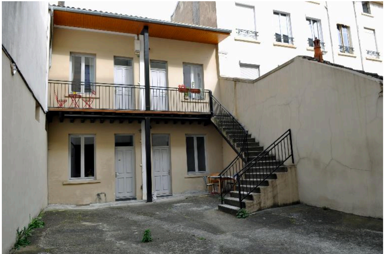
Vue du bâtiment sur cour