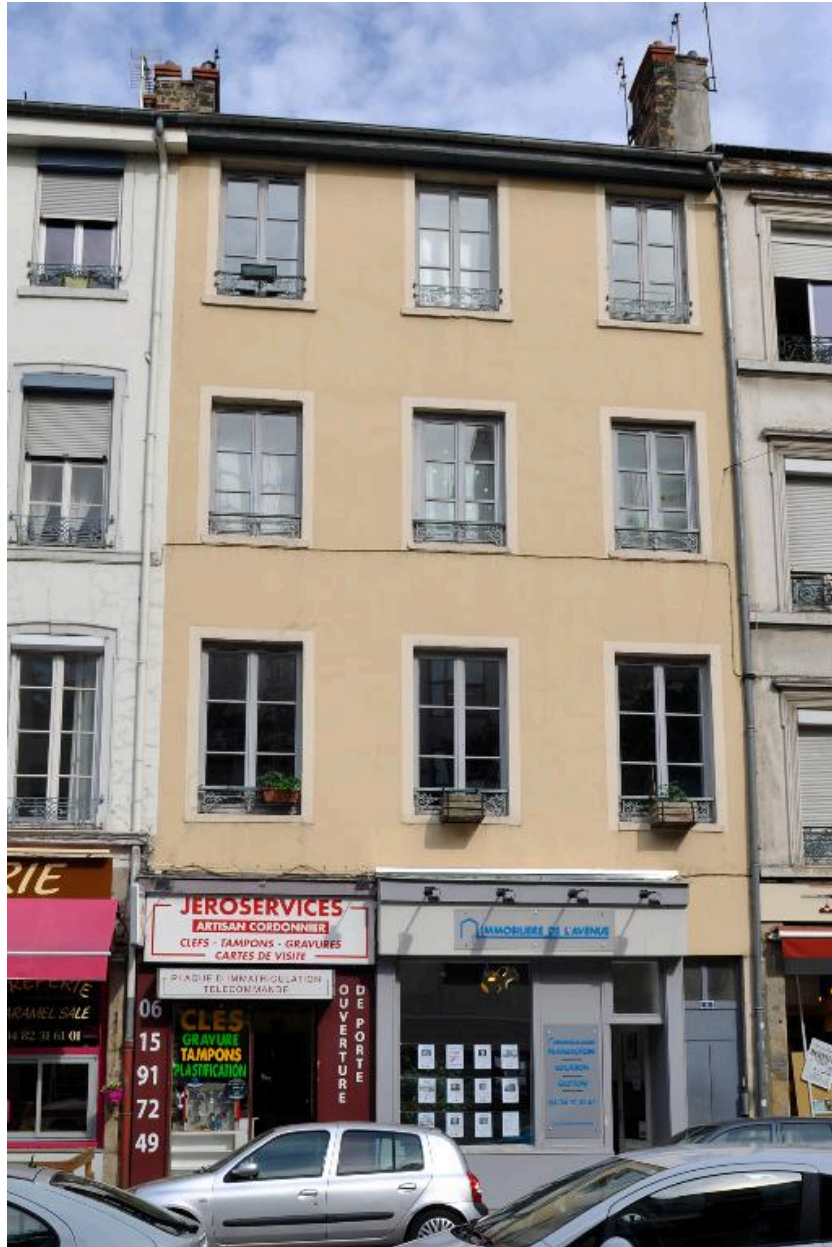
Elévation sur rue