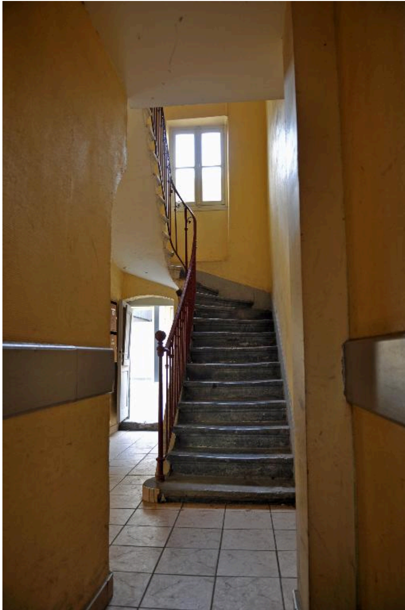
Vue intérieure : le départ de l'escalier