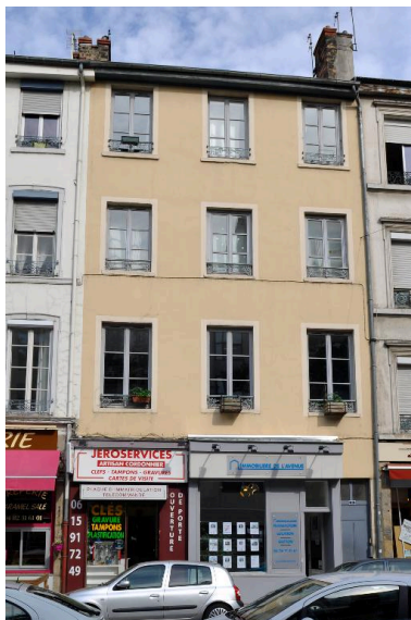
Elévation sur rue IVR84_20176901332NUCA