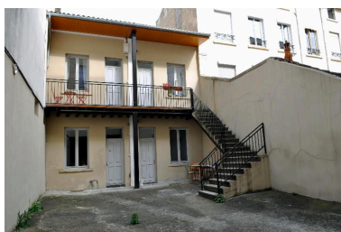
Vue du bâtiment sur cour IVR84_20176901334NUCA