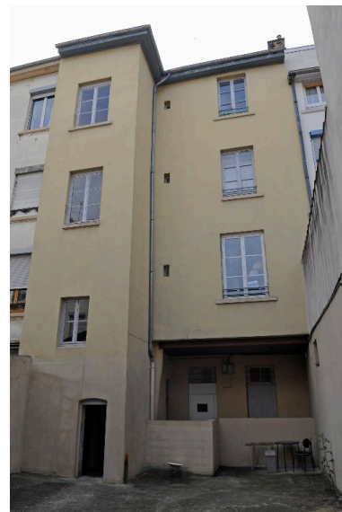
Elévation sur cour IVR84_20176901333NUCA