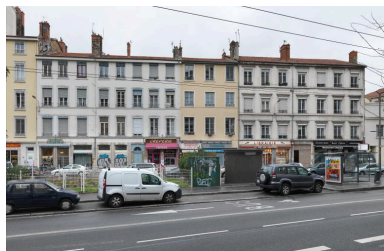
Vue de situation (au centre), dans l'alignement des façades de la rue Saint-Jérôme