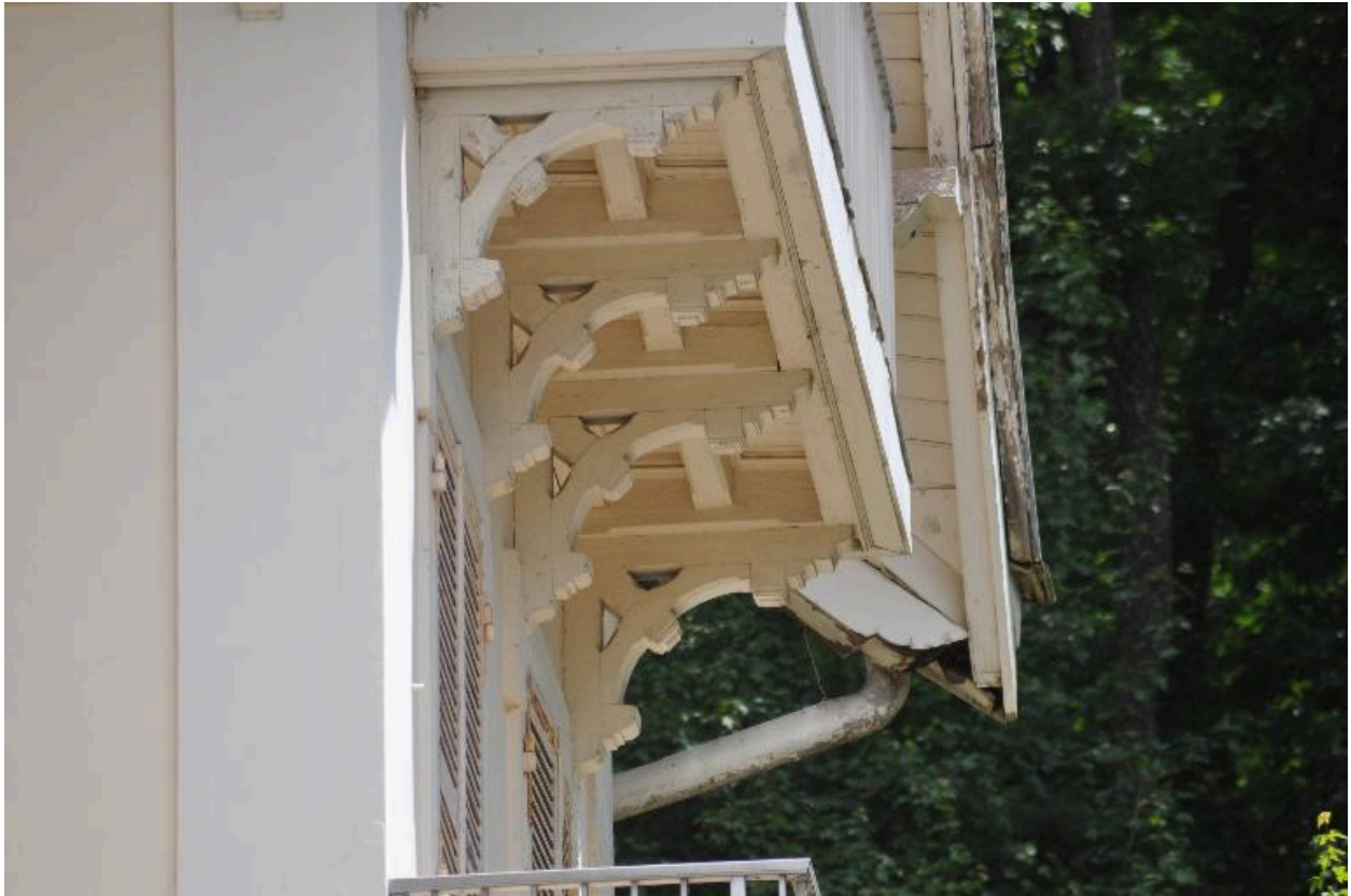
Aisseliers en bois supportant un balcon