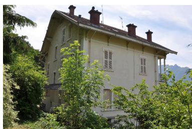
Elévations postérieure et latérale gauche (façade est et nord) IVR82_20137300428NUCA