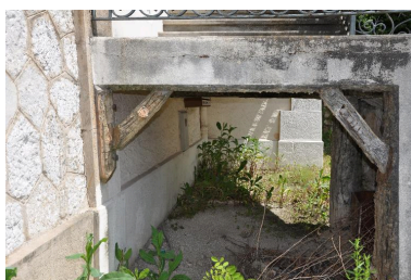
Aisseliers en rocaille supportant l'escalier extérieur IVR82_20137300423NUCA