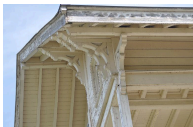
Aisseliers en bois sous l'avant-toit IVR82_20137300426NUCA