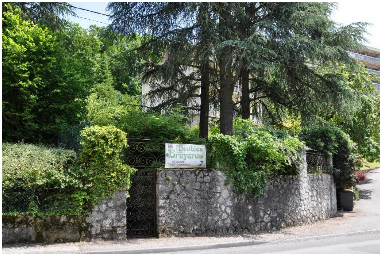
Mur de soutènement et portail d'entrée donnant sur le boulevard