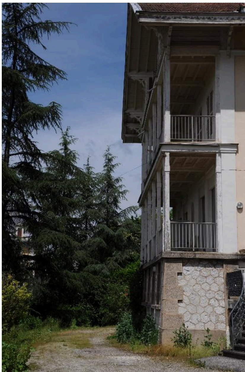
Détail de l'étage de soubassement et des balcons-loggias sur la façade principale