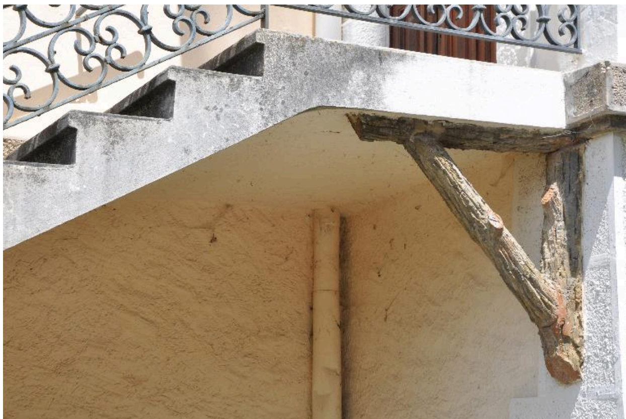
Aisselier en rocaille supportant l'escalier extérieur