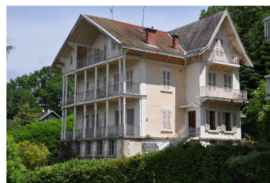
Vue de trois-quart droit IVR82_20137300419NUCA