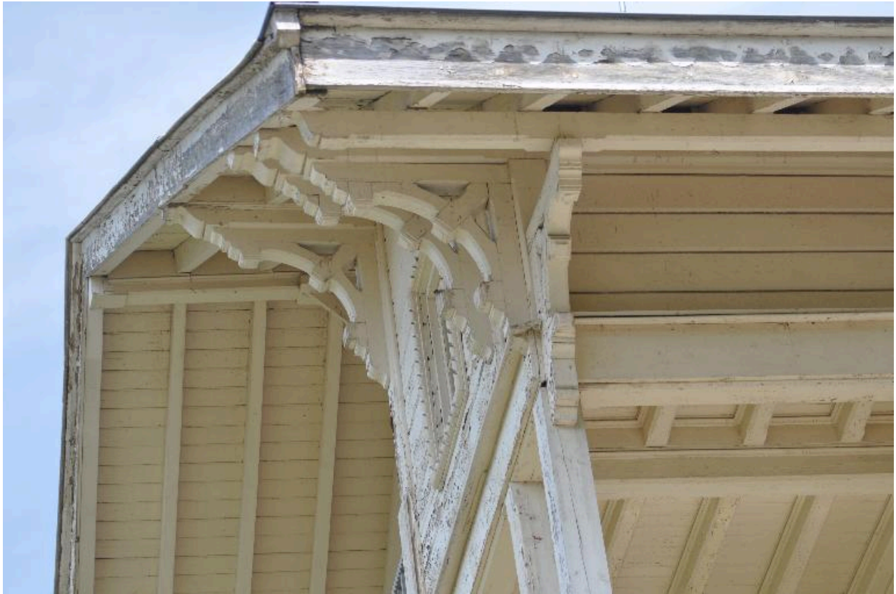
Aisseliers en bois sous l'avant-toit