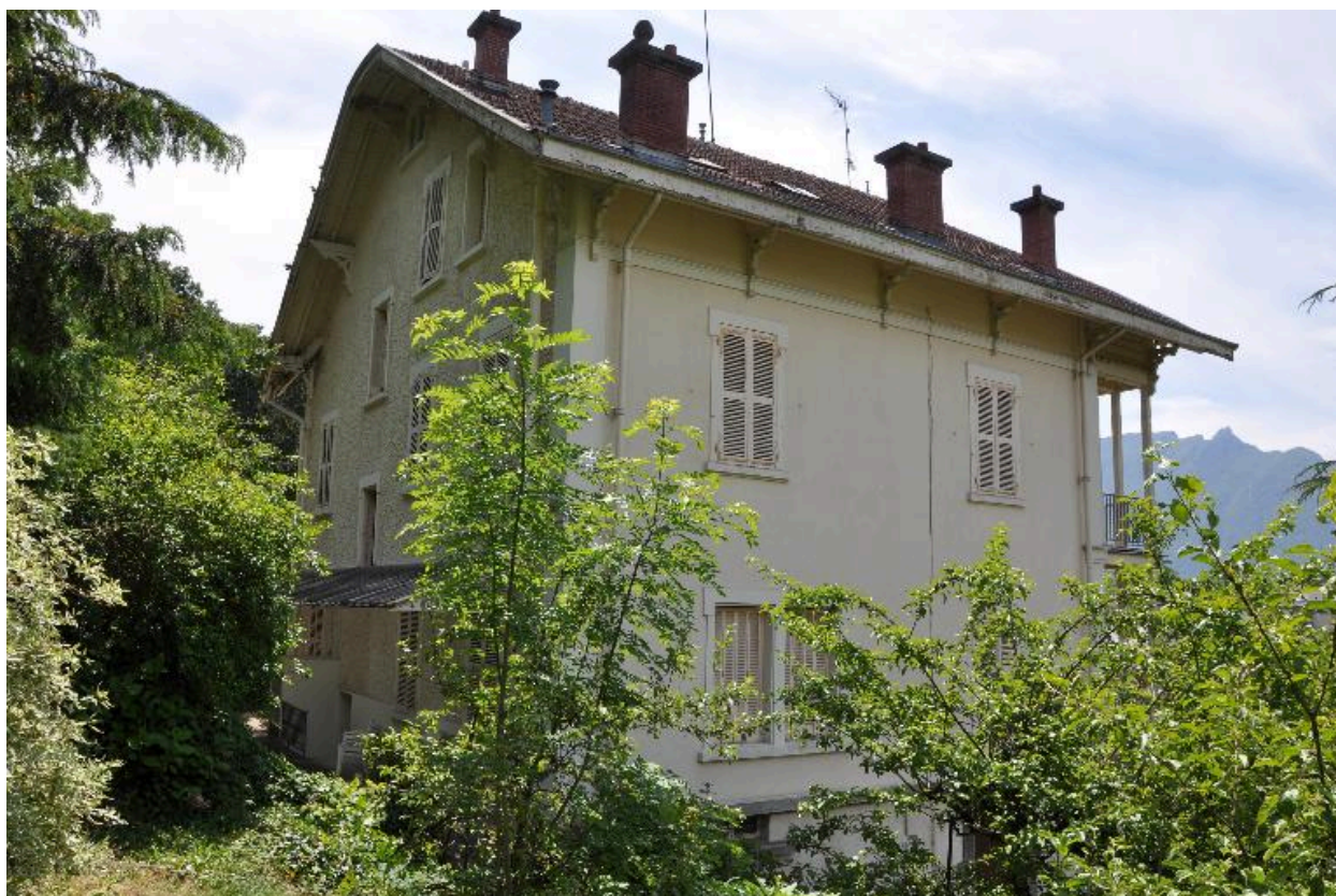
Elévations postérieure et latérale gauche (façade est et nord)