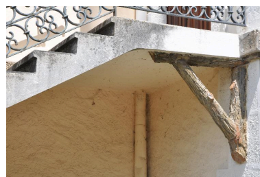
Aisselier en rocaille supportant l'escalier extérieur