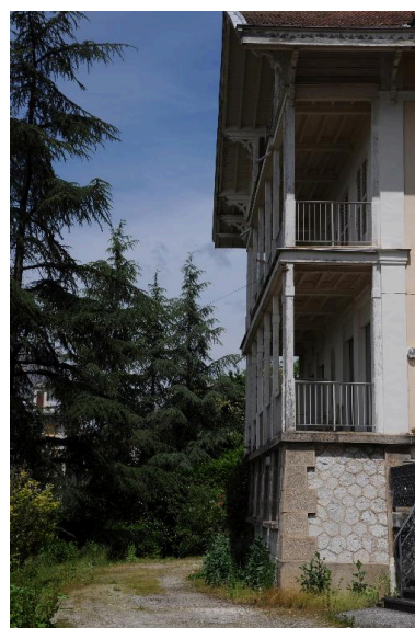
Détail de l'étage de soubassement et des balcons-loggias sur la façade principale