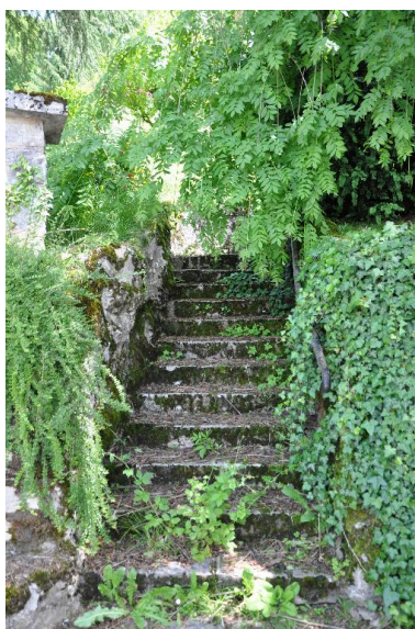
Escalier parcourant le jardin