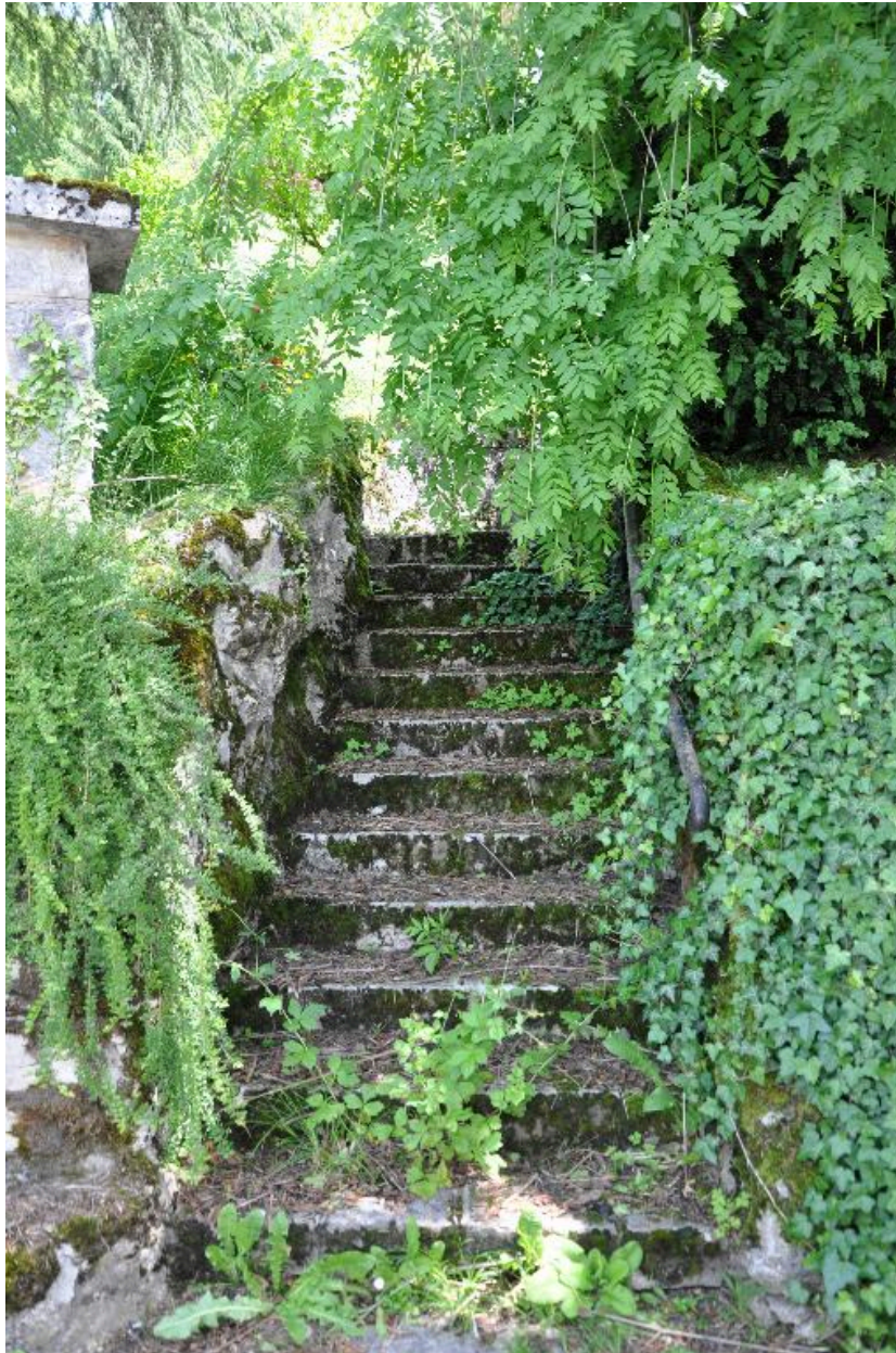
Escalier parcourant le jardin