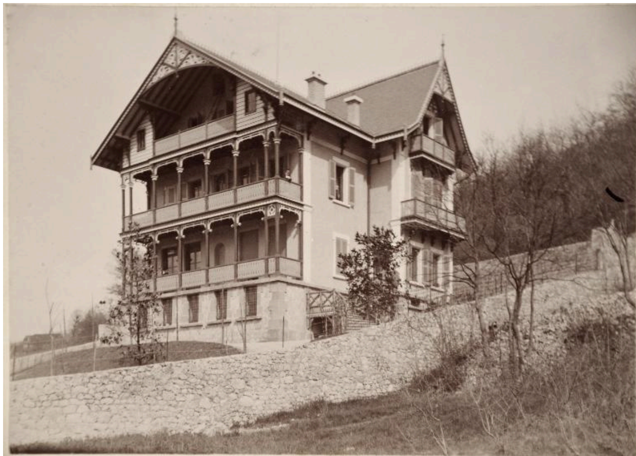
La villa, vers 1900