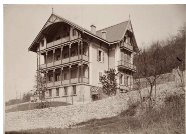
La villa, vers 1900