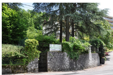
Mur de soutènement et portail d'entrée donnant sur le boulevard IVR82_20137300431NUCA