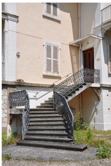
Escalier et porte d'entrée IVR82_20137300427NUCA