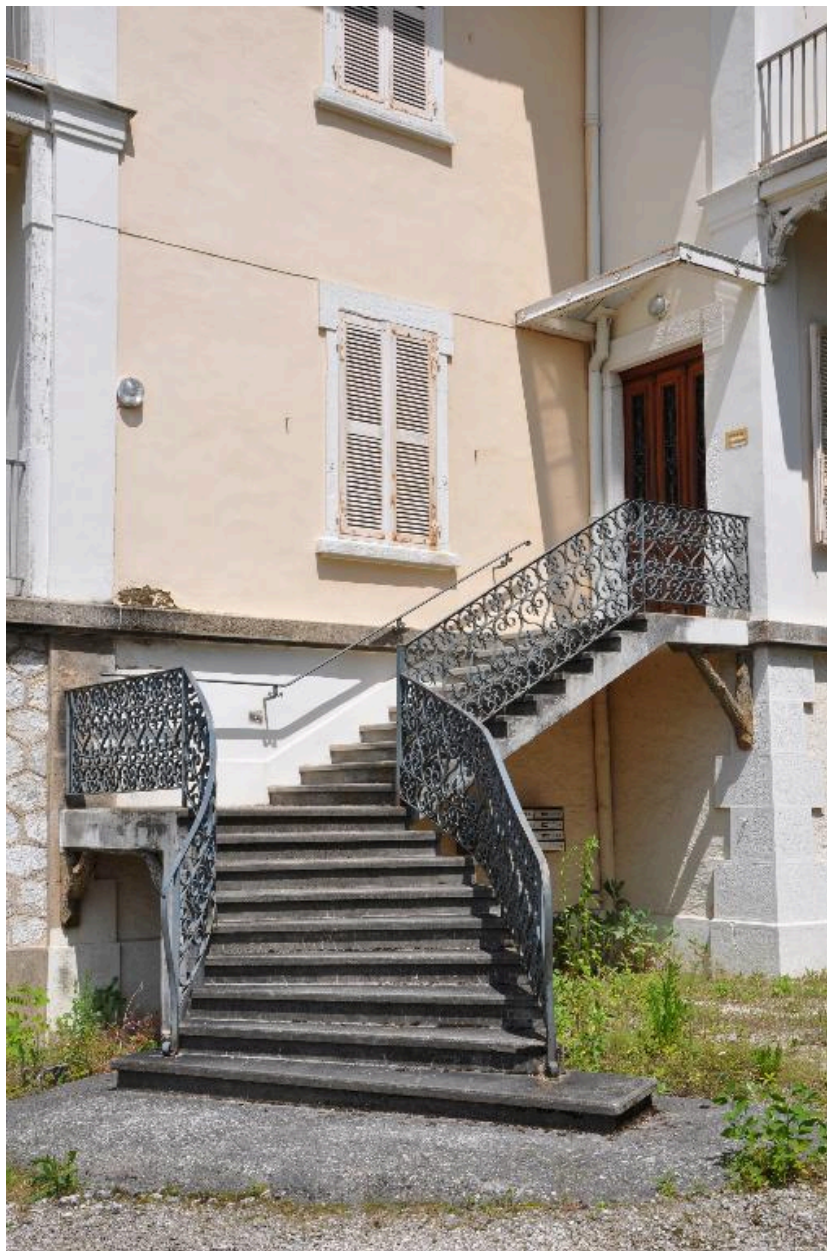
Escalier et porte d'entrée