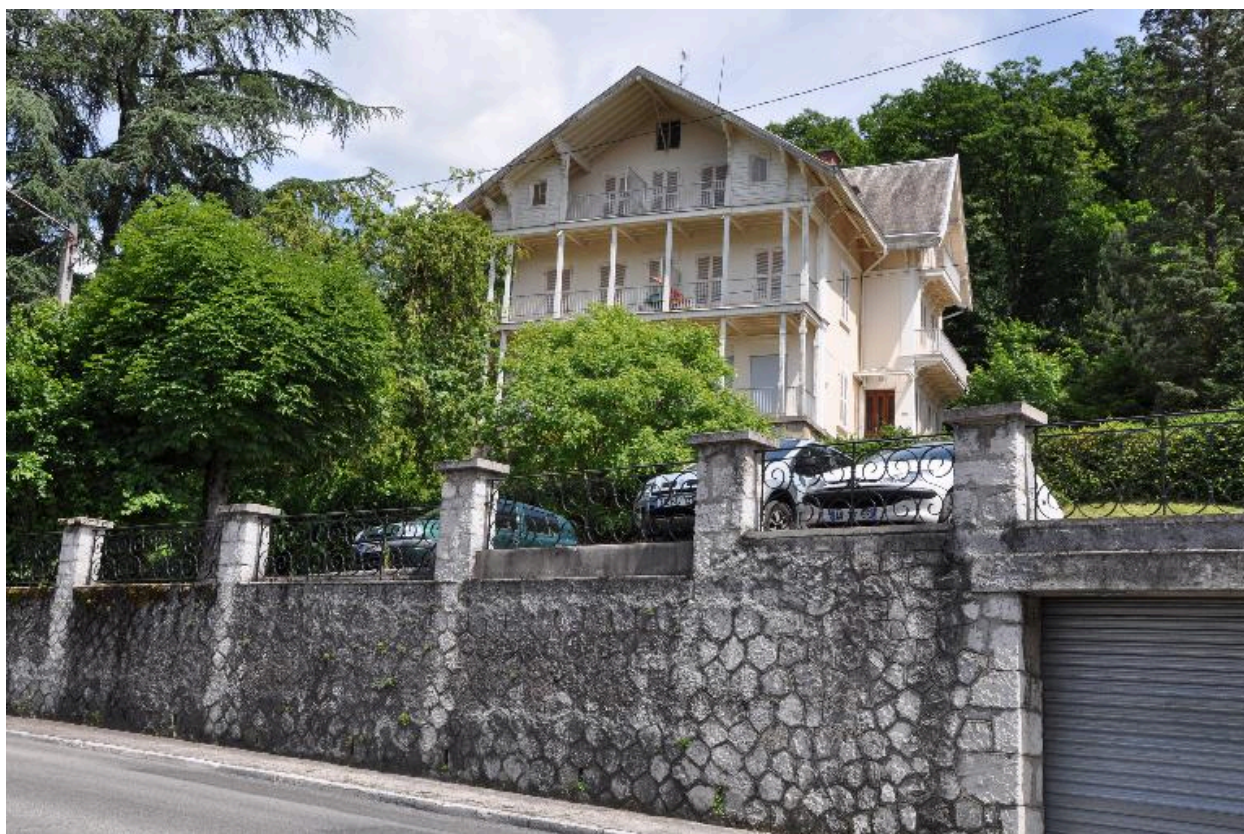
Vue d'ensemble depuis le boulevard de la Roche-du-Roi