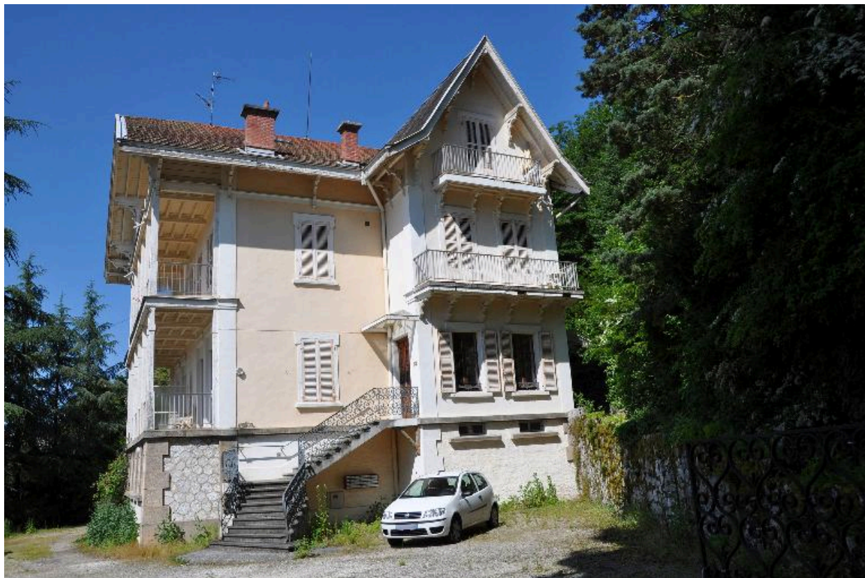
Elévation latérale droite (façade sud)