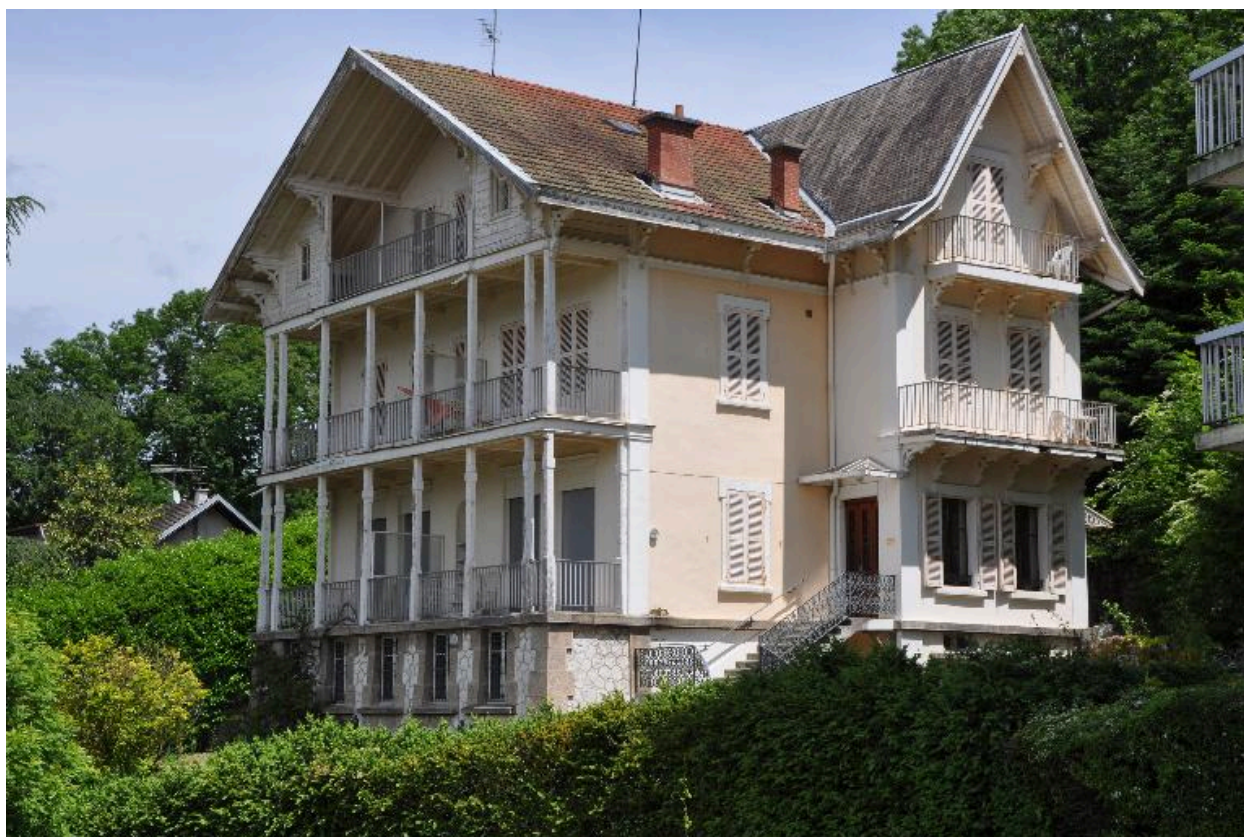
Vue de trois-quart droit