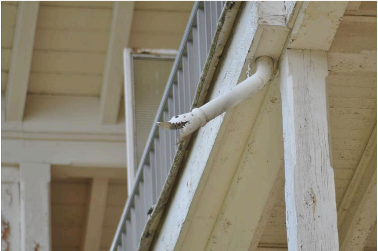
Détail d'une gouttière