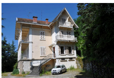
Elévation latérale droite (façade sud)