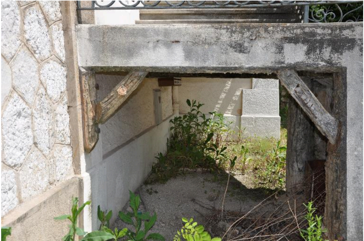
Aisseliers en rocaille supportant l'escalier extérieur