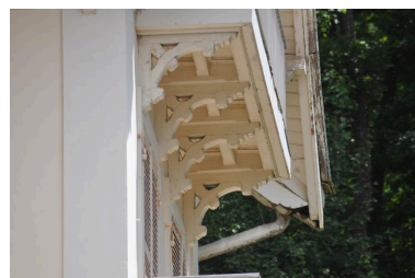
Aisseliers en bois supportant un balcon IVR82_20137300420NUCA