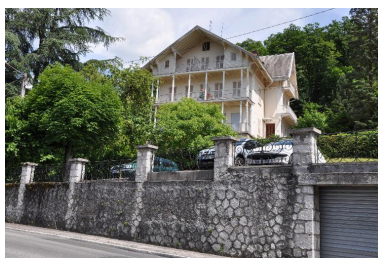
Vue d'ensemble depuis le boulevard de la Roche-du-Roi IVR82_20137300430NUCA