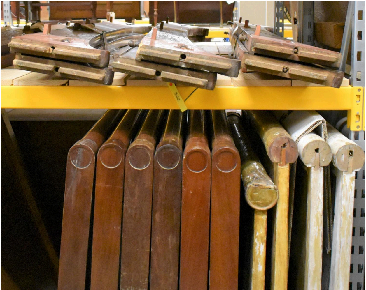
Vue générale - longs pans