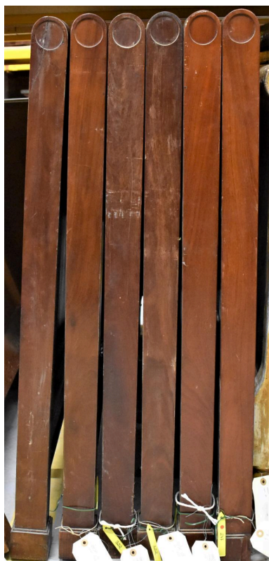
Vue générale - chevets