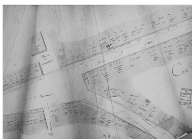
Plan de la Traversée de Montbrison en 1780, détail, feuille K-1 : n° 18 rue Saint-Jean. plan de 1780, C Gé0 143 IVR82_20084200307NUC