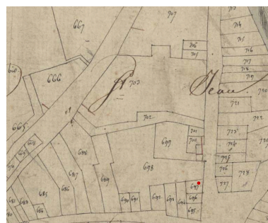
Extrait du plan cadastral de 1809, parcelle E 698. IVR82_20124201356NUD