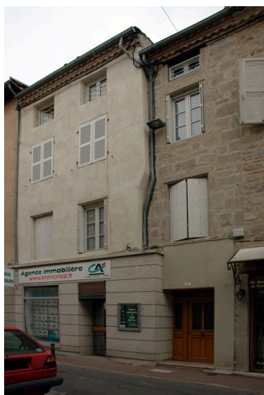
Vue générale IVR82_20124201357NUCA