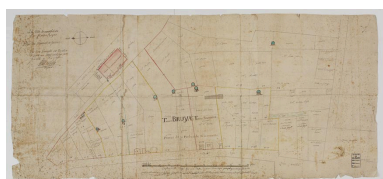
Plan des maisons et jardins, rue Simon Boyer en 1777. (A. Diana, Montbrison). Plan, 1777 B Diana Montbrison. C géo 149 (1) IVR82_20064200857NUCA