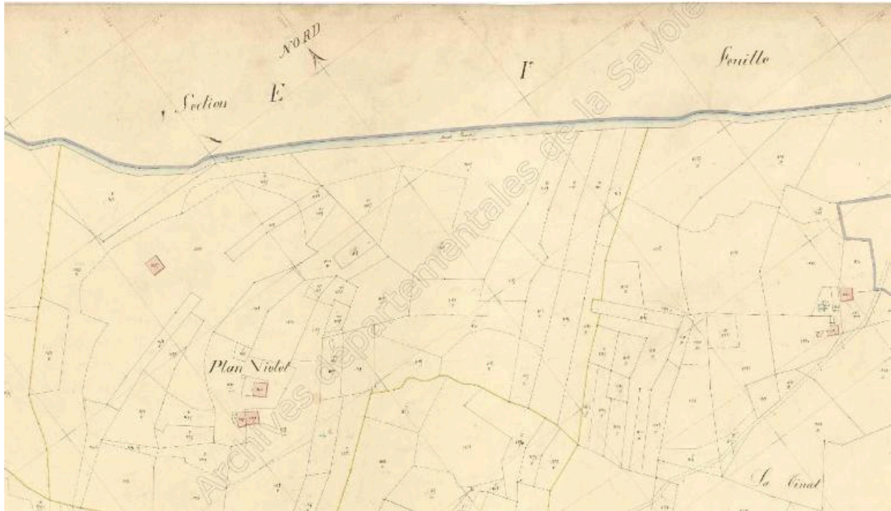
Premier cadastre français, Sainte-Hélène-sur-Isère, 1870, Section D, feuille 5 (FR.AD073, 3P 7503).