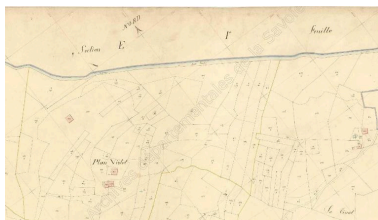
Premier cadastre français, Sainte-Hélène-sur-Isère, 1870, Section D, feuille 5 (FR.AD073, 3P 7503).