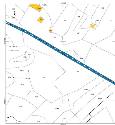
Cadastral actuel, 2014.