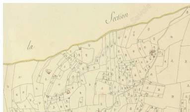
Cadastral napoléonien, Sainte-Hélène-sur-Isère, 1809 Section F, feuille unique (FR.AD073, L1006).