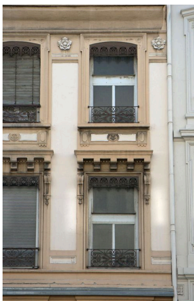
Elévation antérieure, détail des baies des 1er et 2e étages IVR82_20086903027NUCA