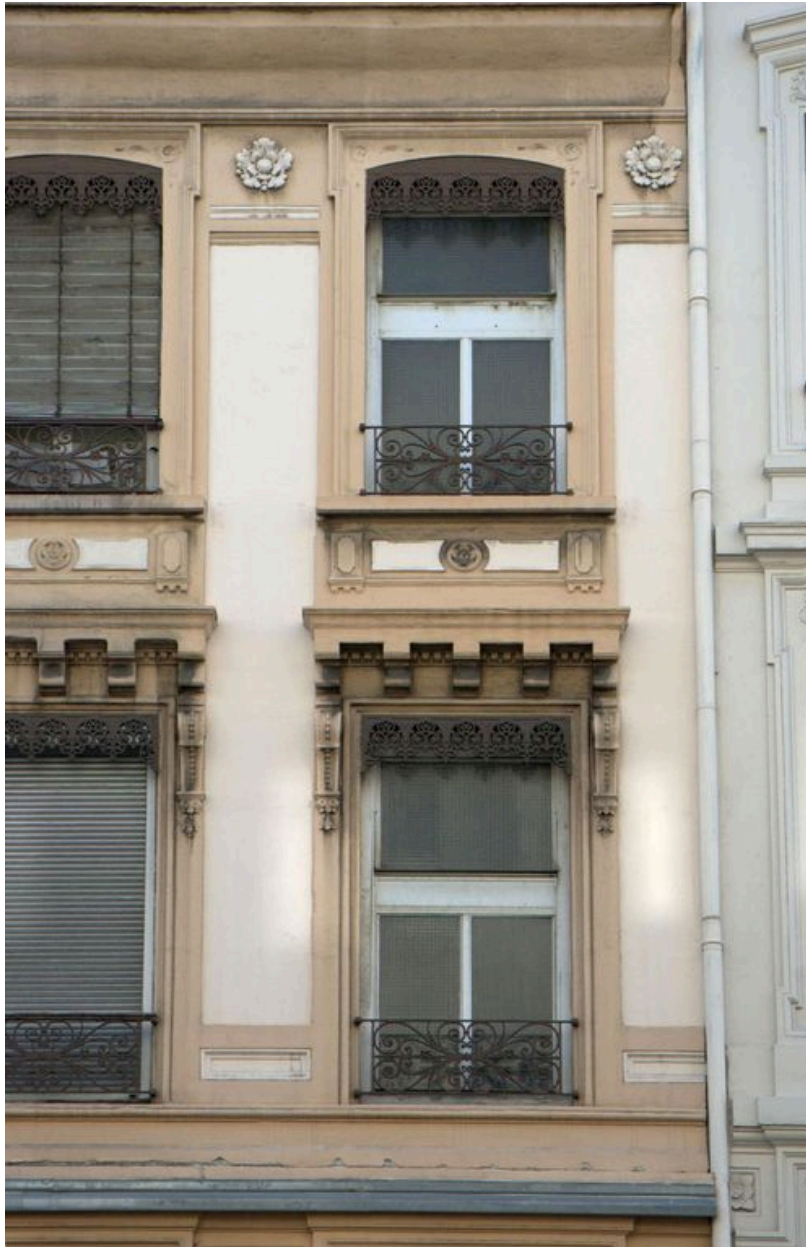
Elévation antérieure, détail des baies des 1er et 2e étages