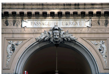
Entrée du passage de l'Argue, détail des sculptures