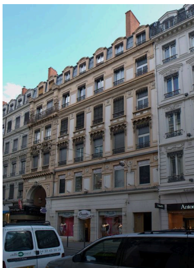
Vue générale IVR82_20086903017NUCA