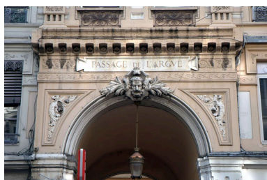
Entrée du passage de l'Argue, détail de l'arc IVR82_20086903021NUCA