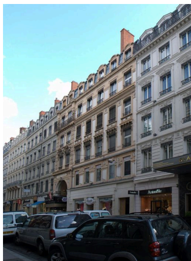
Vue d'ensemble des immeubles 69 et 71 rue du Pdt-Edouard- Herriot depuis le sud