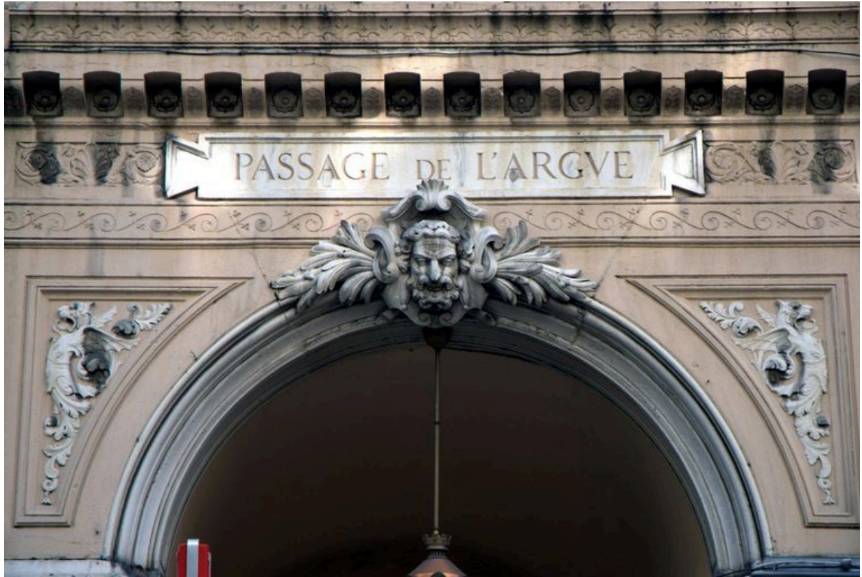
Entrée du passage de l'Argue, détail des sculptures