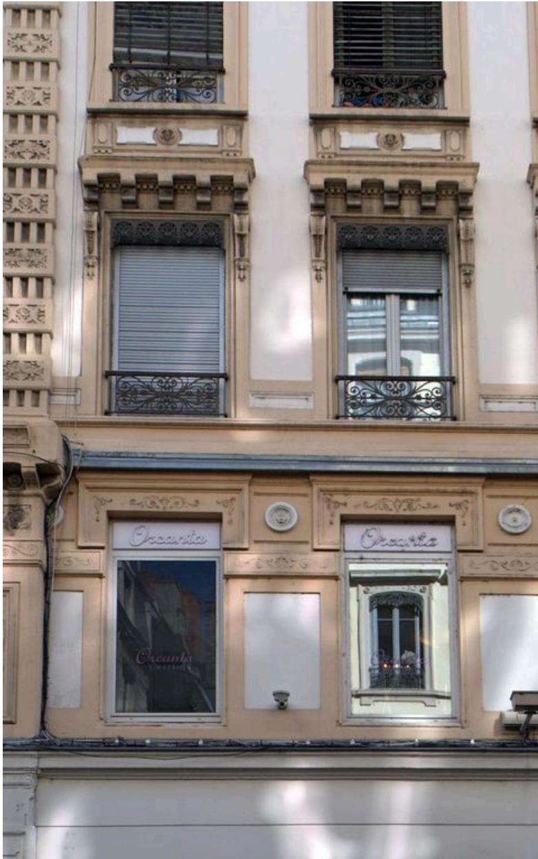
Elévation antérieure, détail des baies de l'entresol et du 1er étage