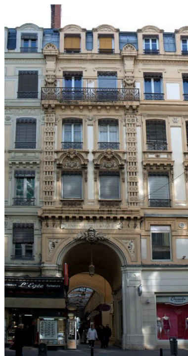
Vue d'ensemble de l'entrée du passage de l'Argue IVR82_20086903020NUCA