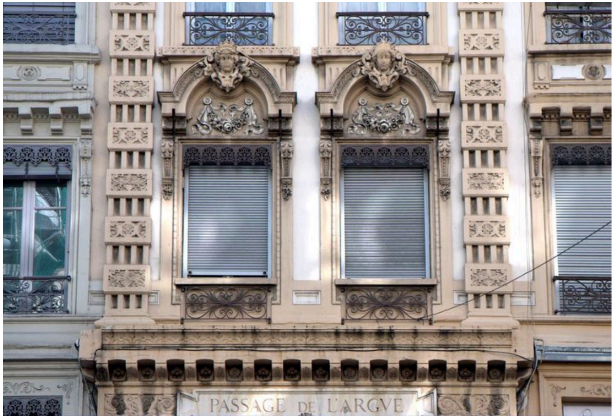
Entrée du passage, vue des baies du 1er étage