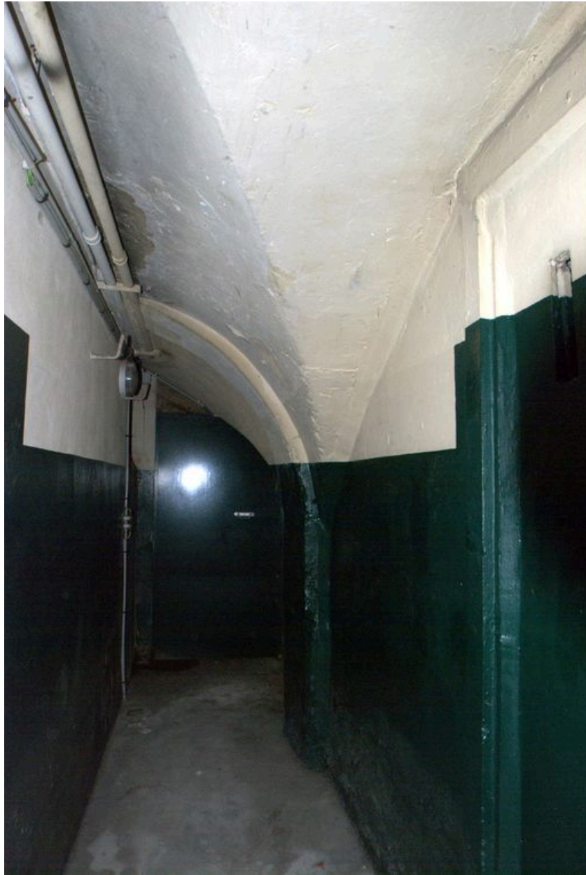
Caves, vue de l'angle est, au fond du couloir longeant la rue du Président-Edouard-Herriot