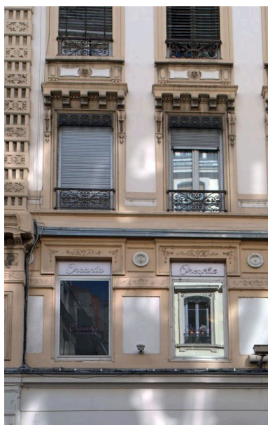
Elévation antérieure, détail des baies de l'entresol et du 1er étage IVR82_20086903026NUCA