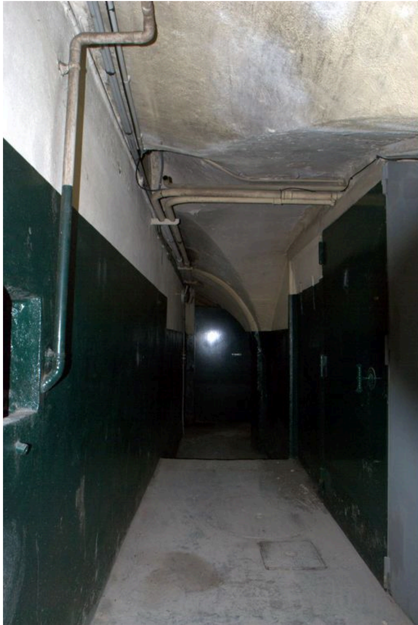
Caves, vue de l'angle ouest, au débouché de l'escalier