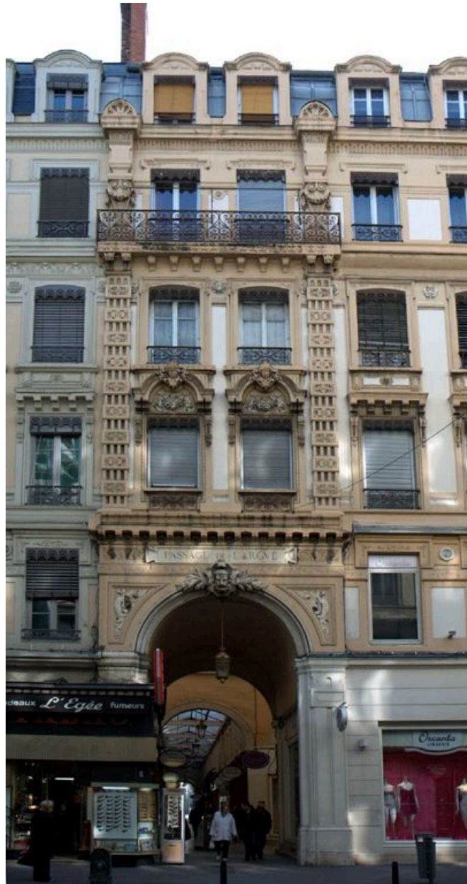
Vue d'ensemble de l'entrée du passage de l'Argue