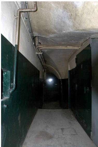
Caves, vue de l'angle ouest, au débouché de l'escalier

Entrée du passage, vue des baies du 3e étage et de l'étage de comble