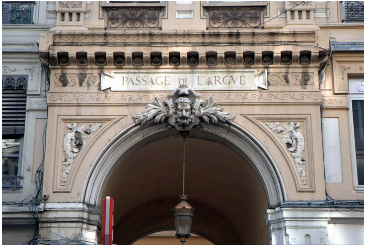
Entrée du passage de l'Argve, détail de l'arc