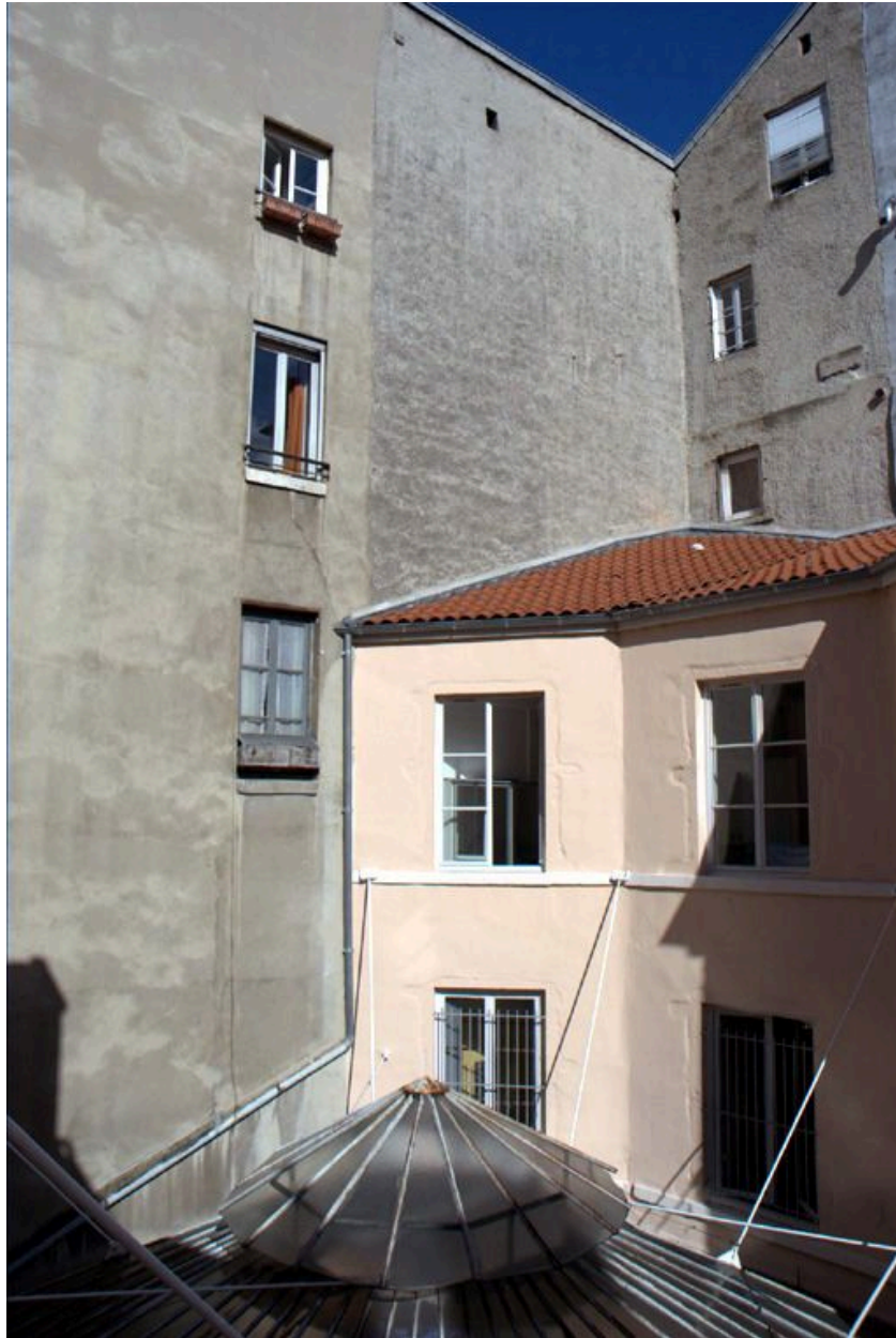
Vue partielle de l'élévation postérieure, au deuxième plan