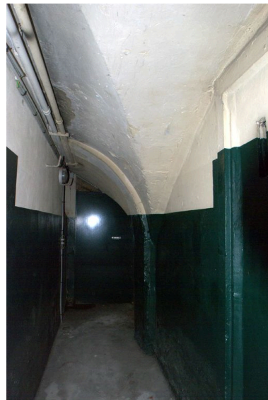
Caves, vue de l'angle est, au fond du couloir longeant la rue du Président-Edouard-Herriot IVR82_20086903048NUCA