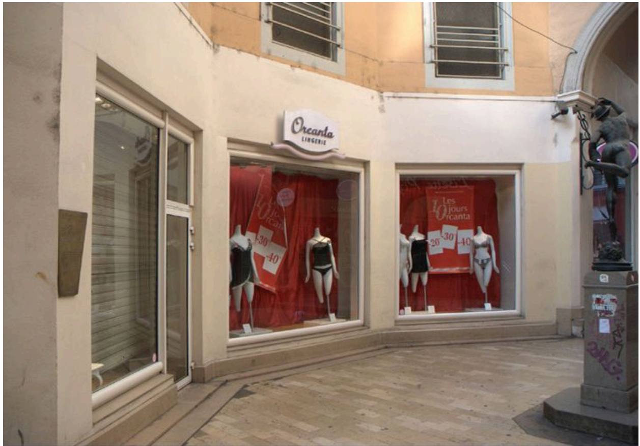
Vue du rez-de-chaussée sur la rotonde du passage de l'Argue