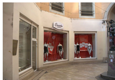
Vue du rez-de-chaussée sur la rotonde du passage de l'Argue