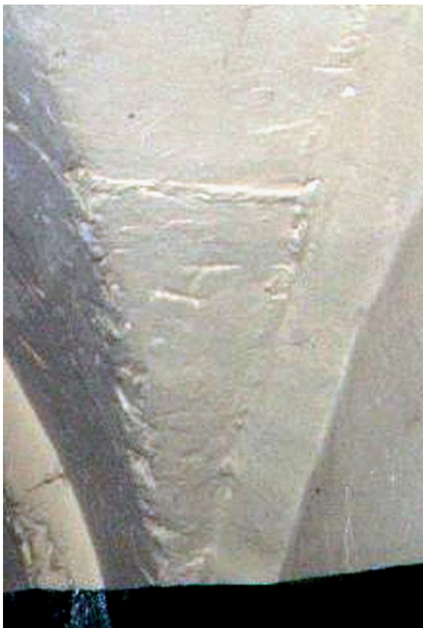
Caves, angle est, marque de tâcheron