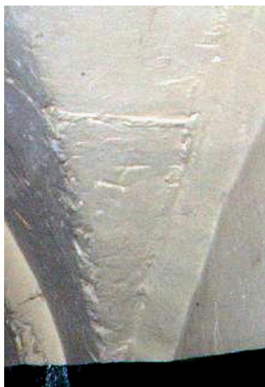
Caves, angle est, marque de tâcheron IVR82_20086903049NUCA