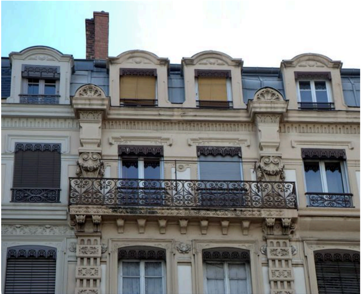
Entrée du passage, vue des baies du 3e étage et de l'étage de comble