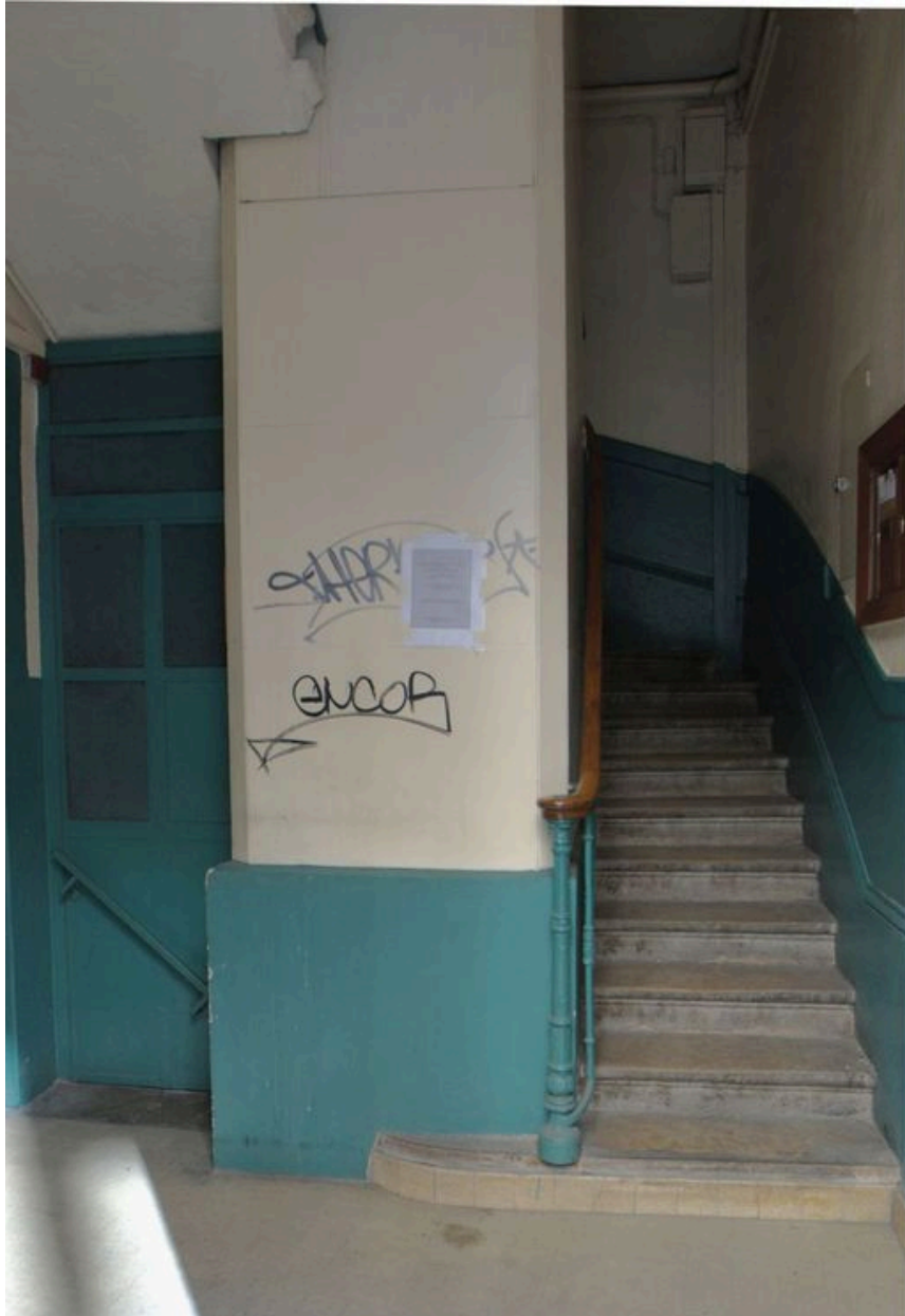
Vue de la première volée de l'escalier