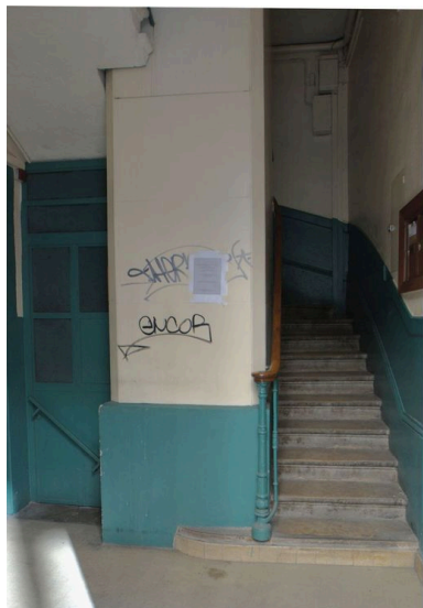
Vue de la première volée de l'escalier IVR82_20086903019NUCA

Entrée du passage, vue des baies du 3e étage et de l'étage de comble IVR82_20086903025NUCA