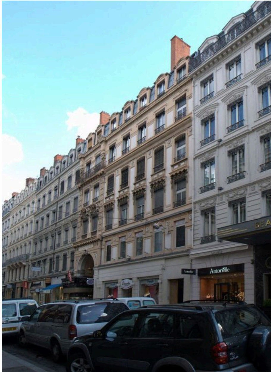
Vue d'ensemble des immeubles 69 et 71 rue du Pdt-Edouard-Herriot depuis le sud