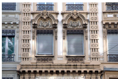
Entrée du passage, vue des baies du 1er étage