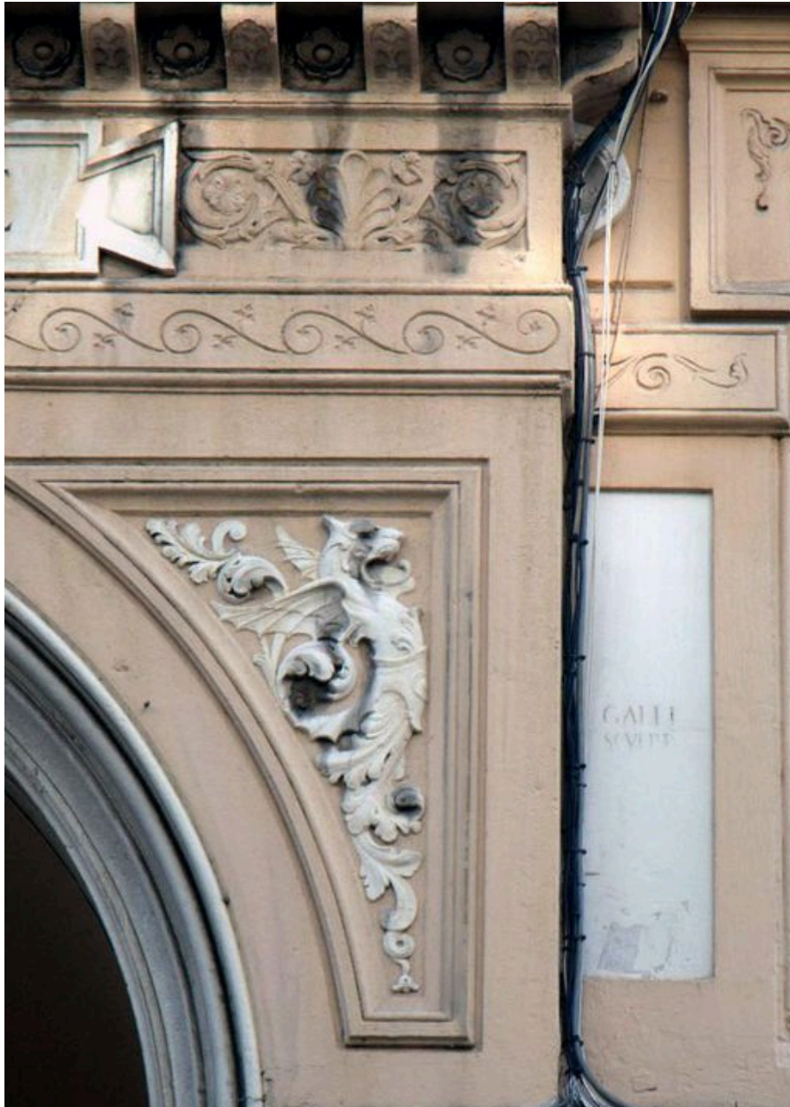
Entrée du passage de l'Argue, détail d'une sculpture : griffon