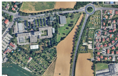
Vue des jardins ouvriers/ familiaux de Vénissieux (Google) IVR84_20256901398NUCA