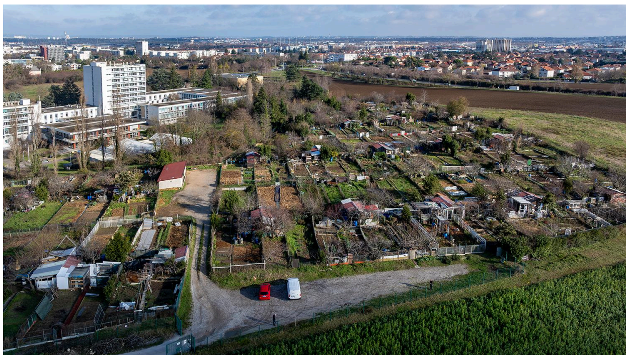
Jardins ouvriers Vénissieux la Garaine