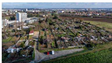
Jardins ouvriers Vénissieux la Garaine IVR84_20256901957NUCA