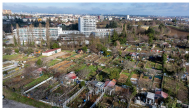
Jardins ouvriers Vénissieux la Garaine IVR84_20256901955NUCA