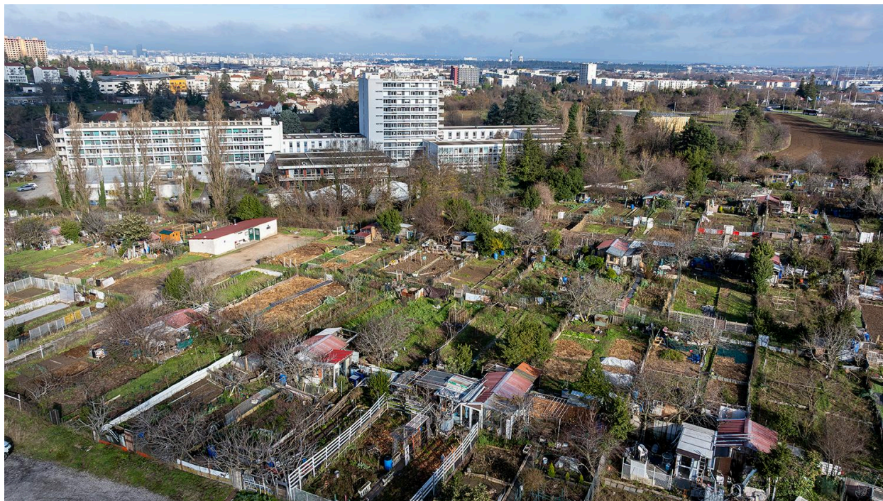
Jardins ouvriers Vénissieux la Garaine