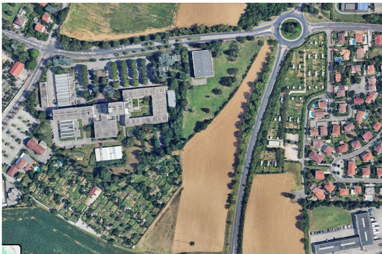
Vue des jardins ouvriers/familiaux de Vénissieux