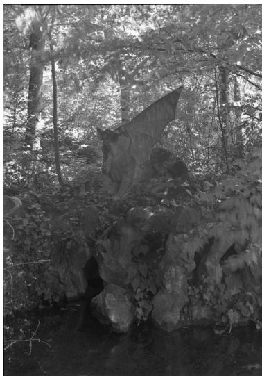
Rocaille et sculpture de jardin (dragon) sur la source canalisée. IVR82_19920100802P