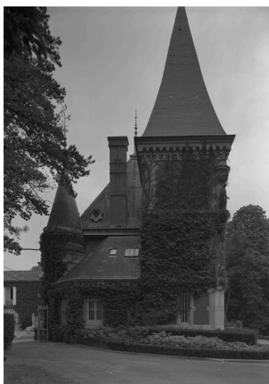
Elévation latérale gauche du corps de logis.