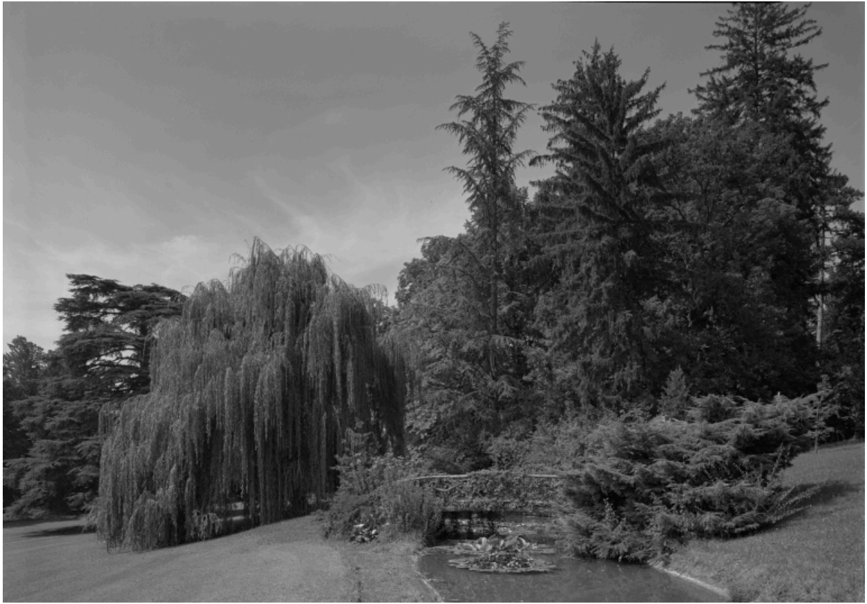
Parc, détail : ruisseau et passerelle en bois.