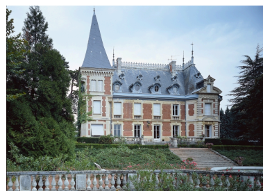
Façade antérieure. IVR82_19910100931PA