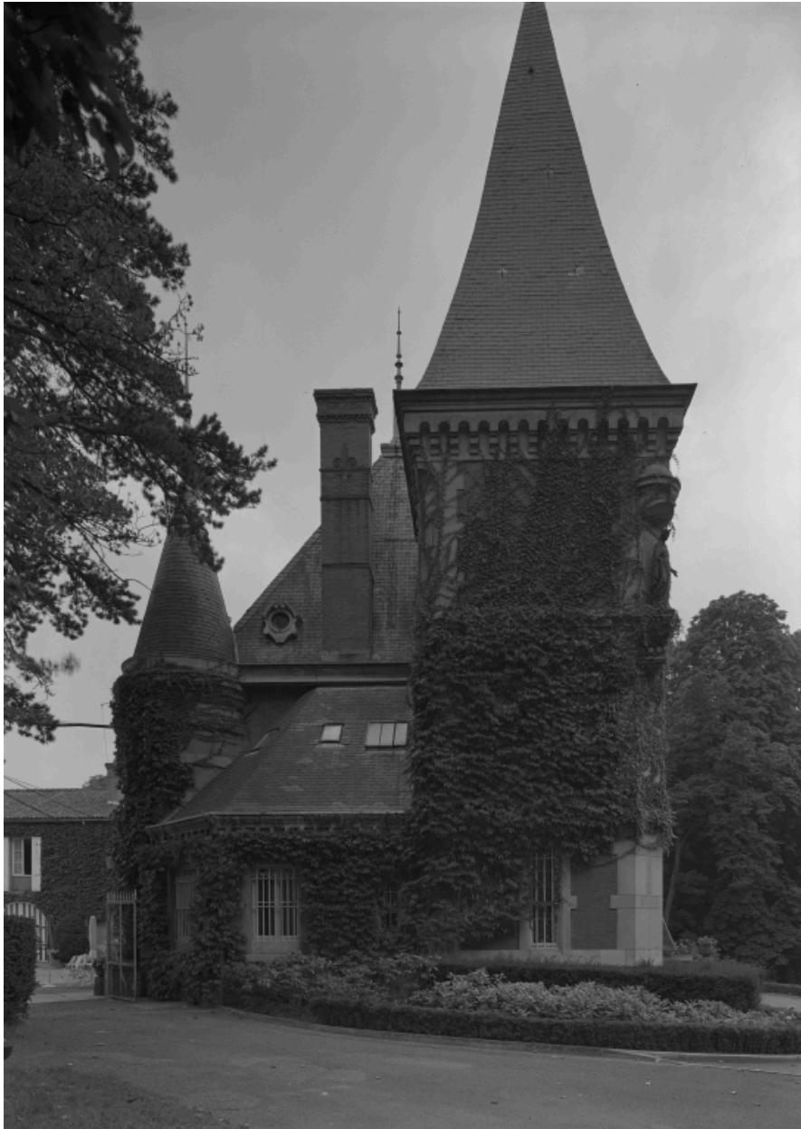
Elévation latérale gauche du corps de logis.