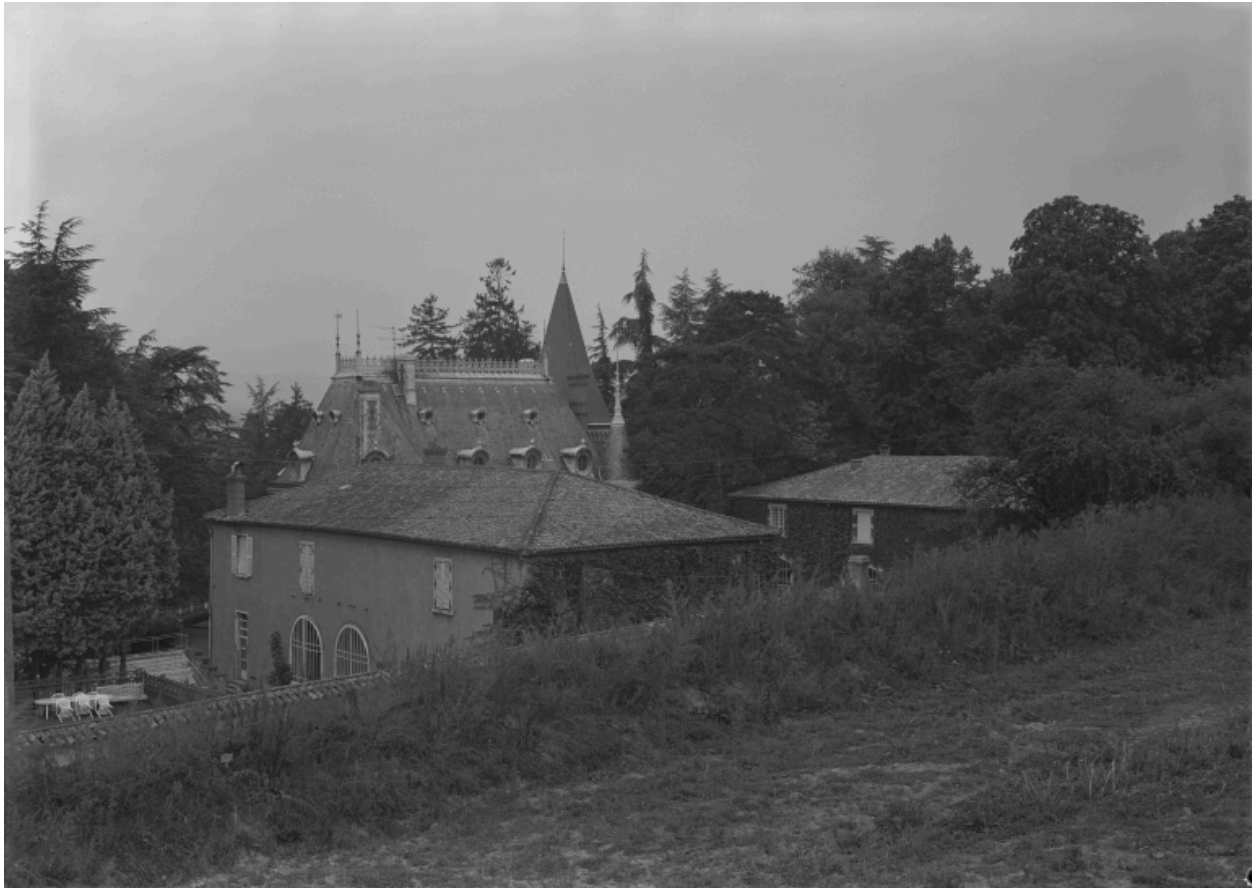
Vue d'ensemble des bâtiments, depuis l'est.