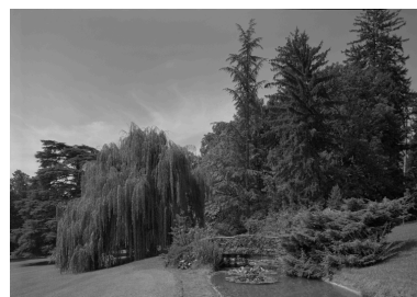
Parc, détail : ruisseau et passerelle en bois.