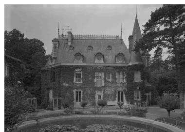
Façade postérieure sur cour.