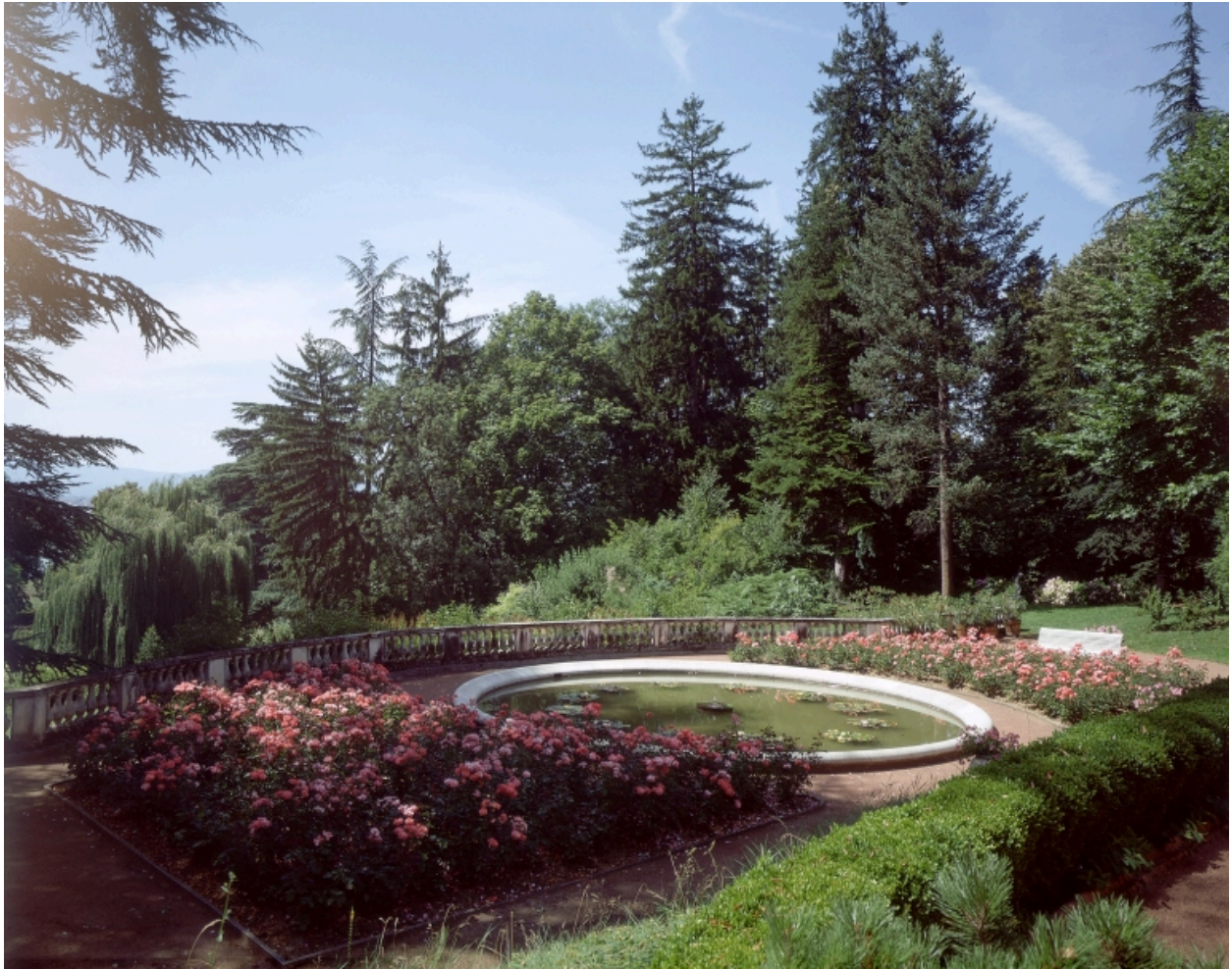
Terrasse et bassin, devant le corps de logis.