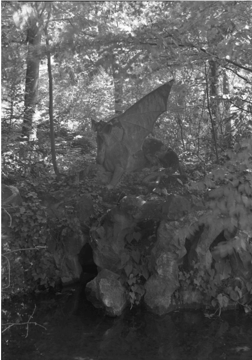
Rocaille et sculpture de jardin (dragon) sur la source canalisée.