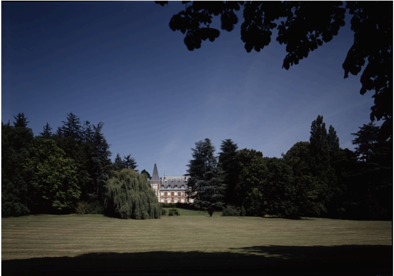
Vue d'ensemble depuis le portail d'entrée.