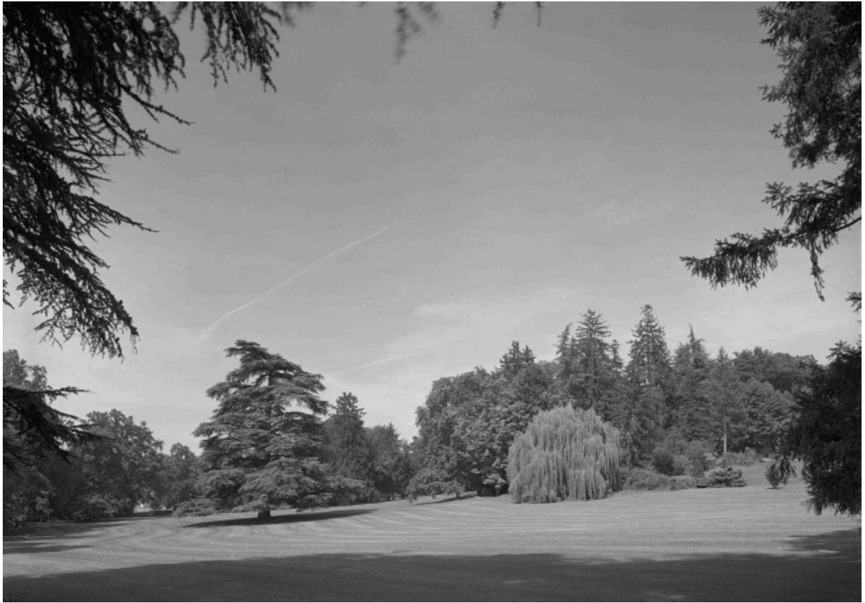
Parc, vue partielle depuis le sud-ouest.