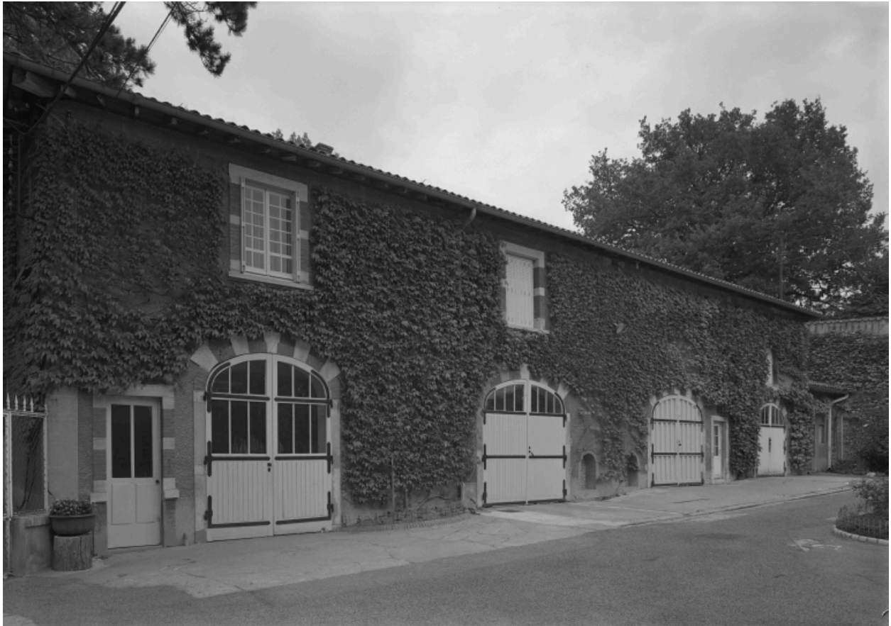
Communs, aile nord : anciennes écuries.