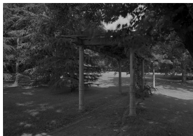
Pergola et glycine, dans une allée du parc.