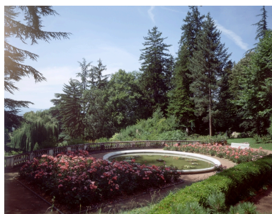
Terrasse et bassin, devant le corps de logis. IVR82_19920100798PA