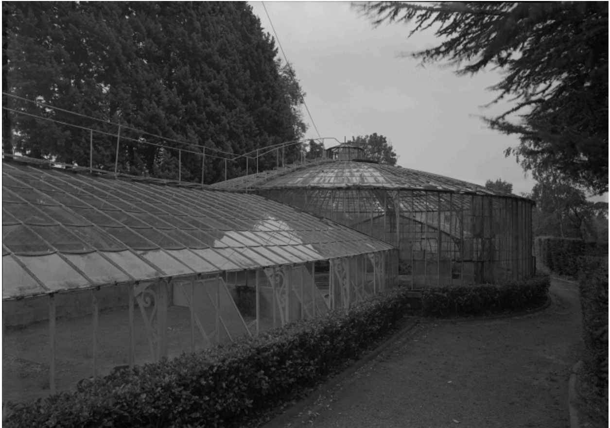
Serre et jardin d'hiver.