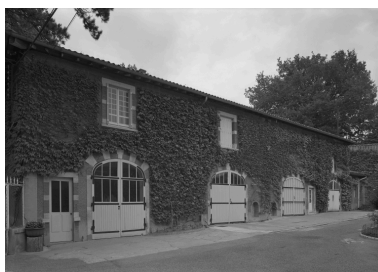
Communs, aile nord : anciennes écuries.