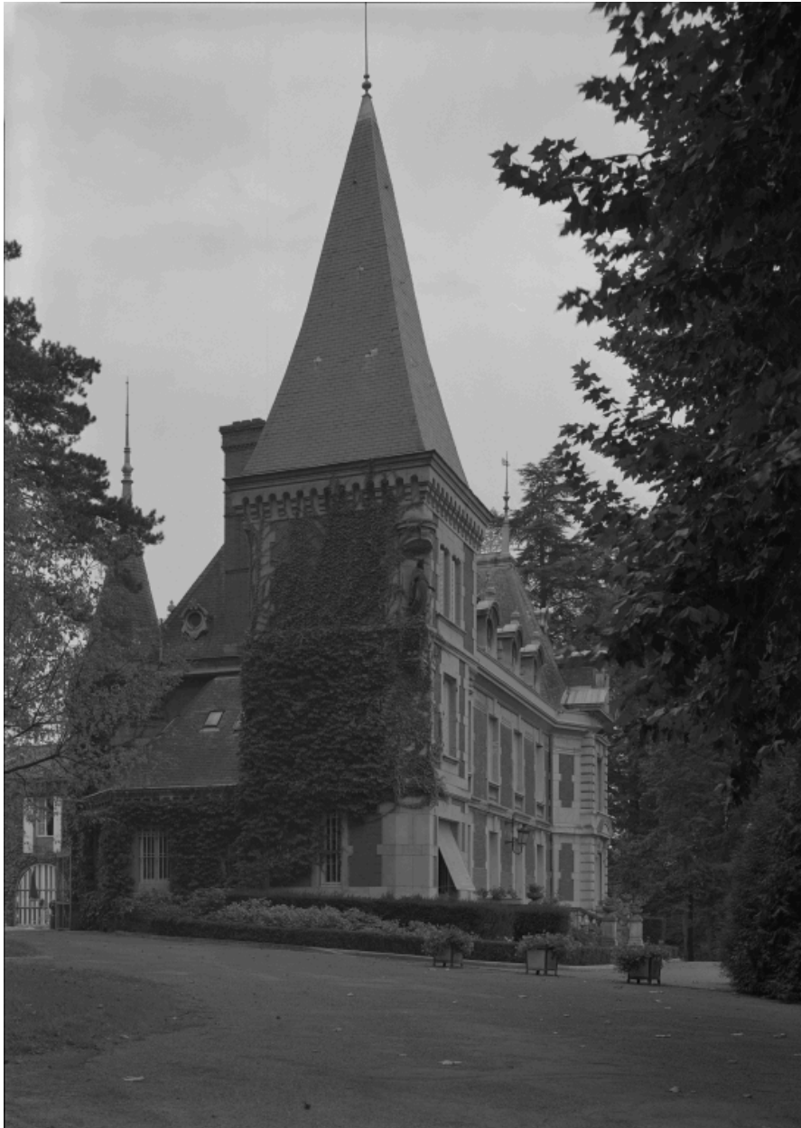
Corps de logis, vue de trois-quarts depuis le nord-ouest.