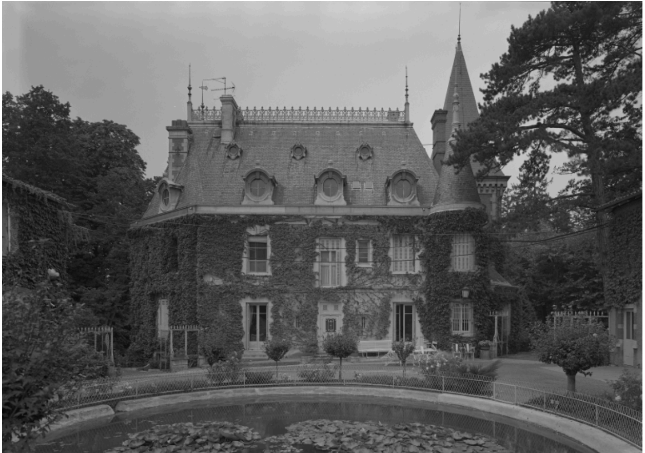
Façade postérieure sur cour.