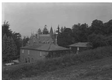
Vue d'ensemble des bâtiments, depuis l'est. IVR82_19910100929P