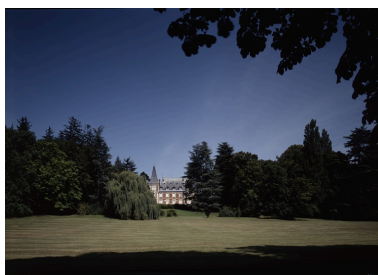
Vue d'ensemble depuis le portail d'entrée.