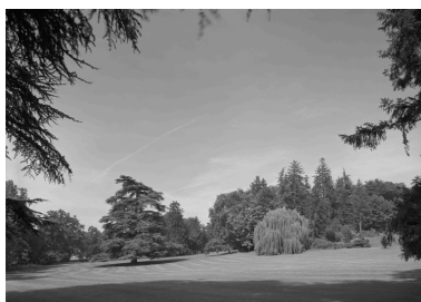
Parc, vue partielle depuis le sud-ouest.