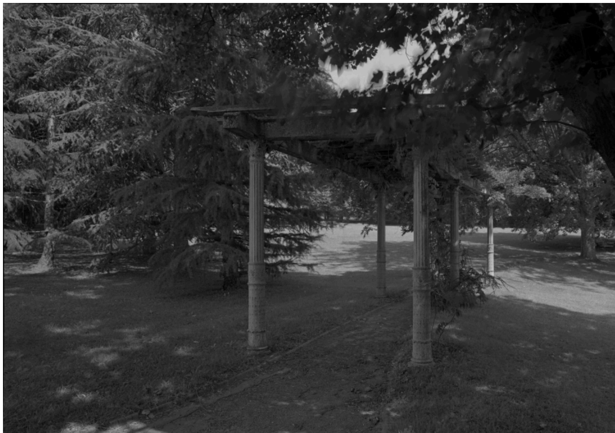
Pergola et glycine, dans une allée du parc.