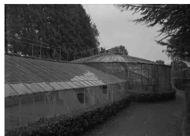
Serre et jardin d'hiver.