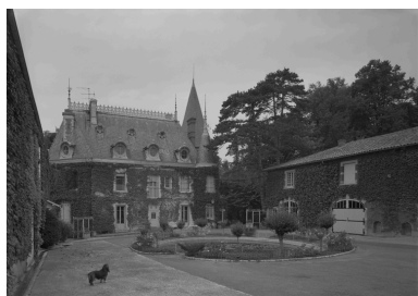
Corps de logis et communs, élévations sur cour.