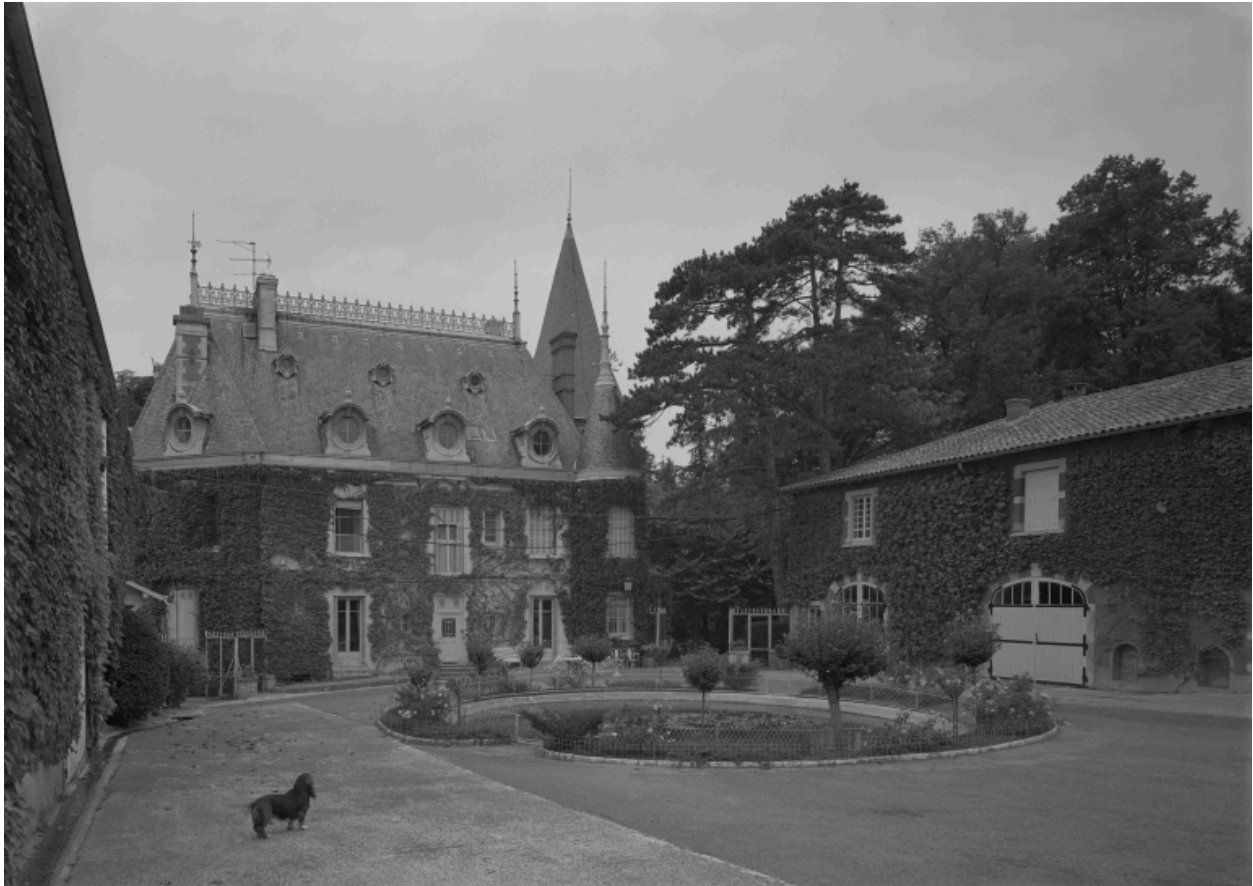
Corps de logis et communs, élévations sur cour.