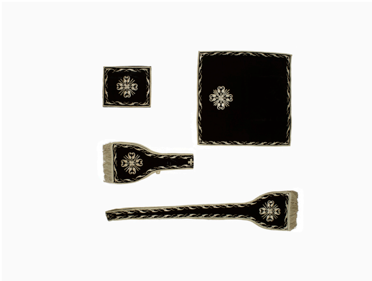
Vue de l'étole, du manipule, du voile de calice, de la bourse de corporal