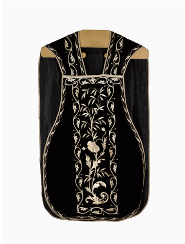
Vue du devant de la chasuble IVR84_20184300243NUC4A