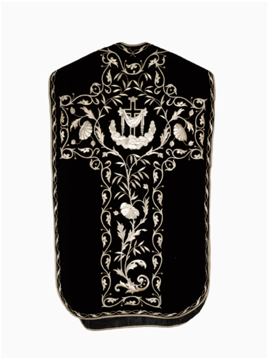
Vue du dos de la chasuble