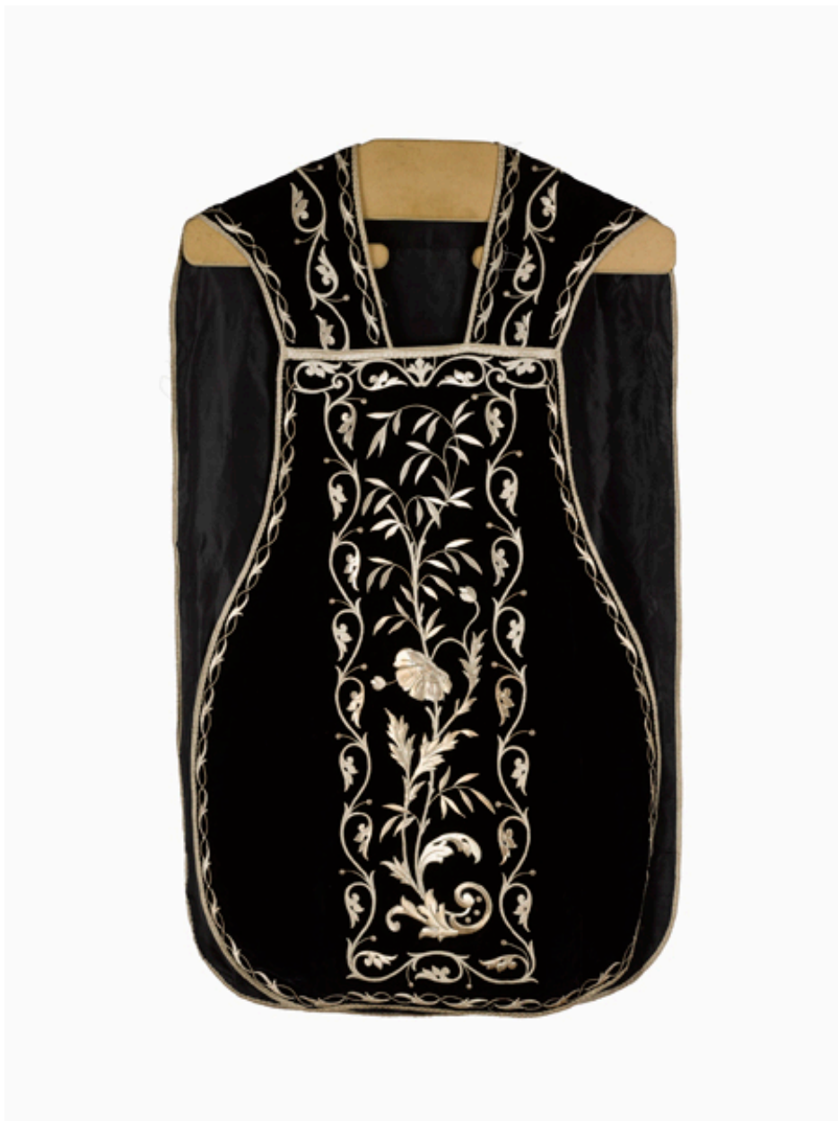
Vue du devant de la chasuble