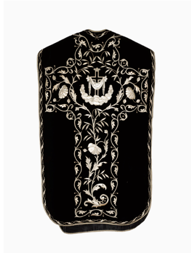
Vue du dos de la chasuble IVR84_20184300244NUC4A