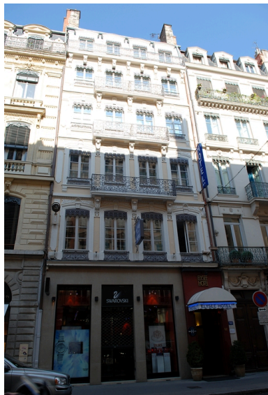
Vue générale IVR82_20096904730NUCA