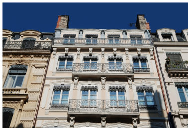
Elévation antérieure : partie supérieure IVR82_20096904731NUCA