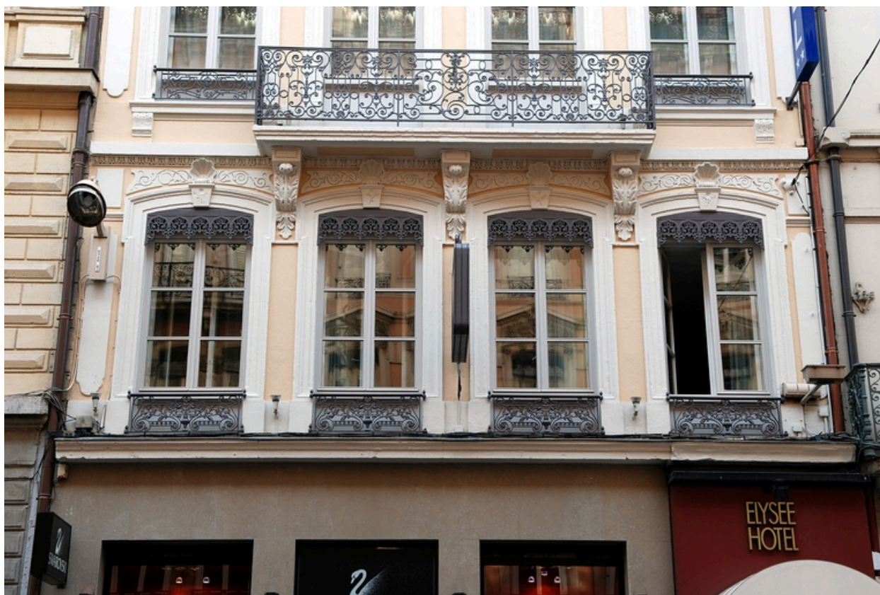
Elévation antérieure : premier et deuxième étages carrés