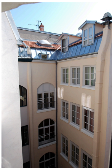
Elévation sur cour depuis l'escalier ouest du 9 rue des Archers IVR82_20096904734NUCA