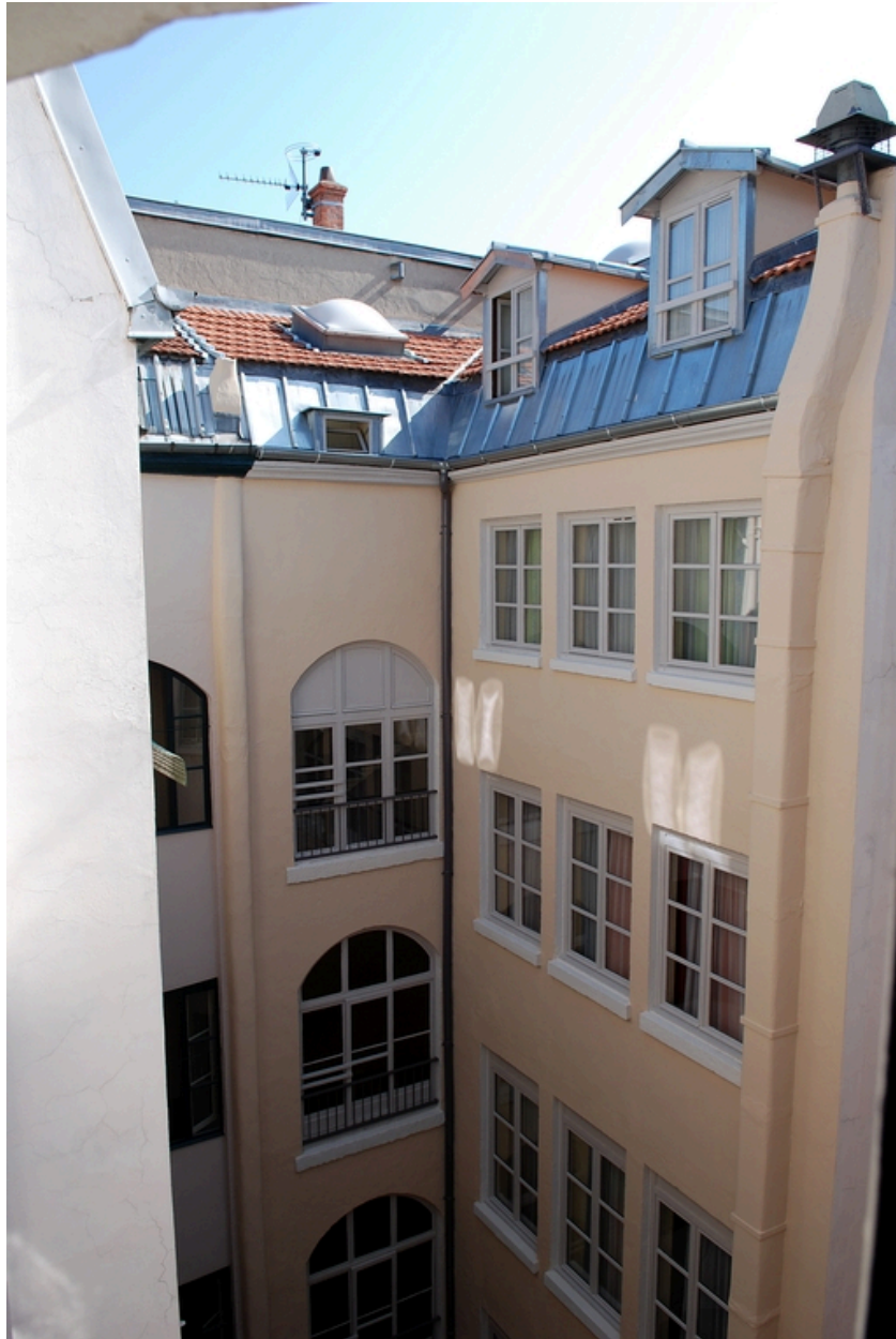
Elévation sur cour depuis l'escalier ouest du 9 rue des Archers