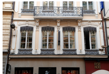
Elévation antérieure : premier et deuxième étages carrés IVR82_20096904732NUCA