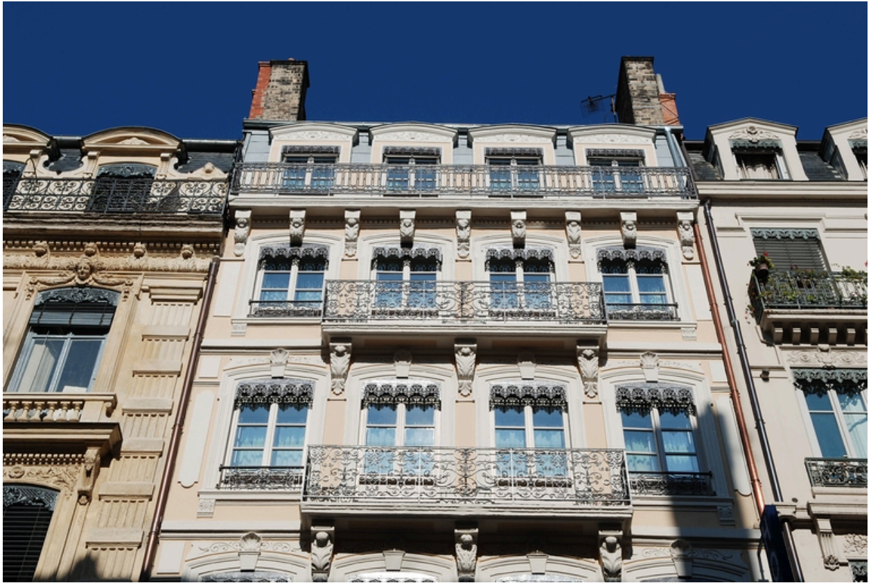
Elévation antérieure : partie supérieure