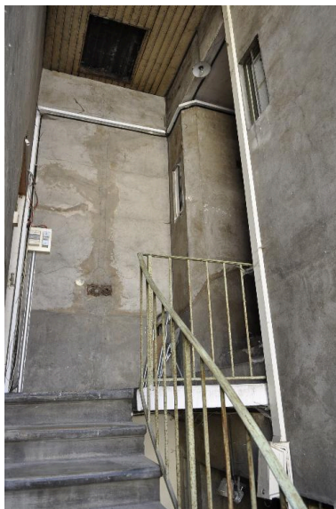
Vue du dernier palier de l'escalier