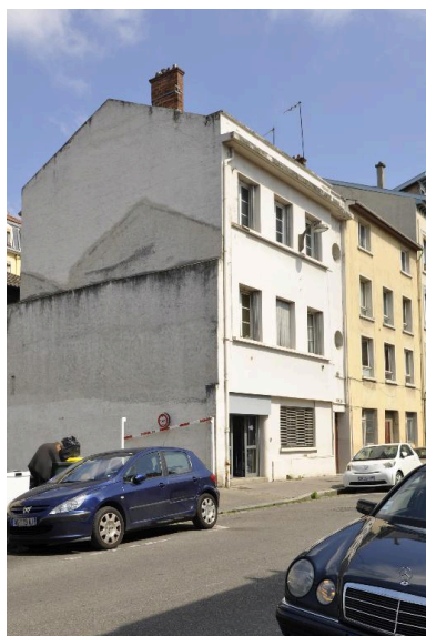
Vue d'ensemble, depuis le sud-est IVR84_20166900698NUCA