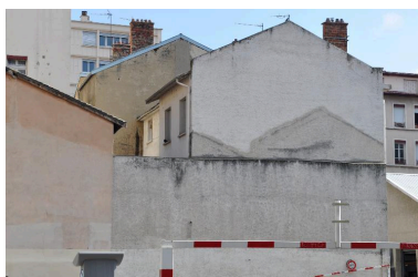
Mur pignon sud, traces possibles des anciens bâtiments remaniés et agrandis en 1935