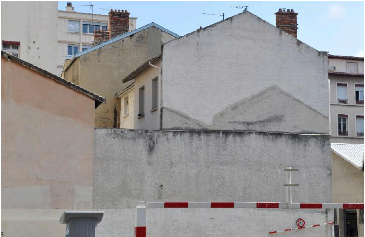
Mur pignon sud, traces possibles des anciens bâtiments remaniés et agrandis en 1935