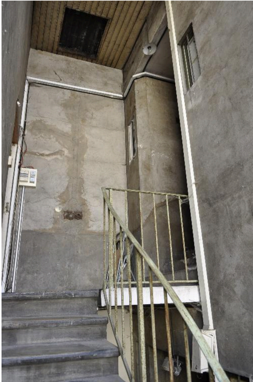
Vue du dernier palier de l'escalier