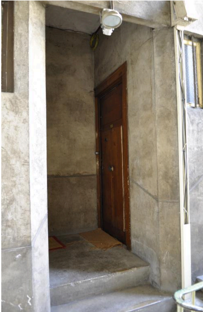
Vue du premier palier de l'escalier