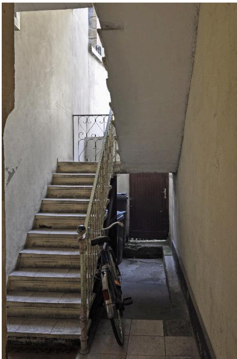
Vue de l'escalier commun aux n°18 et 20, rue Béchevelin