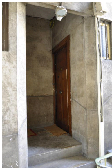
Vue du premier palier de l'escalier