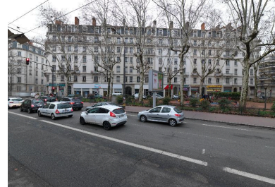
La place, partie est, vue depuis le nord IVR84_20186900185NUCAQ