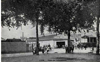
La place vers 1905 (AC Lyon FI 118)

Repro. Catherine Guégan, Autr. auteur inconnu IVR84_20166901803NUCB