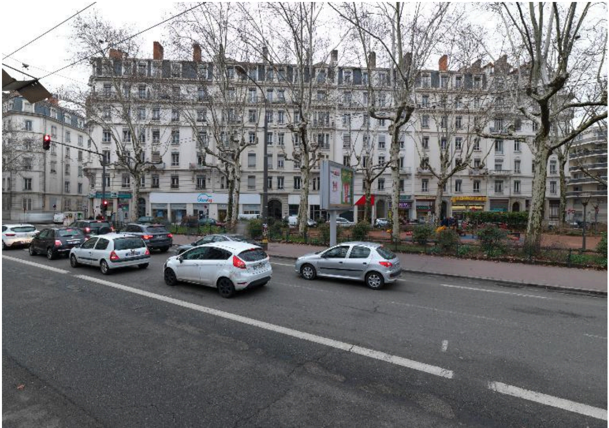
La place, partie est, vue depuis le nord