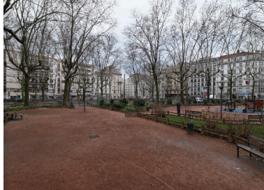
La place et le square, vus depuis le nord-ouest IVR84_20186900190NUCAQ

IVR84_20166901803NUCB