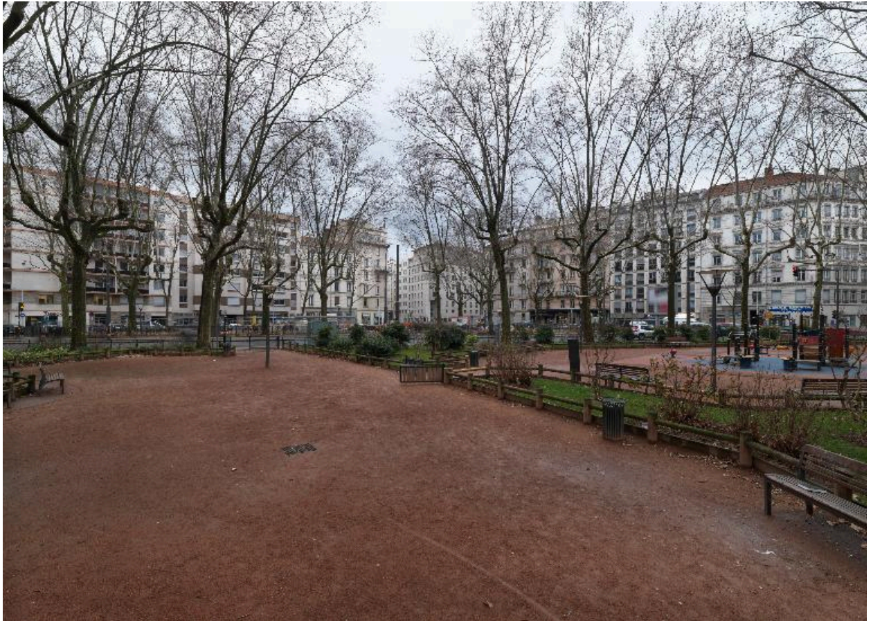
La place et le square, vus depuis le nord-ouest