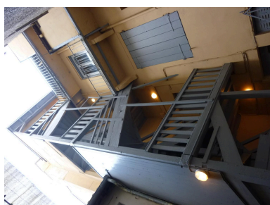
Escalier bois extérieur