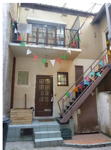
Vue de la façade sur cour IVR84_20186901390NUCA