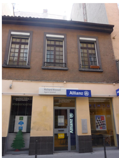
Immeuble du 6 rue du Mail escalier commun au n°8 IVR84_20186901388NUCA