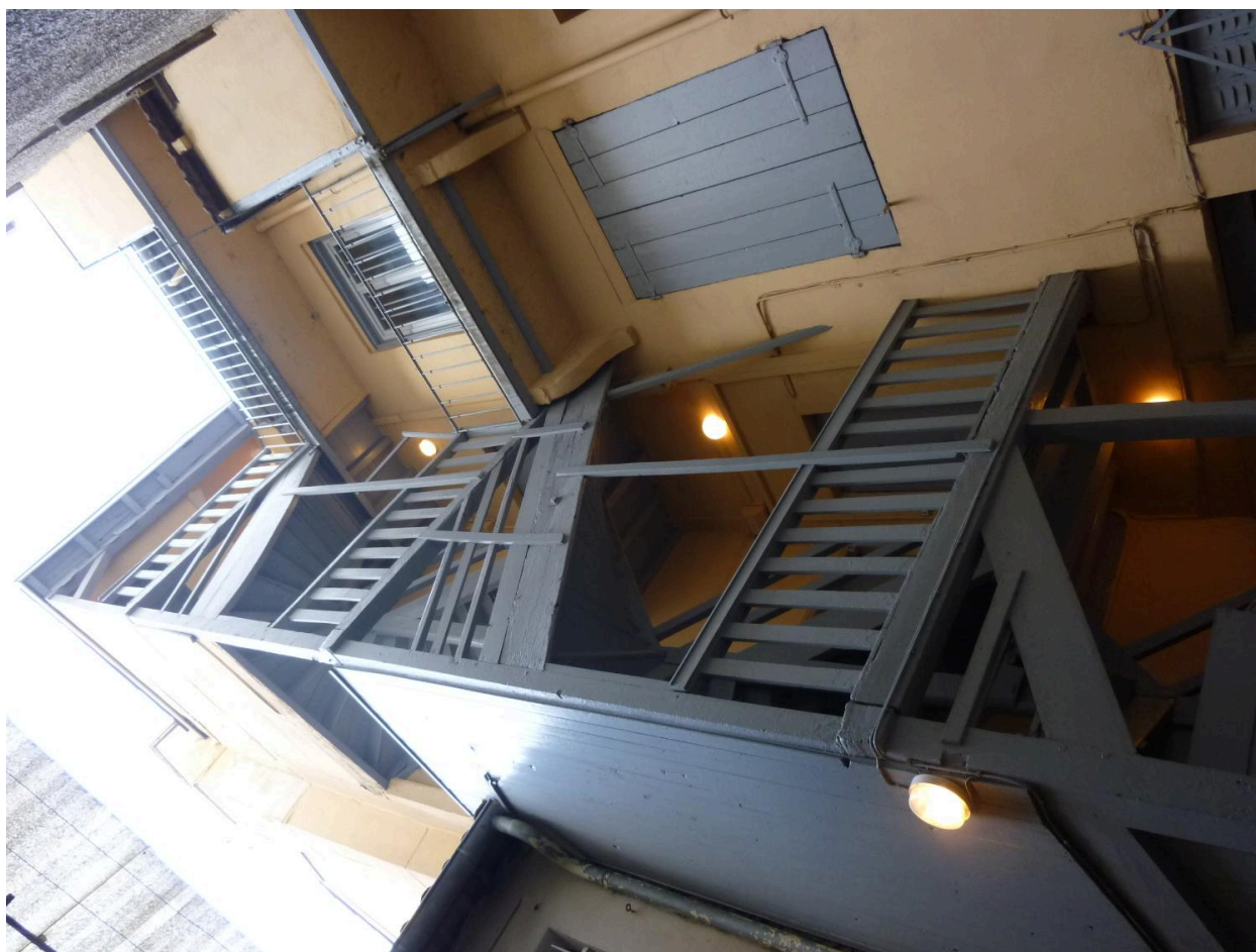
Escalier bois extérieur