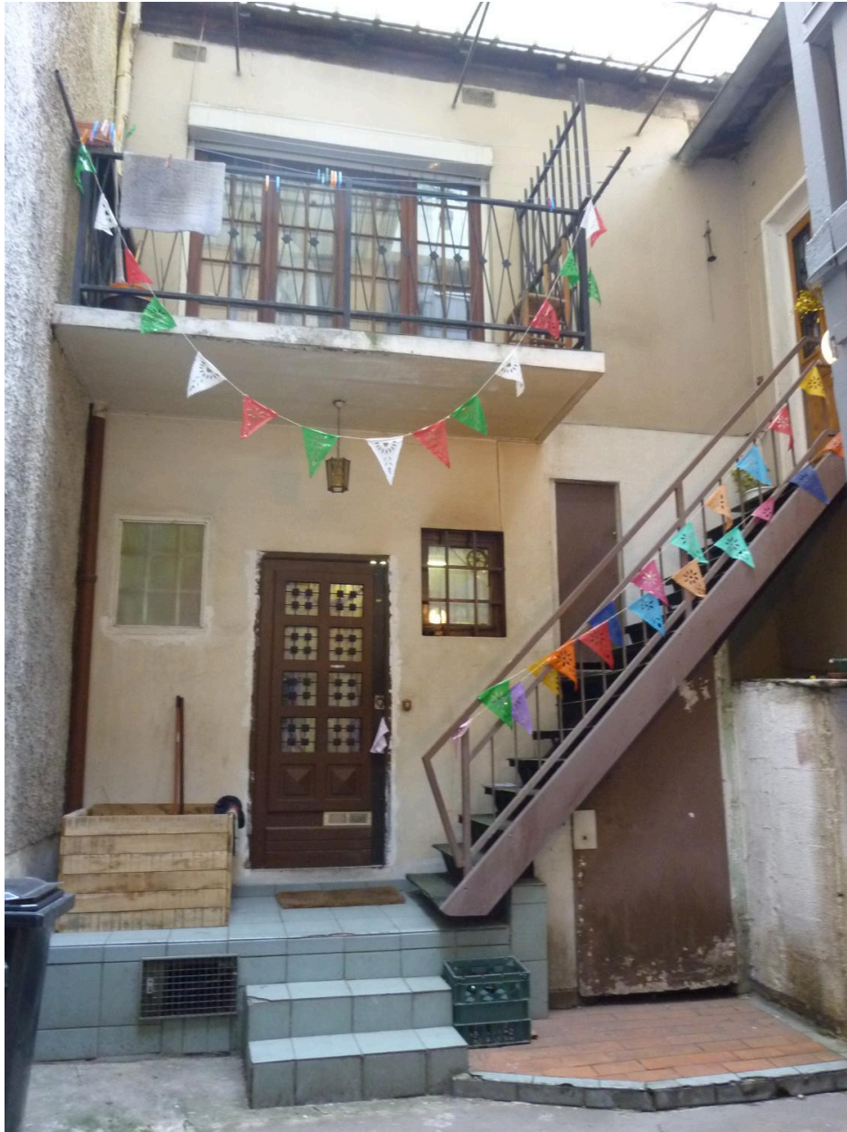
Vue de la façade sur cour