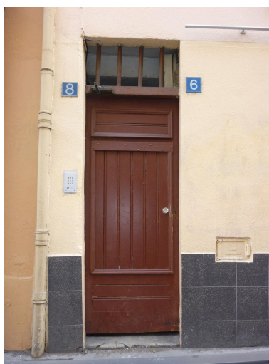
Porte piétonne IVR84_20186901389NUCA