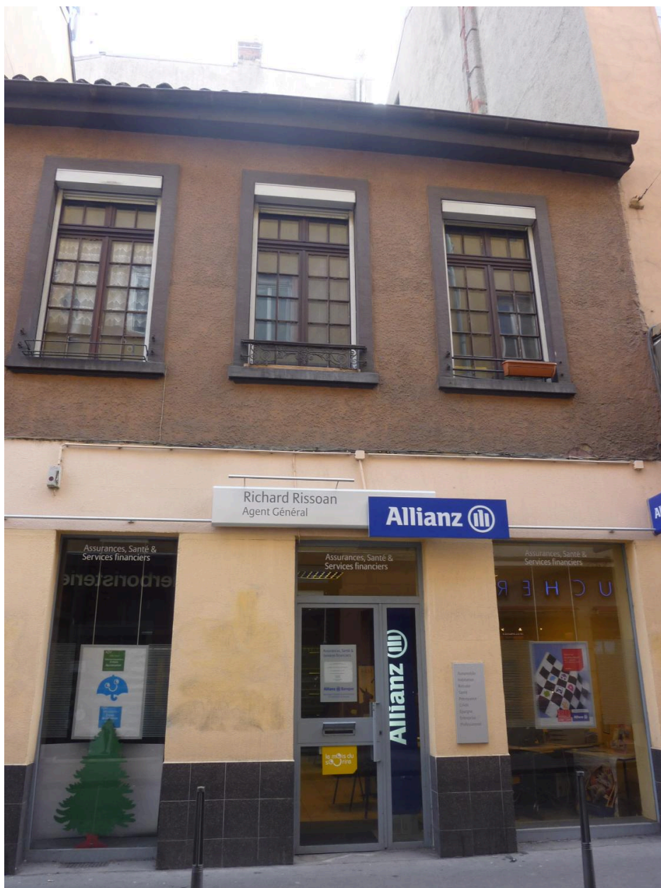
Immeuble du 6 rue du Mail escalier commun au n°8