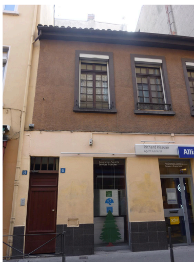
Façade principale