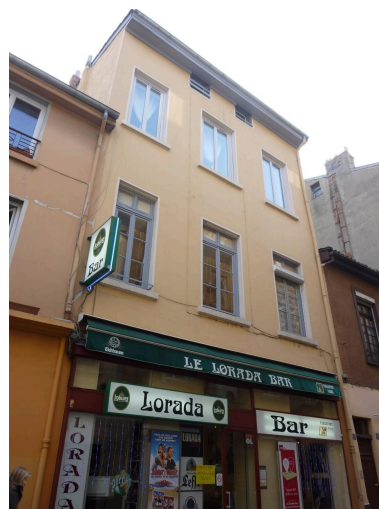
Vue d'ensemble IVR84_20186901393NUCA