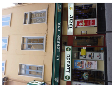
Façade principale