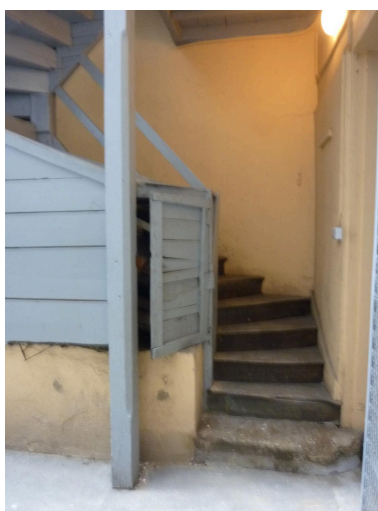
Détail escalier