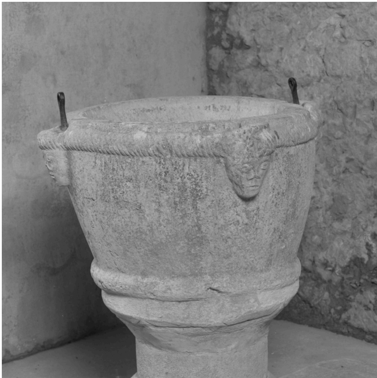
La cuve, vue sous un autre angle.