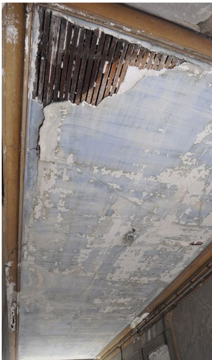
Plafond de l'allée