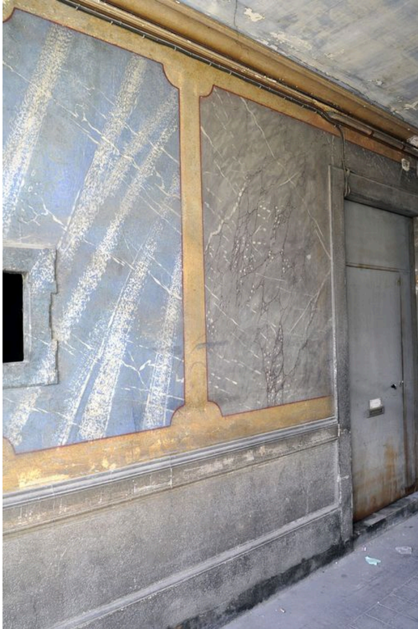
Mur de l'allée