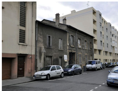
Vue générale IVR82_20106900923NUCA