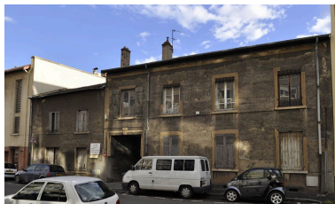
Façade antérieure IVR82_20106900928NUCA