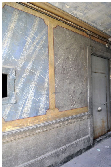
Mur de l'allée IVR82_20106900926NUCA