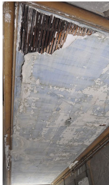
Plafond de l'allée IVR82_20106900924NUCA