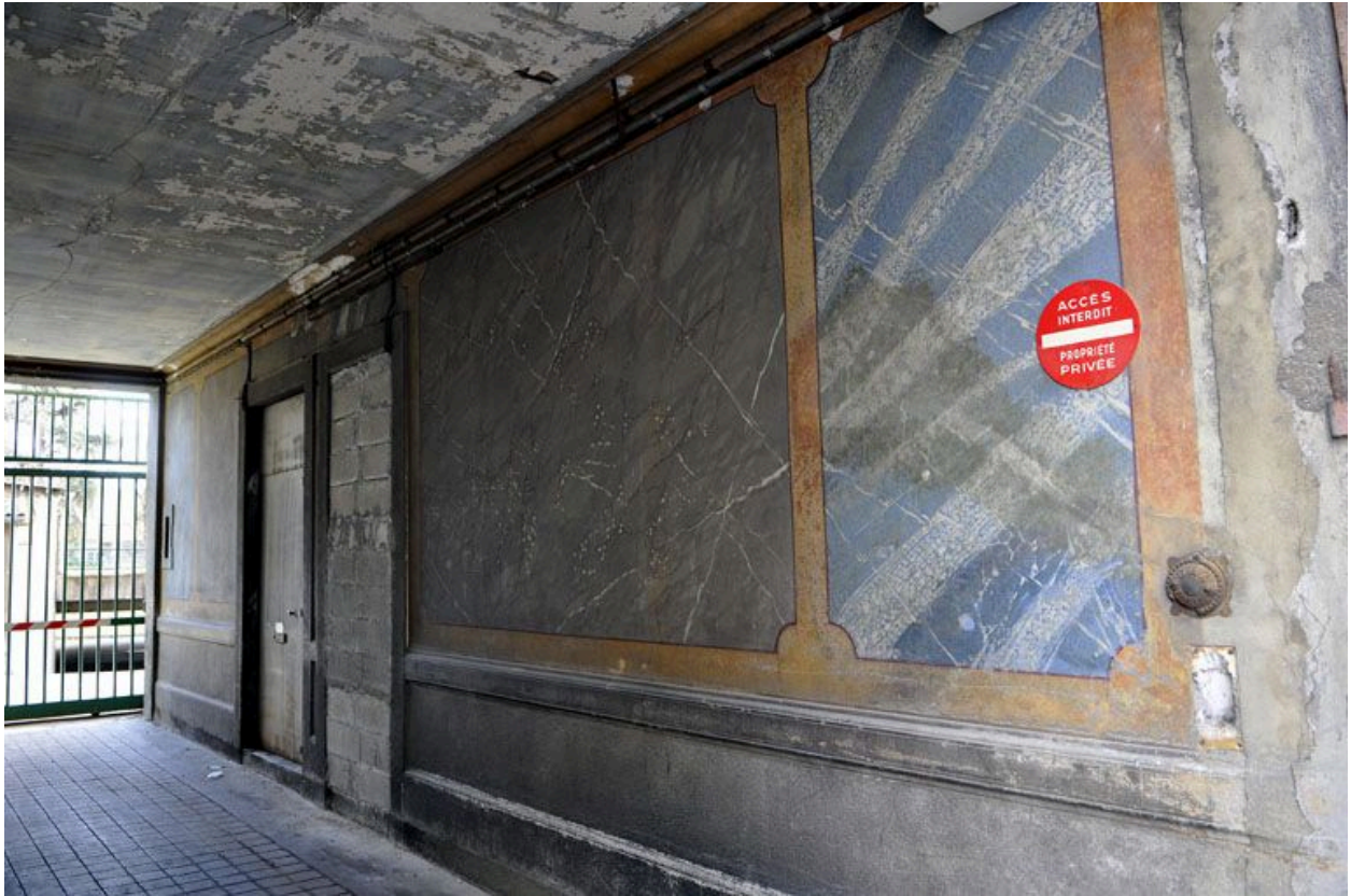
Mur de l'allée