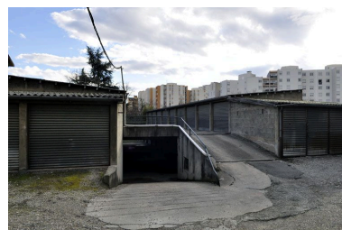
Vue extérieure; arrière de la parcelle, garages.