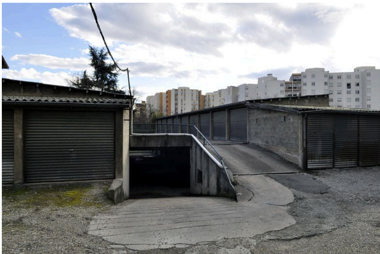
Vue extérieure; arrière de la parcelle, garages.